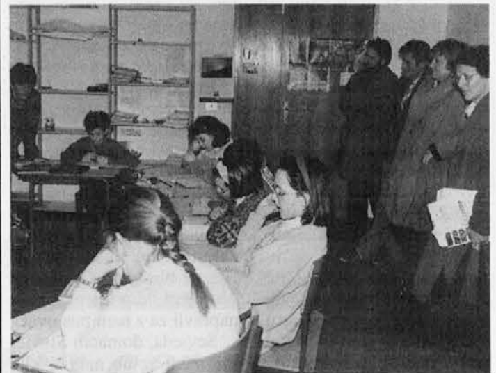
Durante la lezione di matematica in quinta elementare

Nell'ambito di un convegno universitario