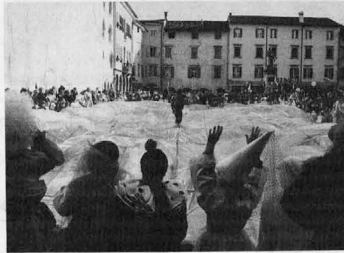
Na čedajskem placu so napravli celuo muorje...