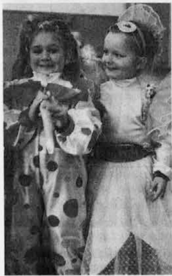
Dvie vesele maskere

vartca sli hodit po Spietru, v petak zvečer, pa takuo, ki so naredil an lan, so napravli veselo pustovanje za otroke sami starši. Na skupina je parpravla igre za te male an