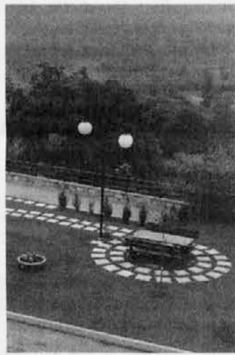
L'esempio di Azzida

Per un ambiente più pulito e per una più dignitosa presenza dell'uomo, del suo lavoro e del suo impegno sul territorio. Anche quest'anno il sindaco di S. Pietro Marinig lancia il suo invito-appello agli abitanti del comune affinché si rendano promotori di iniziative singole o associate. Marinig identifica queste iniziative in 12 punti: la pulizia dei cortili e dei borghi privati, l'abbellimento di case, balconi e giardini, la rimozione di materiale vario risultante dai lavori edili, la demolizione di manufatti provvisori poco de-