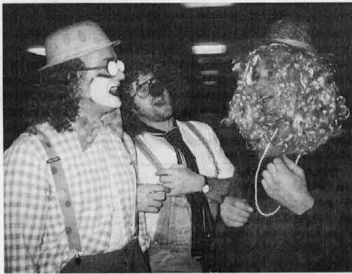
Te veliki so napravli veselo pustovanje za otroke

vartca sli hodit po Spietru, v petak zvečer, pa takuo, ki so naredil an lan, so napravli veselo pustovanje za otroke sami starši. Na skupina je parpravla igre za te male an