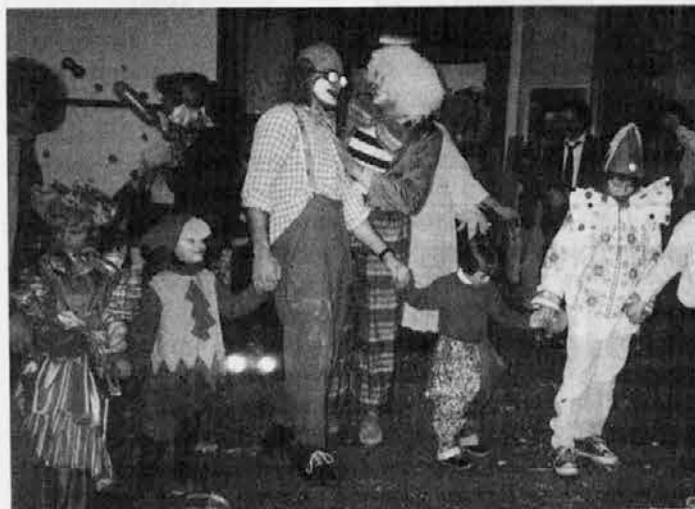
Na otroškem pustovanju v dvojezičnem vartcu

pa so ga organizal v saboto popudan na placu žen. Zbralo se je puno masker, se posebno puno otrok, bluo pa je an puno te velic, saj so organizal bogato tombolo.