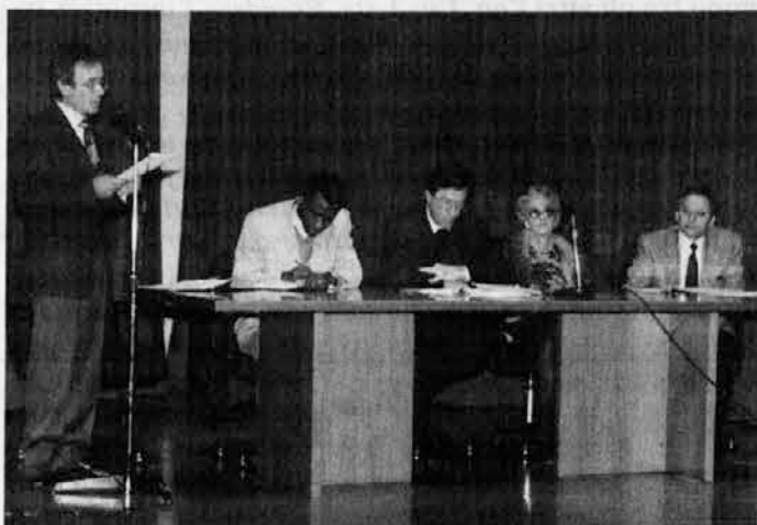
Na srečanju z dijaki iz Spetra in Cedad

Z uspehom se nadaljujejo srečanja, ki jih spetsko učiteljske in cedajski licej prirejata v Cedadu o aktualnih političnih vprašanjih. Predavanja, na katera so vabljeni strokovnjaki in priče oziroma žrtve nestrpnosti in nasilja, so namenjena solski mladini, ki na ta način lahko poglubi poznavanje in vzroke določenih pojavov.