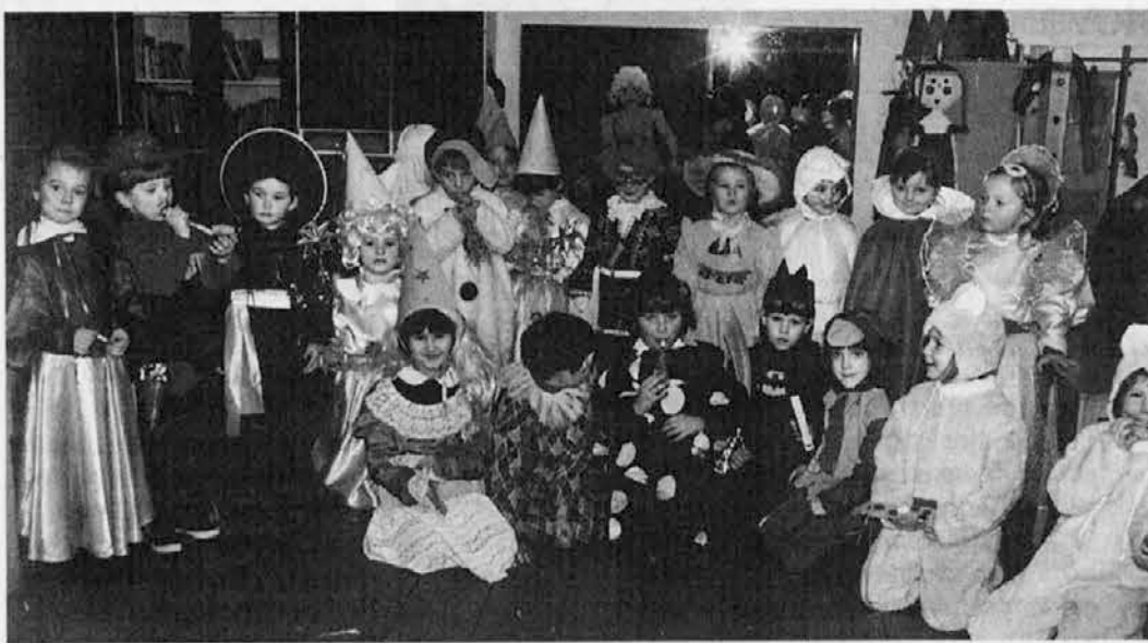
Pred pustnim sprehodom po Spietru se je liepa an vesela skupinica te malih, ki hodijo v dvojezični vrtec, z veseljem postavila pred naš fotografski aparat

V špietarskem dvojezičnem šolskem centru an na čedajskem placu žen