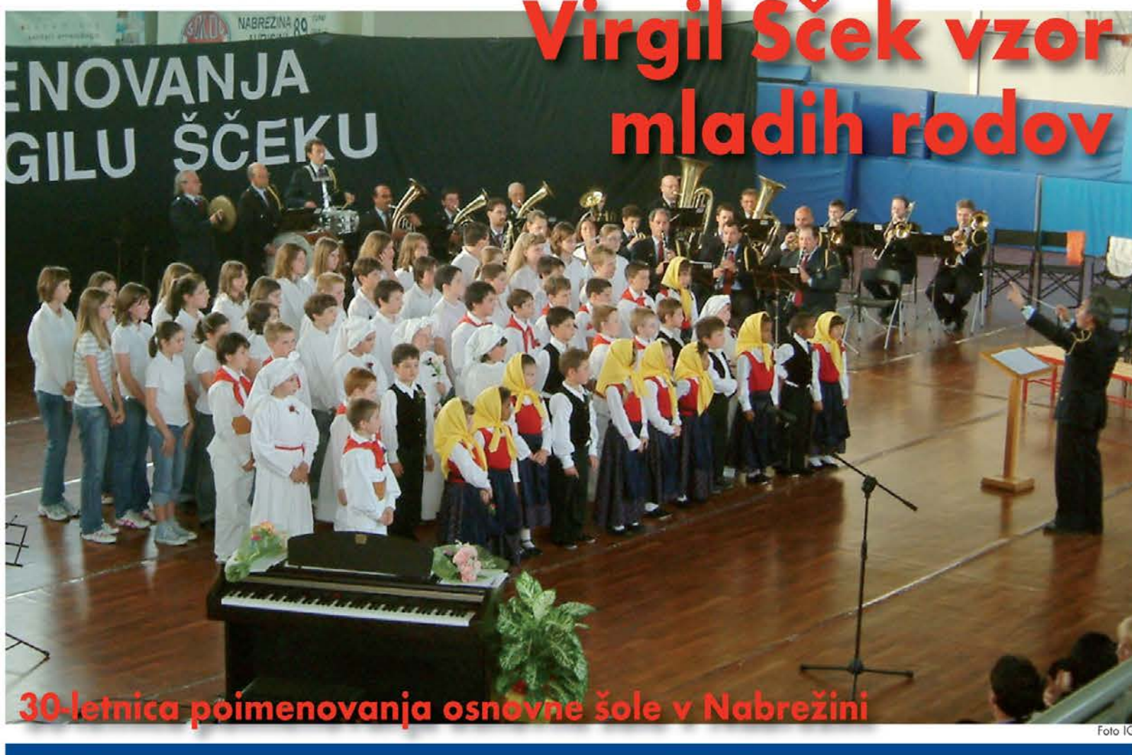
30-letnica poimenovanja osnovne šole v Nabrežini