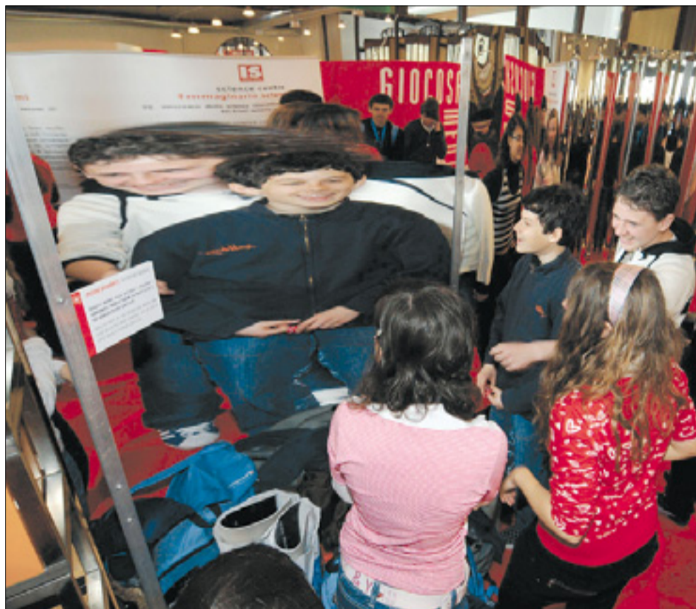
Otroci so bili med protagonistih prvega Festovega dne

Na Festu številni dogodki, knjižne predstavitve, debate - Posebna pozornost otrokom