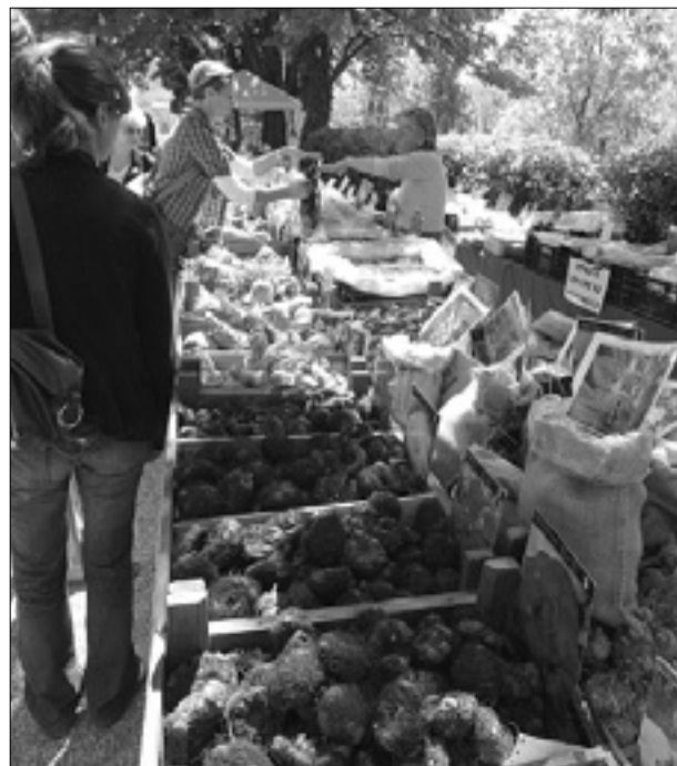
Lanski prodajni sejem je zabeležil velik uspeh