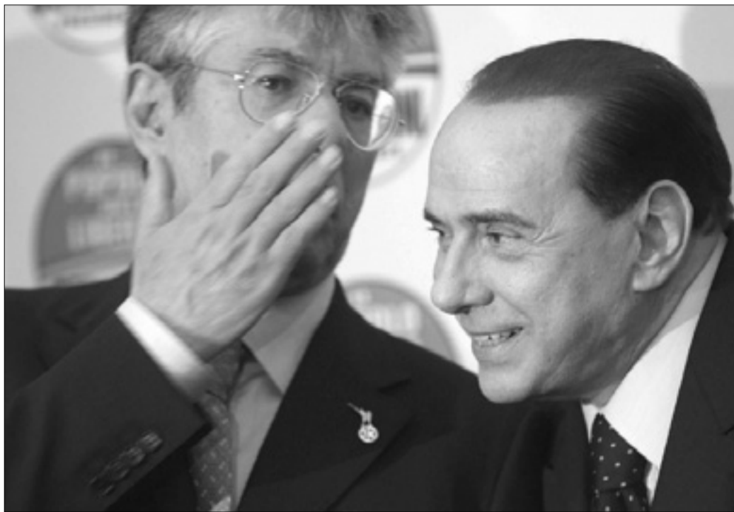
Umberto Bossi Berlusconiju: »Hočem štiri ministre!«

Berlusconi je nadalje napovedal ustanovitev »komisije, ki naj bi preverila, kakšne javne račune je novi vladi pustila poprejšnja levosredinska vlada«. Obregnil se je nato tudi ob občinske volitve v Rimu in ob balotožo med kandidatom Demokratske stranke Francescom Rutellijem in kandidatom Ljudstva Svobode, nekdanjim ministrom Nacionalnega zavezništva Gianijem Alemannom. Berlusconi je izrazil prepričanje, da bodo tudi volivci Desnice in UDC podprli Alemanna.