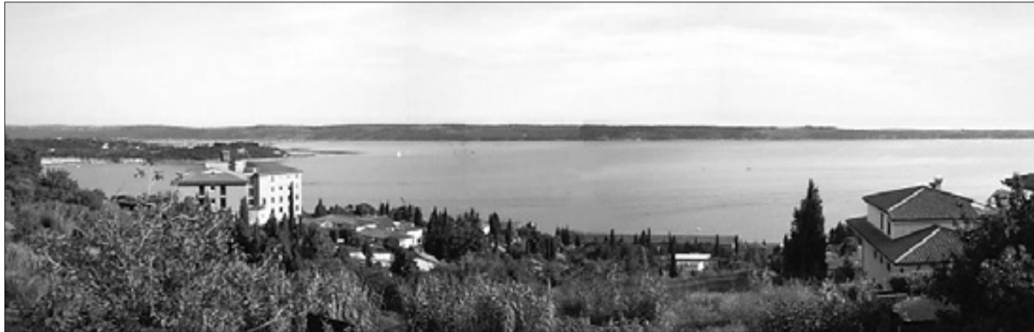
Piranski zaliv spada med najbolj sporne točke v mejnih vprašanjih med Slovenijo in Hrvaško

Srečanje predsednika vlade s predsedniki in poslanci koalicijskih strank