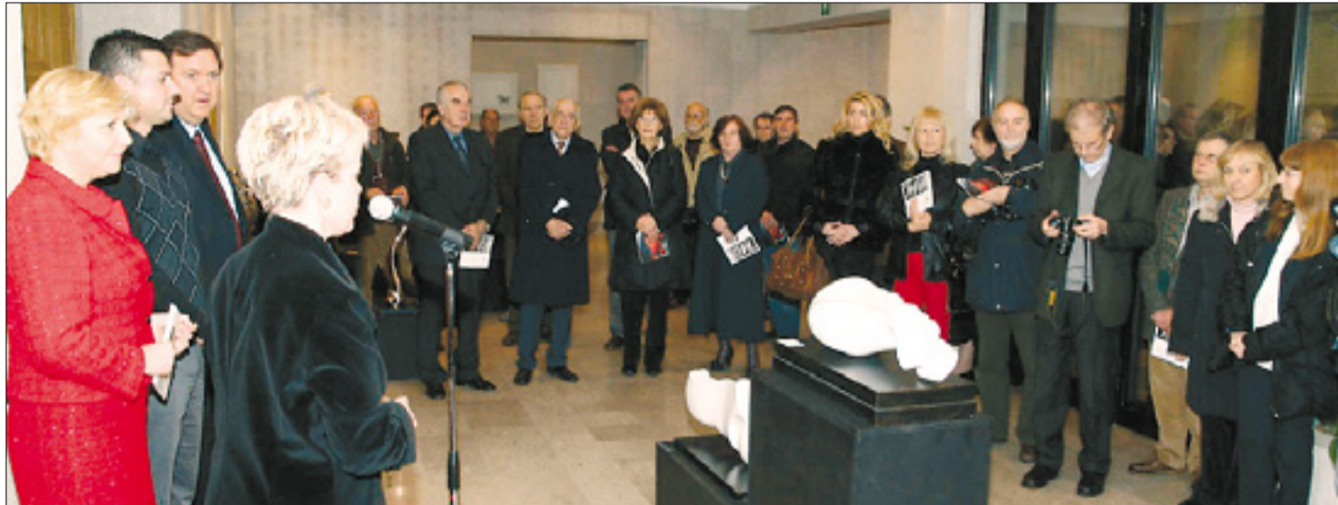
Nemčeva kipa sredi udeležencev včerajšnjega odprtja razstave

Pretrsljivo doživetje ob pogledu na skulpture iz ciklusa Brez izhoda in Rušenje