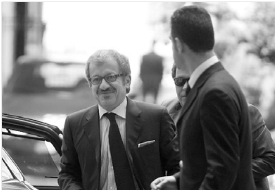
Roberto Maroni: rešitev Alitalie, da bi Malpensa oživila

Berlusconi omenil tudi Air France-KLM in navezo italijanskih podjetnikov - Rešitev v roku tridesetih dni