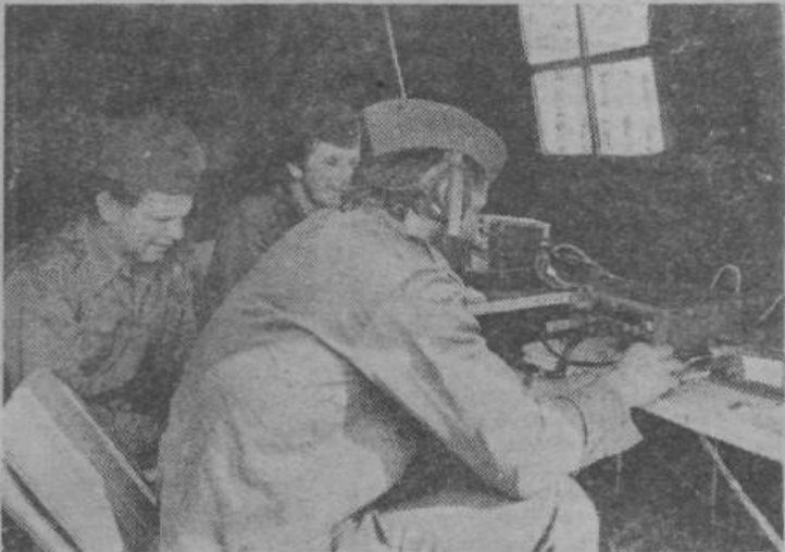
Dobre zveze so omogočale učinkovito usklajevanje akcije v Ljubljani. Na sliki je del enote za vojno-upravne zveze naše občinske skupščine

Krajne skupnosti so izvajale načrtovane naloge po svojih operativnih načrtih v skladu z občinskim izvedbenim načrtom ter ukrepe civilne zaščite v povezavi z ozidi in hišnimi sveti. Enote in štabi CZ v KS so opravljali naloge po svojih načrtih in v skladu z ukazi občinskega štaba CZ. Omogočili so organiziran nastop in delovanje enot CZ, ki so prišle na pomoč pri reševanju ljudi in materialnih dobrin ter zagotovili potrebno število markirantov. Organizirale so občane za evakuacijo v hipna naselja