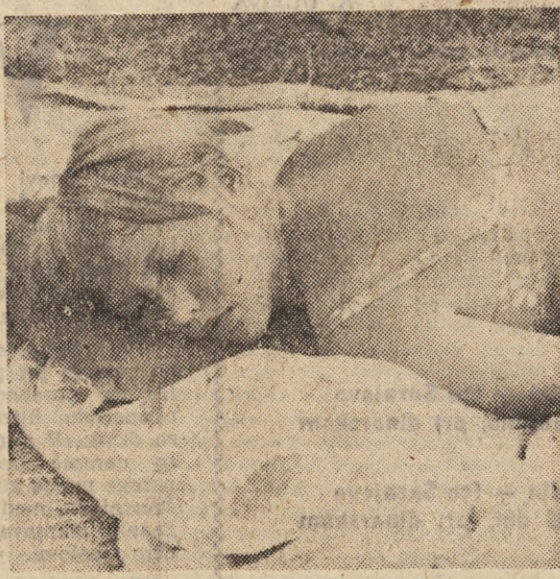
Prijetno je zaspiti na soncu, le kaj bo ponoči.