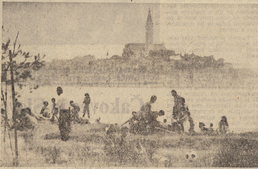
Na travi med bifejem in morjem je prav prijetno. Če ti je vroče, imaš dve možnosti.