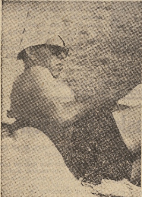
Vroče je. Še dobro da imajo v bifeju vedno hladno pivo

se skuha. Zaenkrat prelevajo šele načela; kje so še členi! — Kaj pa piše v gradivu? — Da je treba okrepiti vesplošna družbena prizadevanja pri poglobljanju individualne, kolektivne in družbene odgovornosti ali nekaj podobnega,