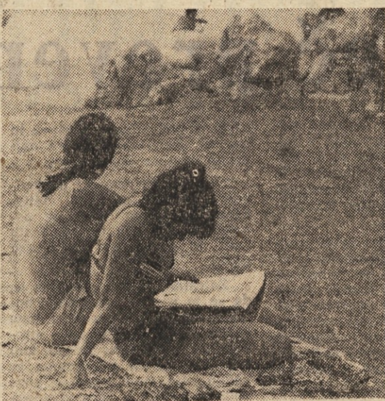
Bolj prijetno je zvečer, toda tudi dan je treba preživeti.