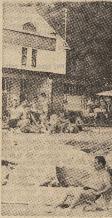
Železniško letovišče v Rovinju je najstarejše in največje.

danji dolgoletni šef železniške postaje v Zidanem mostu. »Vso sezono imamo polno; glavna dva meseca so aktivni železničarji, septembra naši upokojeenci, v predsezoni pa radi zahajajo k nam dijaki, ki so na šolskih izletih. Pri nas se počeni letuje. Železničarji plačajo 22 din na dan. Od tega dobijo 15 din na dan od svojega podjetja, tako da plačajo zase in za svoje družinske člane le po 7 din dnevno. Nekateri, tisti s številnejšimi družinami, letujejo celo brezplačno. Redki so od 16.000, kolikor nas je železničarjev v Sloveniji, ki še niso bili v Rovinju,« je ponovno povedal tov. Adam.