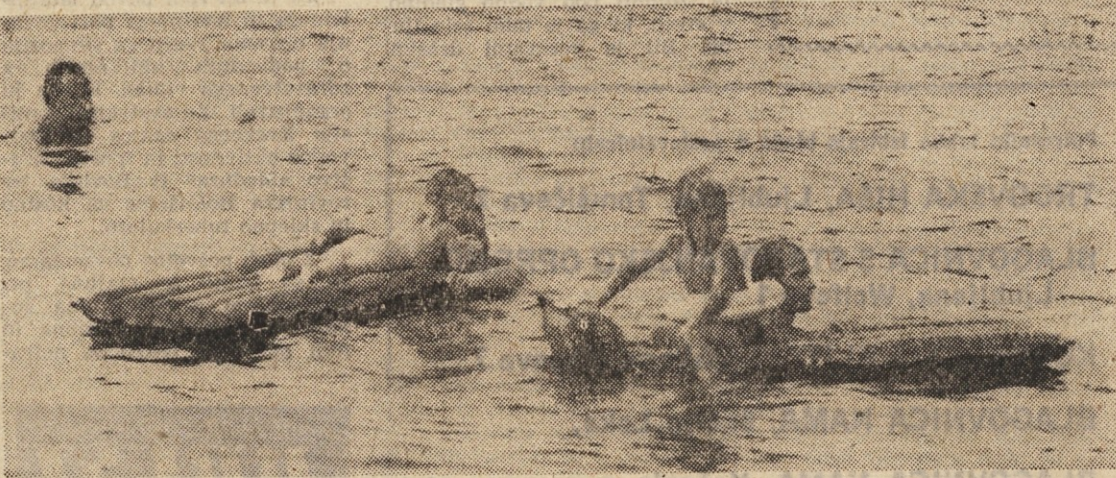
Tudi najmlajši se radi ohladijo v vodi, čeprav ne morejo v »globoko« brez spremstva.

Od letošnjega poletja dalje je otok Korčula s svojimi številnimi kristalno čistimi zalivi in edinstvenim podnebnjem še bolj pristopen motoriziranim turistom.