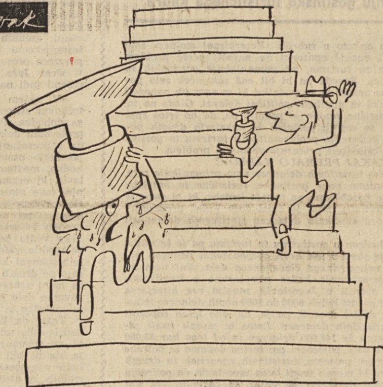
VSAK JE SVOJE SREČE KOVAC