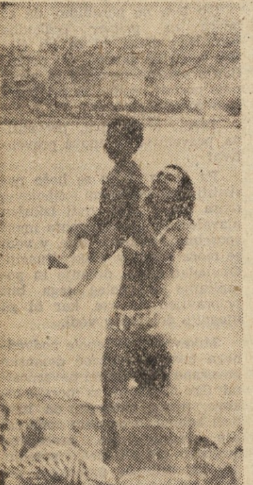
»Ho-ruk«. Kako je prijetno.