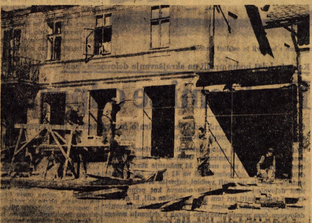
Trgovsko podjetje Zarja na Jesenicah mora izprazniti prostore svoje poslovalnice »Kašta«, ker jih potrebuje Železarna. Odločilo se je za adaptacijo Brunerjeve hiše v neposredni bližini »Kašte«, kjer bo sodoben trgovski lokal odprt še pred zimo