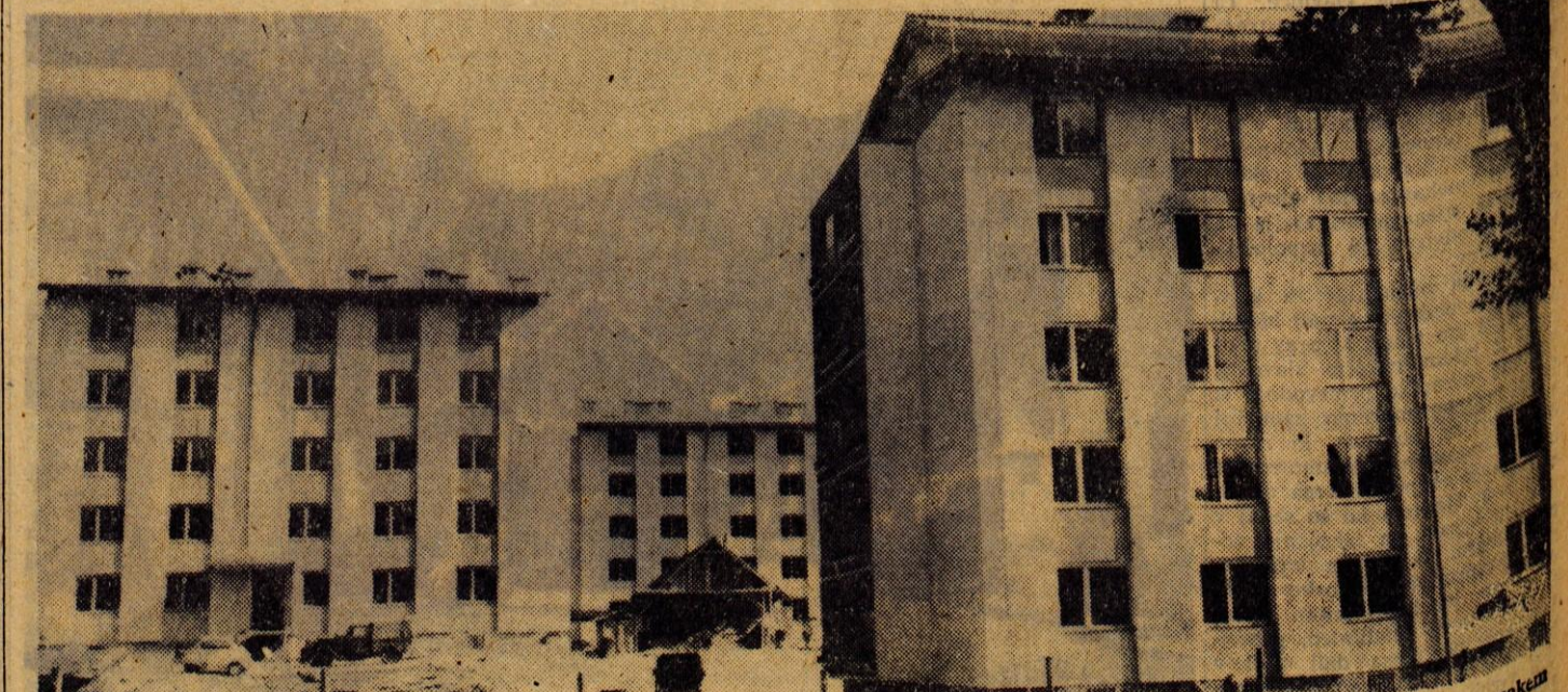
Na Trati v Skofji Loki dograjujejo 3 stanovanjske bloke. Prvi je že vseljen, ostala dva bosta predvidoma do konca leta. V vsakem je po 20 stanovanj

RADOVLJICA — Občinski komite mladine pripravlja širši posvet o turizmu. Sodelovali bodo tudi mladinci in komiteji drugih občin. V ta namen bodo pripravili analizo o stanju mladinskega turizma na Gorenjskem, konferenca naj bi nakazala naloge za čim intenzivnejše vključevanje mladih v turizem. V Radovljici se za to srečanje temeljito pripravljajo. Doslej so imeli več posvetov s specializiranimi organizacijami, kot so taborniška zveza, turistična društva, DPM in planinska društva. Z boljšim medsebojnim sodelovanjem bi postala prizadevanja za vključevanje mladine uspešnejša. Posvetovanje je napovedano za prve dni novembra.