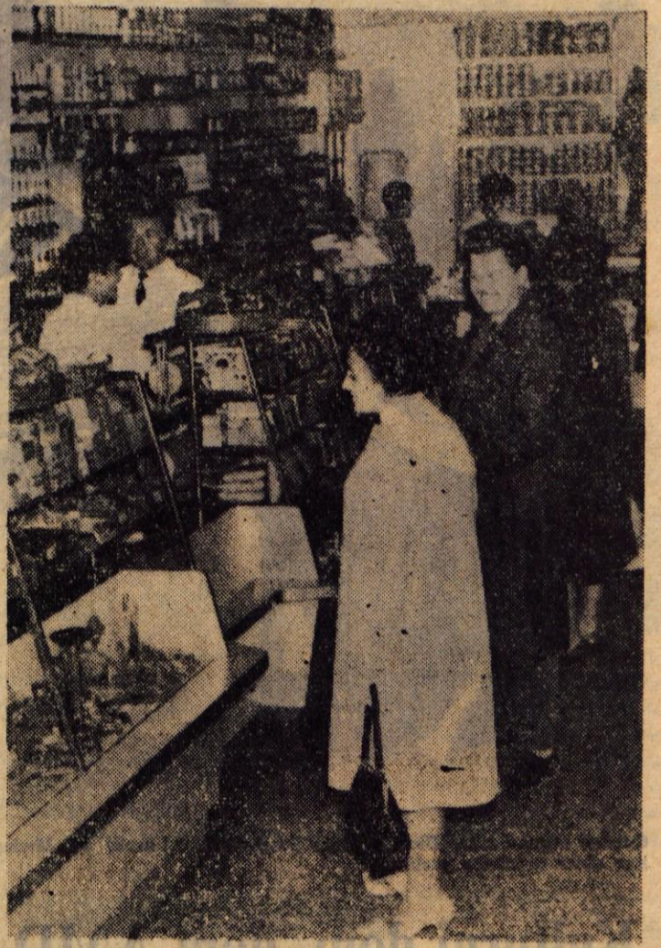
V Delikatesi se zavedajo, da je njihov dohodek v veliki meri odvisen od založenosti trgovine in odnosa do kupcev

Društvo bo poskrbelo za proslave državnih in kulturnih praznikov, od 29. novembra do spomladi oz. vse do krajevnega praznika. Dramska sekcija že pripravlja program. Pred kratkim so ustanovili tudi mladinski moški pevski zbor, ki ga vodi Stane Naglič. Nastopal bo na vseh prireditvah. Obnovili pa so tudi delo recitacijske skupine. Na zadnjem sestanku so se pogovorili tudi o delu knjižnice, ki ima prek tisoč knjig. Vendar pa v zadnjem času ni delala tako, kakor bi želeli, zato so sklenili delo poživiti in omogočiti prebivalcem, da si bodo zopet lahko izposojali knjige. — R.