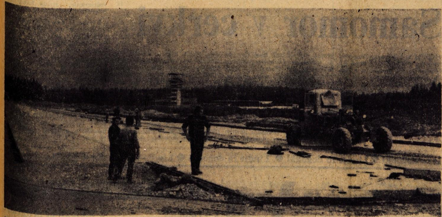
Na letališču Ljubljana-Brniki gradijo stezo, ki bo povezovala leta lično stezo s hangarji in ostalimi poslojji

GLASILO SOCIALISTIČNE ZVEZE DELOVNEGA LJUDSTVA ZA GORENJSKO