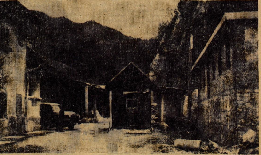
Mesarsko podjetje Tržič dograjuje nove prostore. V stavbi (na sliki desno) bodo garderobe in nekateri drugi pomožni prostori, v ozadju pa vidimo nove hleve

V Podljubelju pa imajo še eno novost! Letos so se namreč odločili, da bodo zgradili dom, ki bo služil za družbeno življenje prebivcev. S samimi gradbenimi deli bodo pričeli prihodnjo spomlad. Čez zimo pa bodo zbrali potreben material in se posvoročili o pri-spevkih in delovnih obveznostih vaščanov. V domu, ki bo 22 metrov dolg in 8 metrov širok, bodo imeli tudi dvorano, ki jo v Podljubelju zelo pogrešajo. — P.