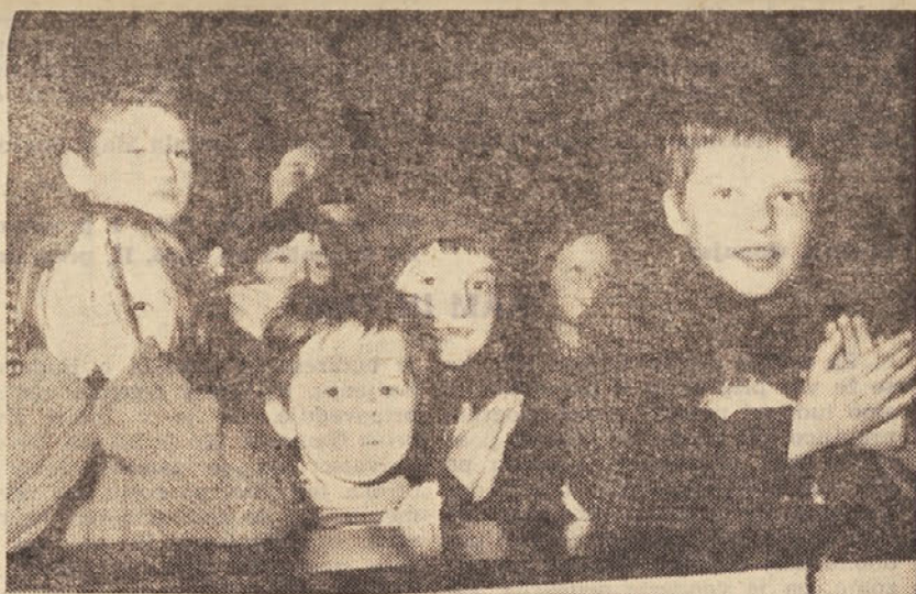
Otroci so zvesti spremljevalci Veselega tobogana in ne štedijo dlani, kadar je treba za uspel nastop nagraditi mladega vrstnika na odru. Letos snema Veseli tobogan tudi televizija

Naj opozorimo le na dve zanimivi sestavini črtic in zgodb ali modernih pravljic Ele Peroci, ki jih bo oddaja za naše šolarje še posebej naglasila: prva naj bi bila razpredanje snovi prek otrokove zavesti od sobe prek dvorišča in mesta v širni svet za valovi, morskimi in televizijskimi, druga pozornost pa naj bi veljala oblikovnim vrednotam. Resnični, vsakdanji otrokovi zapletljaji dobivajo rešitve v domišljjskih kombinacijah z nevsiljivim poudarkom etičnih vrednot, kakor na primer v zgodbici Moj dežnik je lahko balon, ko pokarani otrok obdaruje mrke obraze svojih najbližjih s čudežnimi klobuki. S takšnimi sestavinami je mladinska književnost Ele Perocijeve literatura zase in hkrati del prizadevanj v sodobnem literarnem snovanju, da bi izpovedala doživljajski in predstavnostni svet sodobnega človeka, njegove stiske in radosti.