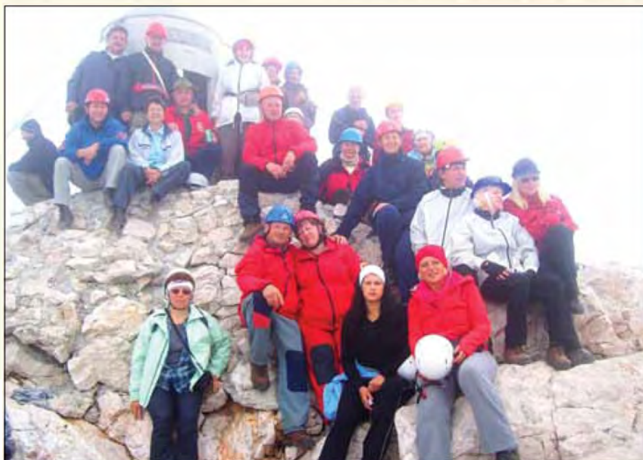
Na vrhu slovenskega očaka je zmeraj čutiti zadovoljstvo.

udariti, da se radi družimo, radi smo skupaj, najbolj važni pa so seveda spomini in občutki, ki ostanejo. Skozi vsa leta smo osvojili več vrhov, letos pa se je uresničila želja marsikateremu izmed naših planincev – osvojiti Triglav. Avgusta letos se je na to pot podalo šestindvajset pogumnih planink in planincev, od tega kar štirinajst prvopristopnikov. Pot smo začeli s Pokljuke, nadaljevali mimo Vodnikovega doma na Velem polju ter tako neomajno prisopihali do Planike pod vrhom Triglava, kjer nas je pričakal prijatelj Dorči iz Mojstrane. Rahlo utrujeni, a neizmerno veseli, da smo že pod Triglavom, smo si uredili prenočišče in opravili večerjo. Sledil je veseli večer, kar je že utečena navada naših popotovanj. Po napornem dnevu je pomembno sprostiti duha in telo s pesmijo, vici in pogovorom. Pri tem so se nam radi pridružili tudi veseli Belgijci, ki so se tiste dni ravno tako mudili med prečudovitimi slovenskimi vrhovi. Okrog desete ure zvečer smo legli k počitku. Kot pravi planinci smo vstali zgodaj zjutraj, nabrali potrebno energijo ter v gosjem redu zakorakali v skale proti našemu cilju. V začetku nas je spremljala megla, proti vrhu pa