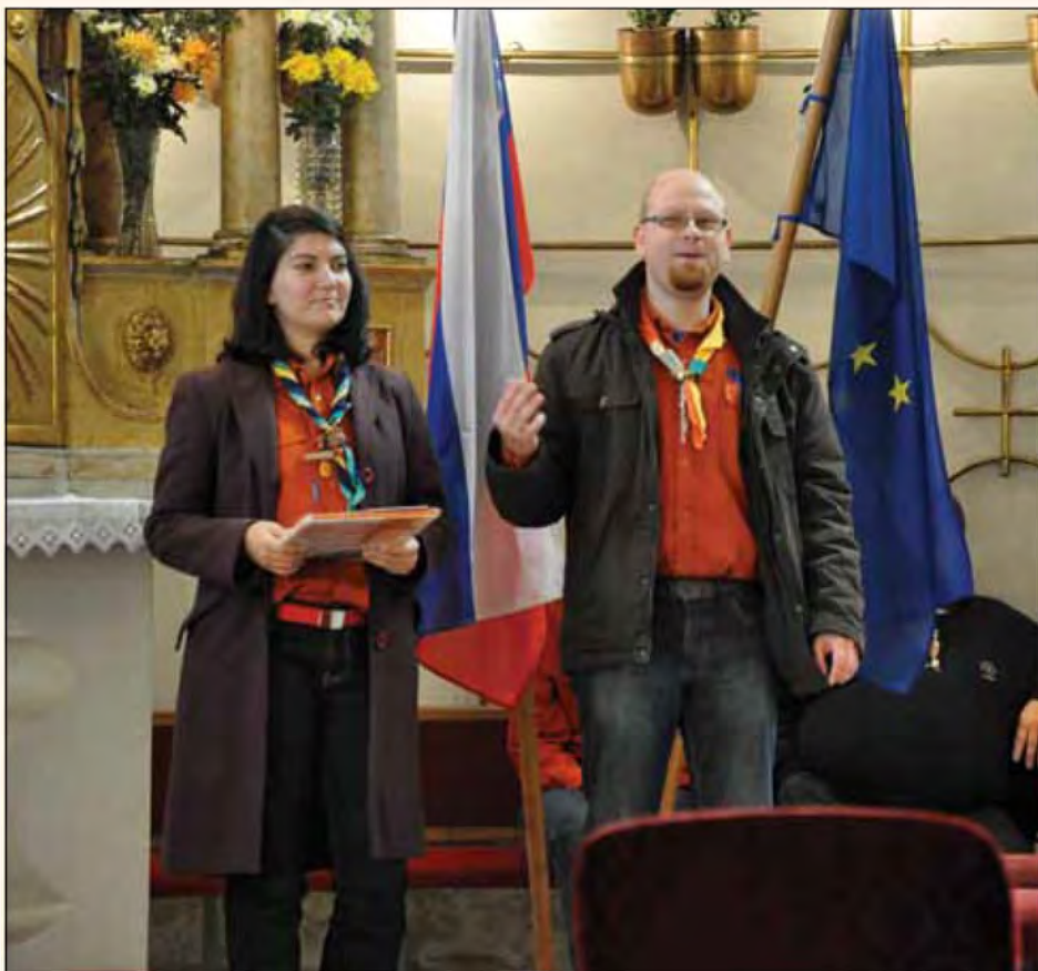
Načelnik in načelnica ZSKSS