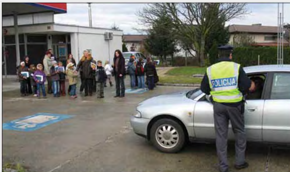
Otroci pred začetkom akcije