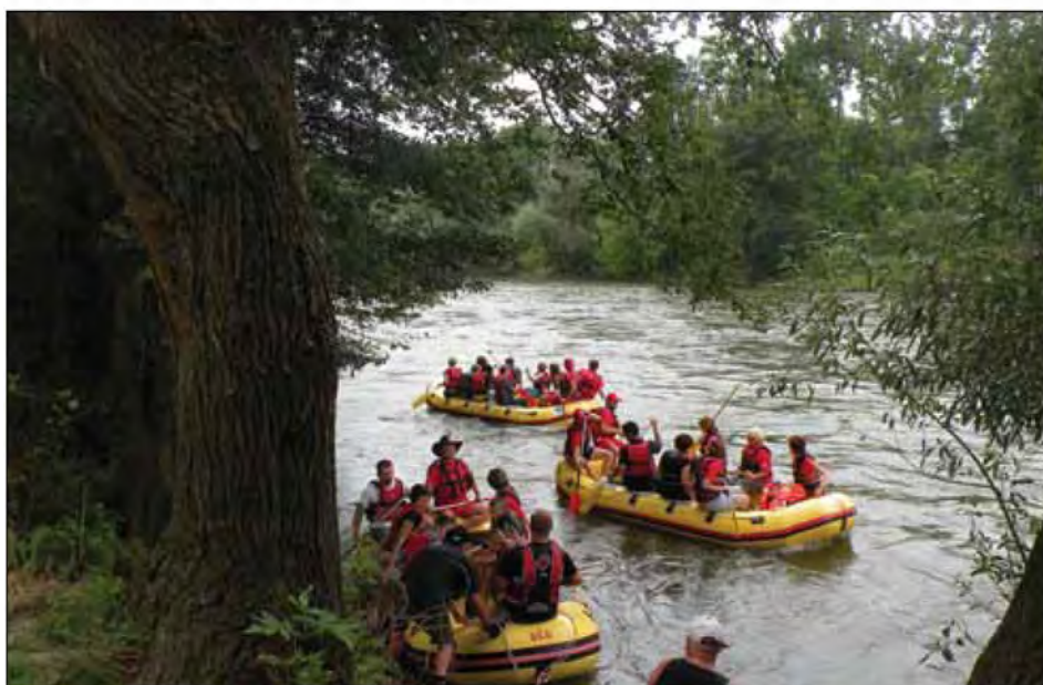
Čolnarji v »akciji«.

stovoljnega dela ob različnih priložnostih ter za kvalitetno delovanje nabavili še nekaj opreme. Že od samega začetka dobro sodelujemo tudi z gasilskim društvom, zato so bili ob njihovi pomoči tudi nekateri letošnji dogodki izpeljani na zavidljivem nivoju. Sezona spustov se za naše društvo ponavadi začne rano spomladi, ko se začne prebujati narava, ki nam kakor starter nakaže, kdaj je pravi trenutek za naš start. Prav pestro je, ko se ob privezu začnejo kazati prve trave in vabijo, da se jih počese in pripravi teren. Nato sledi obdobje, ko se vedno in vedno znova vračamo nazaj, da pokosimo trato ob Muri, posedimo na klopcah ob vodi, pajamo kruh, z ribiči lovimo ribe in že kujemo načrte za naprej. Letošnje leto nam narava ni prizanesla, saj smo morali večkrat sanirati posledice neurij in poplav, ki so štirikrat resneje obiskale tudi naš prostor ob Muri in nam povzročila nemalo