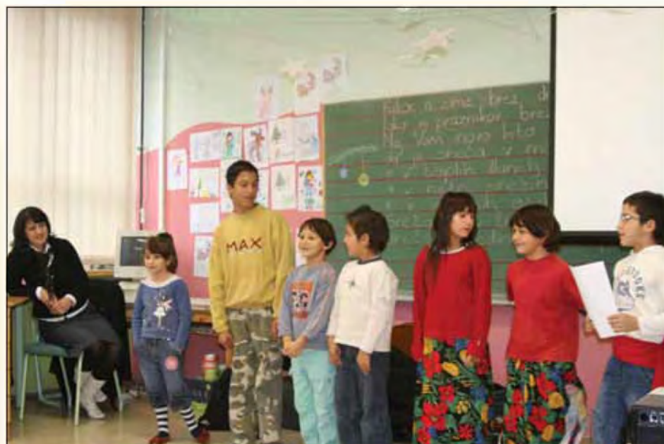
Nastopili smo z velikim veseljem.

Za učence in starše iz romskih družin naše šole smo v okviru projekta »Uspešno vključevanje Romov v vzgojo in izobraževanje«, ki bo trajal od 2008-2011, člani projektnega tima pripravili prednovoletno delavnico. Bilo je 3. decembra 2009. Delavnici so prisostvovali predstavniki Ljudske univerze M. Sobota, predstavniki Zveze Romov M. Sobota ter romski pomočniki, ki so vključeni v pomurske osnovne šole. Učenci so recitali, peli, plesali, zaigrala nam je tudi skupina Mala Langa. Po nastopu smo v delavnicah izdelovali novoletna darila. Vzdušje je bilo prijetno. Največje zadovoljstvo pa smo ob-