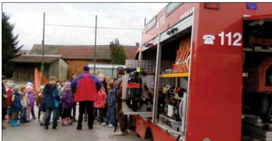
Obiskali so nas gasilci.

Šolske klopi so se na podružnični šoli v Dokležovju že dobro ogrele in poleg pouka se je zvrstilo še nekaj drugih šolskih ter občolskih dejavnosti. Takoj v začetku meseca septembra smo na obisk povabili policiste iz PU Murska Sobota. Predstavili so nam njihovo vsakdanje delo in opremo, ki jo uporabljajo. Tako smo dodobra spoznali in tudi preizkusili njihovo vozilo, ki ga v pogovornem jeziku radi imenujemo »marica«. Preverili so naše znanje o prometu in nas poučili o tistem, česar nismo poznali ali vedeli. Prikazali