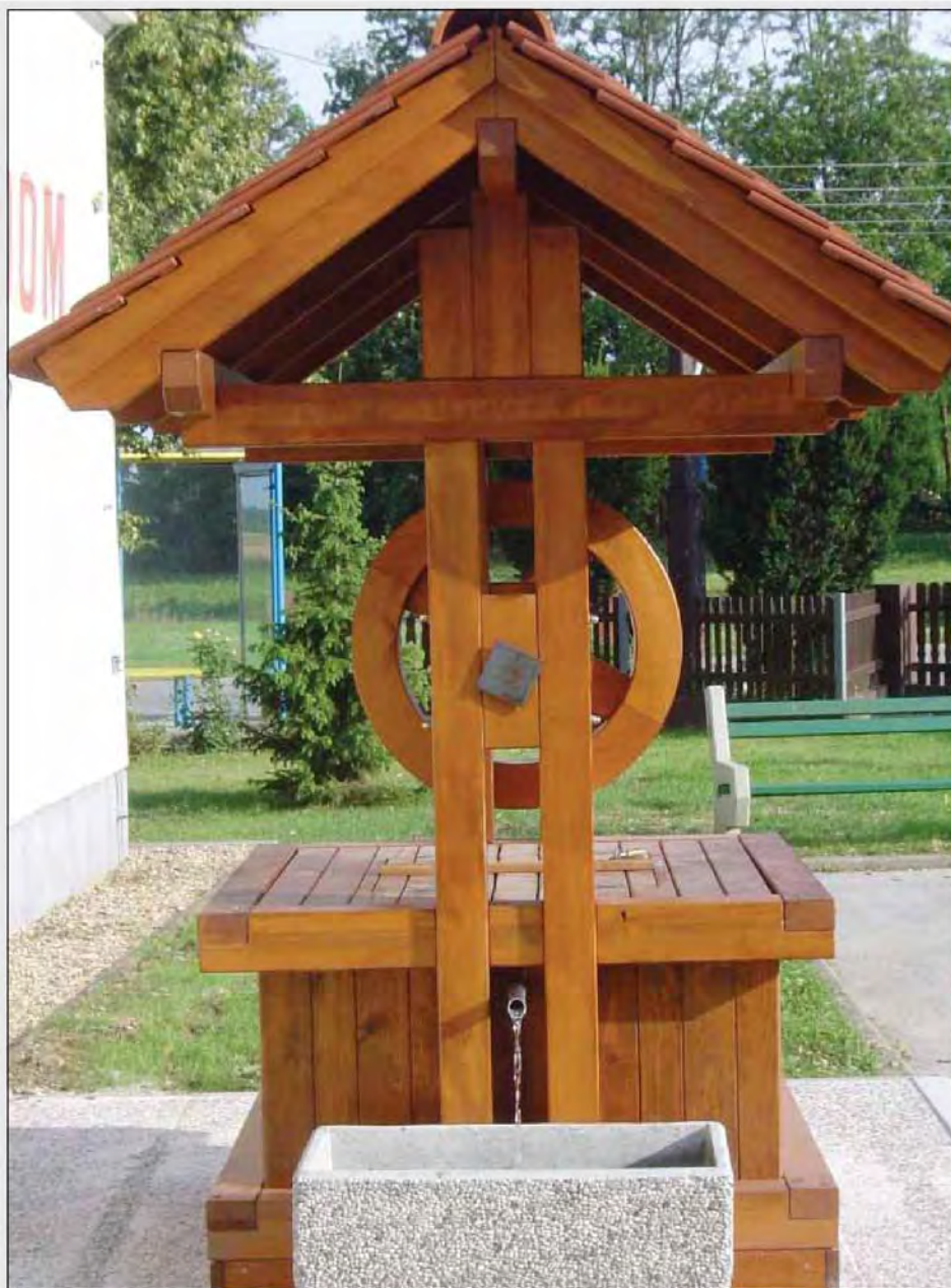
»Prijeti v Lipovce - pri nas je lipou.«

se 286 upravičencem sofinancira izgradnja v višini 875,36 EUR iz sredstev »Vučje jame«.