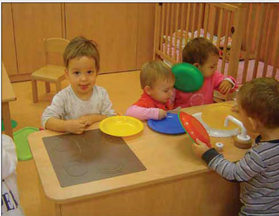
Z igro učimo gospodinjstevskih opravil