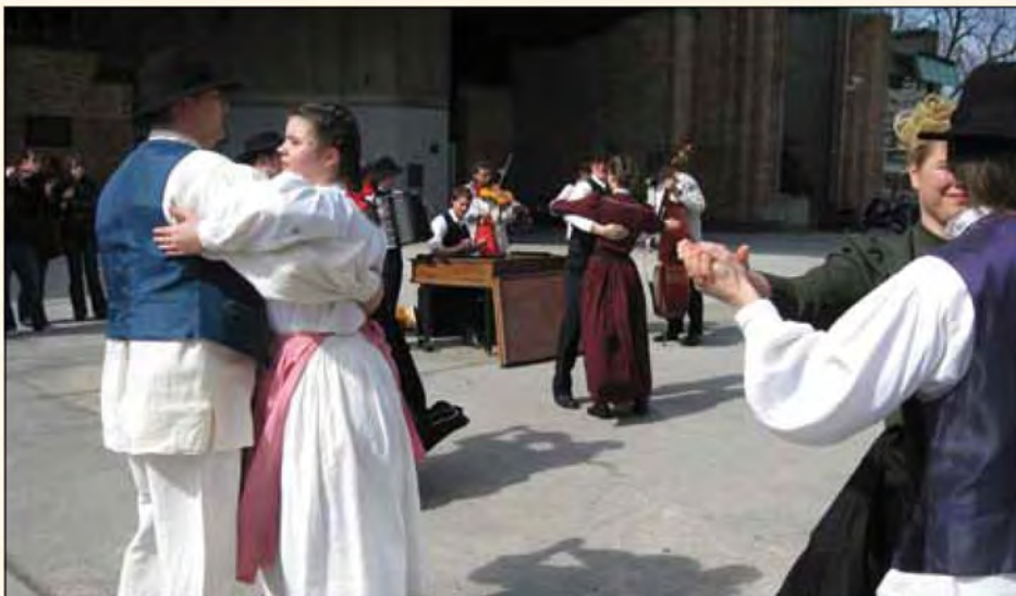
Folklorniki KUD-a Beltinci pred Cankarjevim domom.