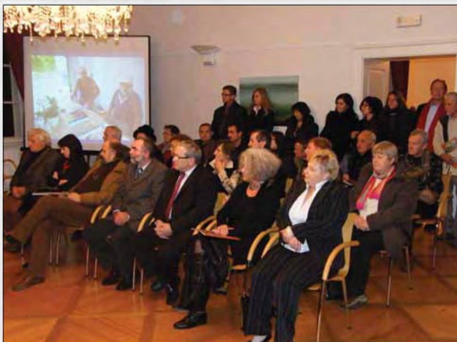
Sodelujoči umetniki in obiskovalci otvoritve razstave umetniških del 17. mednarodne Likovne kolonije Izak Lipovci.