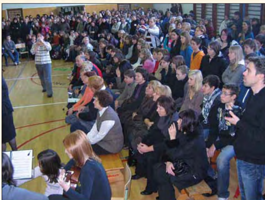
Mentorji in učenci na tekmovanju