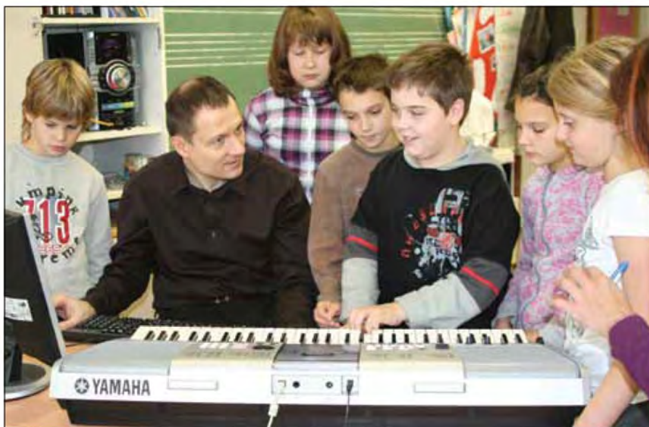
Mladi glasbeniki s svojim profesorjem