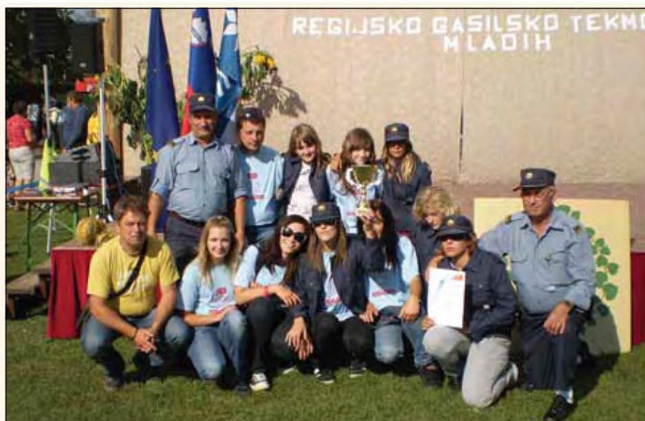
Dokležovske gasilke s priznanjem.