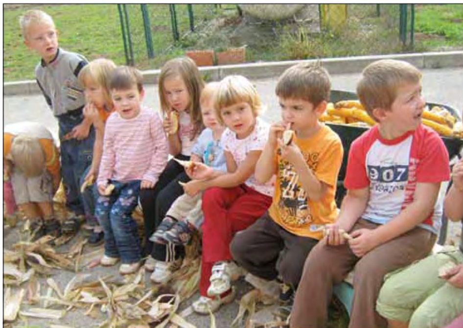
»Odomaš z domačimi vrtankami iz kmečke peči.«

loških problemov. Večina teh je posledica zavednega ali nezavednega škodljivega ravnanja človeka. Prav zaradi tega je zgodnje osveščanje otrok o ekoloških problemih zelo pomembno. Drevo, ki ima globoke korenine, bo zrastle visoko. Vzgojiteljice v enoti »Mlinček« se tega zavedamo, zato želimo otrokom privzgojiti čut in odgovornost do narave, same pa se nenehno izobražujemo. V dejavnostih se osredotočamo na nove vsebine in metode dela aktivnega učenja, ki se problemov loteva kritično, ustvarjalno, učinkovito. Že drugo šolsko leto izvajamo eko projekt, tokrat pod naslovom »Nazaj k naravi«. Naše poslanstvo je, da otroci pridobijo izkušnje in spoznanja o zdravem okolju, sami pa z dobrimi zgledi razširjamo znanje in gradimo celostnega človeka za prihodnost. Okolje našega vrtca nam ponuja možnost dejavnega učenja otrok ob neposredni vključitvi v dogajanje in neposrednem stiku z naravo.