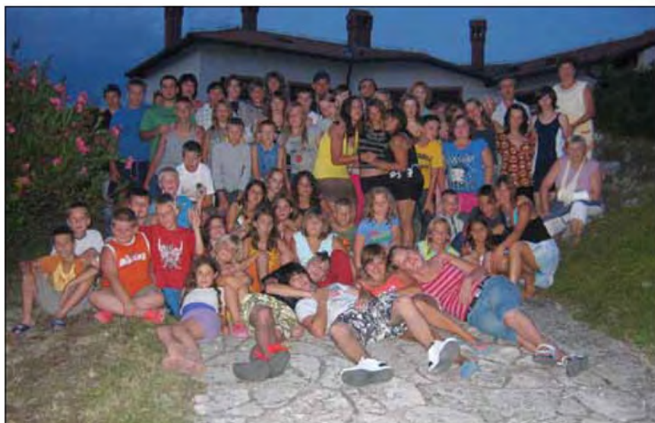
Zadovoljni udeleženci letovanja

12. Tukaj pa si veselo polnimo trebuščke.