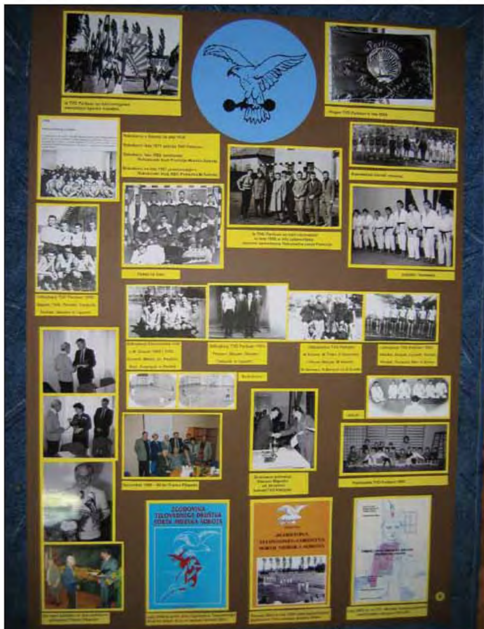
Utrinek iz razstave