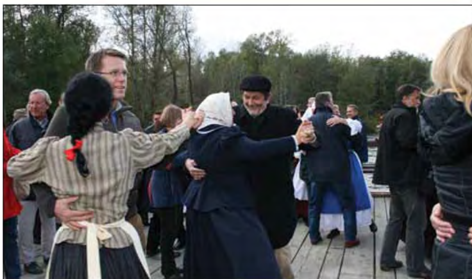
Vožnja z brodom je bila za tuje diplomate posebno doživetje

18.10.2009 Zavod za turizem in kulturo Beltinci je za Ministrstvo za zunanje zadeve organiziral tradicionalni jesenski izlet za tuje diplomate, akreditirane v Sloveniji. Izlet je gostil minister Samuel Žbogar. Tuji diplomati namreč vsako leto obišejo druge kraje oz. drugo slovensko regijo in tokrat so prvič obiskali Prekmurje. V občini Beltinci so udeleženci izleta z ministrom Žbogarjem na čelu obiskali Otok ljubezni v Ižakovcih. Ob prihodu jih je najprej pozdravil prekmurski pozvačin in mlade folkloristke z domačim žganjem. Takoj zatem jih je pozdravil in jim zaželel dobrodošlico še župan Milan Kerman. V programu so si gostje ogledali stalno ponudbo na Otoku ljubezni z razstavo o bújraštvu, plavajočim mlinom, folklorna skupina KUD-a Beltinci pa je na brodu predstavila splet prekmurskih plesov. Po ogledu plesov so se diplomati skupaj s plesalci zapeljali z brodom ter na njem skupaj tudi za-