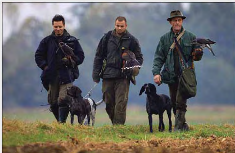
Odprtje lova s sokoli v Beltincih