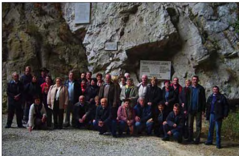
Pred vhodom v Škocjanske jame.

Člani TD Brod Melinci smo se v jutranjih urah odpravili na izlet po Krasu. Pogled v deževno nebo nam ni vzel dobre volje in razpoloženja. Po nekajurni vožnji smo se ustavili na prvi postojanki Lom, kjeri smo se prijetno okrepcali in nadaljevali pot proti Krasu. Obiskali smo Škocjanske jame, ki zavzemajo s