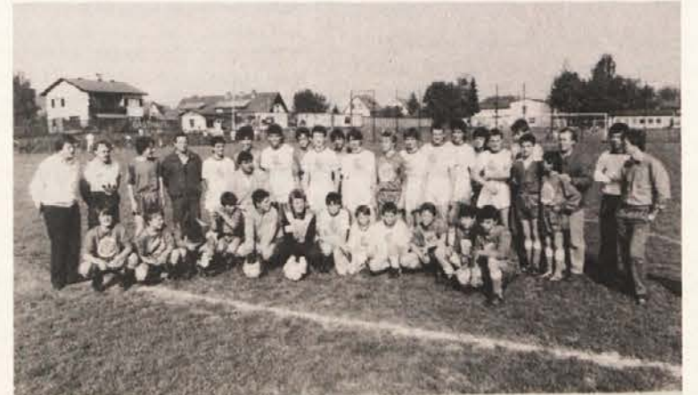
Mladinci SAK, šolarji NK Ljubljana, funkcionarji in trenerja na skupinski sliki pred tekmo.

Mladinci SAK so bili seveda zelo veseli svoje zmage, igralci ljubljanskega kluba pa so se lahko potolažili z dejstvom, da so bili v povprečju eno leto mlajši. Kljub temu je bil glavni pomen v prijateljskem vzdušju, kar je vplivalo tudi na potek igre: komaj kdaj je moral sodnik Martin Hobel (zastopnik tovarne „Obir“, torej organizatorja tekme) dosoditi kak prosti strel, saj nekorektnih posredovanj skoraj ni bilo. Pa tudi to je razveseljivo, da so se zastopniki obeh klubov že kar po igri zmenili tudi za povratno srečanje, ki ga bodo odigrali jeseni v Ljubljani. Še mnogo takih srečanj!