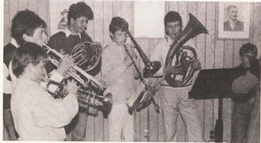
Komorna skupina trobil iz Slovenj Gradca

Pred številno publiko so v sredo 20. 5. 1987 v kletnih prostorih Posojilnice Pliberk nastopali učenci Glasbene šole Slovenj Gradec in Glasbene šole na Koroškem. Nad 40 glasbenikov je sooblikovalo 32 točk glasbenega programa ob klavirju, violini, trobilih, pihalih, harmoniki in citrah. Kar veselo in prijetno je bilo prisluhniti mladim glasbenikom iz Slovenije in Koroške ko so kvalitetno in z vso vnemo zaigrali svoje skladbe.