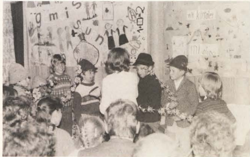
Plajberski otroci v igri razbojnikov.

Upajmo, da bomo v Slovenjem Plajberku kmalu doživeli novo, podobno prireditev, ki presega starostne in jezikovne meje.