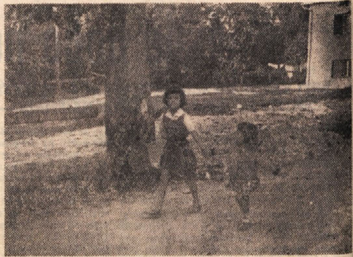
TAKO MAJHNE, PA ZE KAR SAME NA TRG