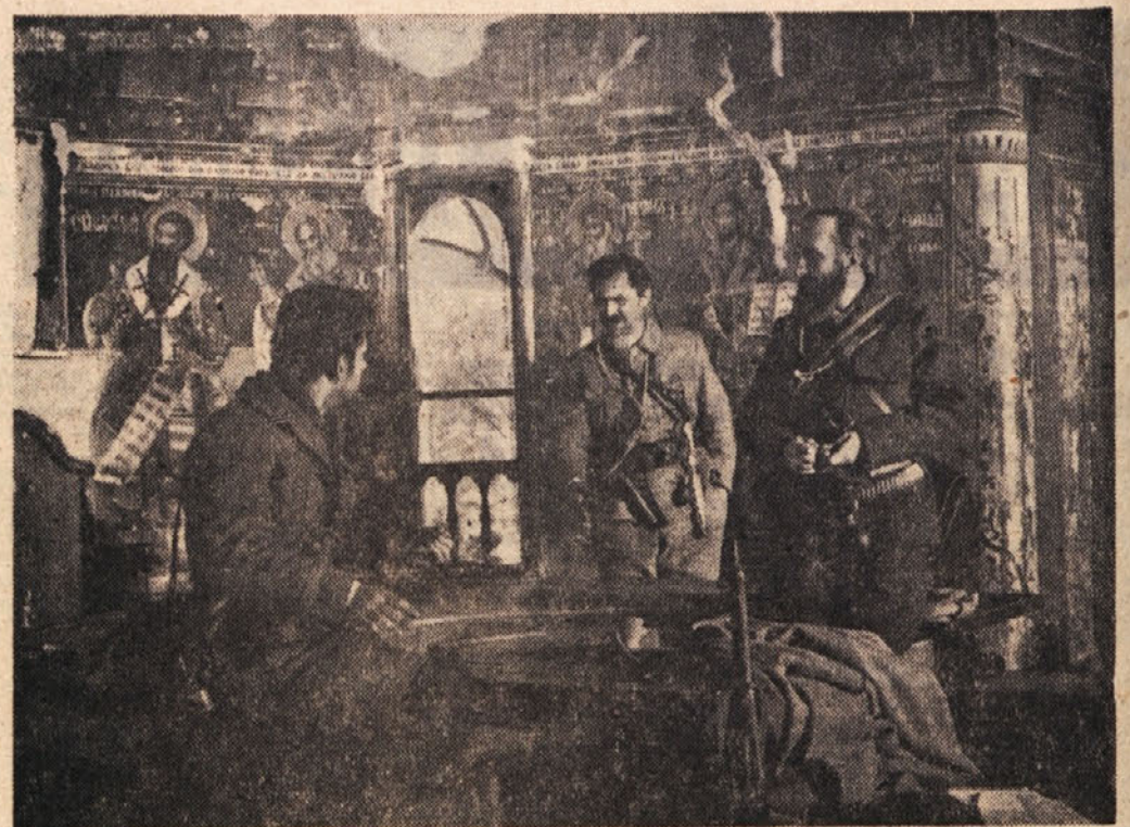
PRIZOR IZ JUGOSLOVANSKEGA KINOSKOPSKEGA FILMA »MISS STONE«