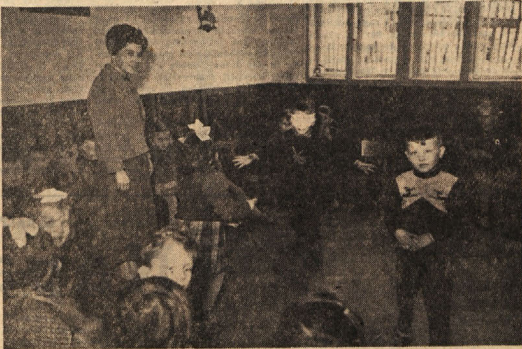
NAŠI OTROCI — SKRE NAS VS EH

Ob zaključku je plenum sprejel ustrezne sklepe. Vsi člani ZK naj se v svojih osnovnih organizacijah seznanijo s sklepi plenuma in vsebino razprave. Venomer pa naj bodo pred komunisti napotila, ki jih je dal vsem VII. kongres ZKJ in IV. kongres ZKS, da z njimi uspešno rešujejo svoje vsakodnevne odgovorne naloge.