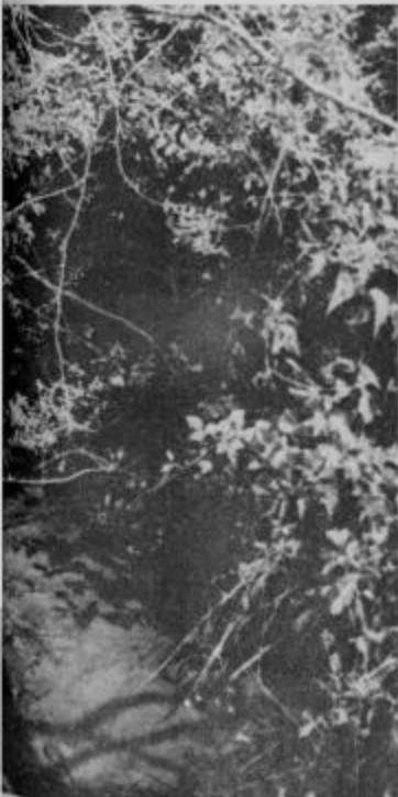
Raj za ptice, ribe in ljudi...