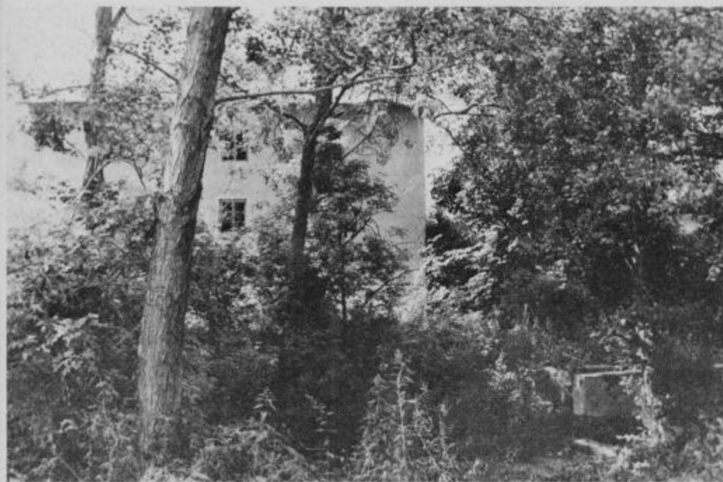
Samo slutimo lahko, kako je bilo tukaj, ko je Pinčarjev mlin klopotal...