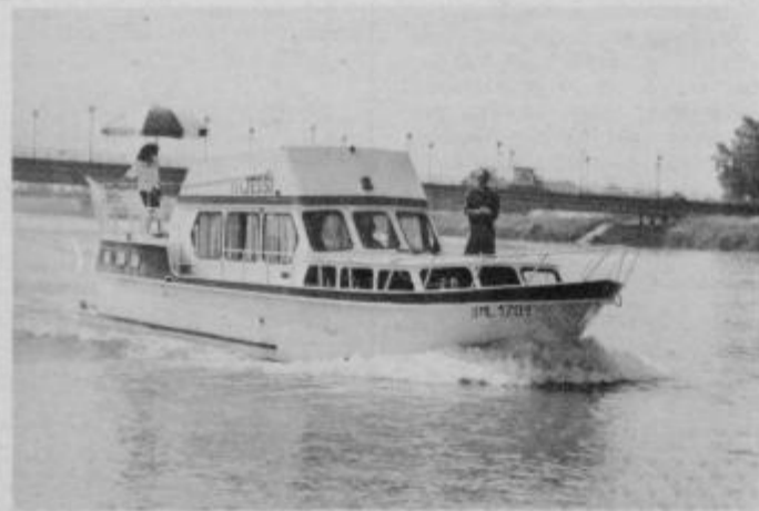
Plovba po ptujskem jezeru je mirna, tuintam jo zmotijo galebi in drugi »prebivalci«, ki jih tod ne zmanjka.