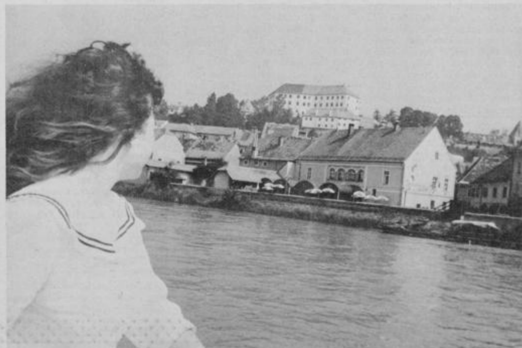
Ptuj je s svojega »morja« še lepši.