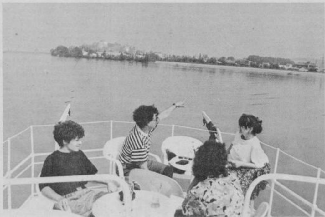
Jessi je odrinila.