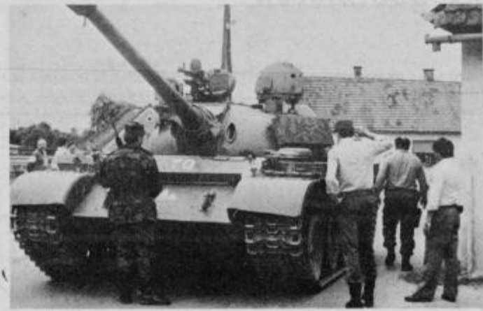
Tank TO na poti na drugo lokacijo.