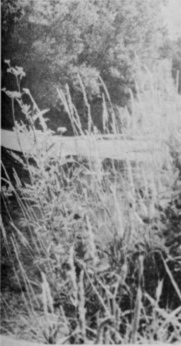
Ulirano Dravinjo ter se skupaj izlijejo