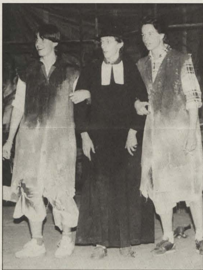
Kostumi, lutke, glasba, scena – vse je nastajalo hkrati z uprizoritvenim konceptom. Sodelujejo v glavnem mladi igralci.