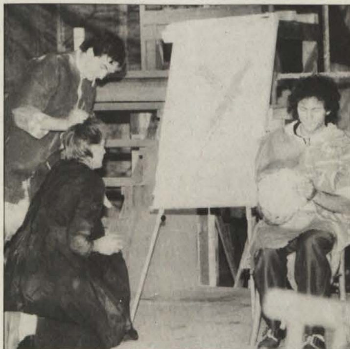
Turobno halo 7 bivše žičarne Kestag je SPZ spremenila v gledališčno dvorano. V njej prizadevni igralci vsak dan vadijo neobičajne prizore za premiero v ponedeljek.