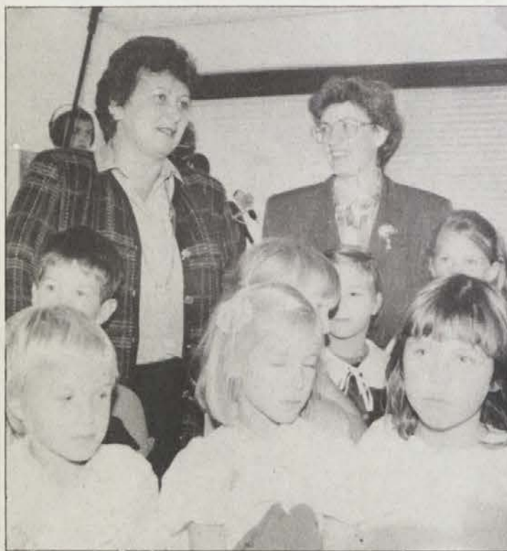
Ministrica in ravnateljica sredi otrok.