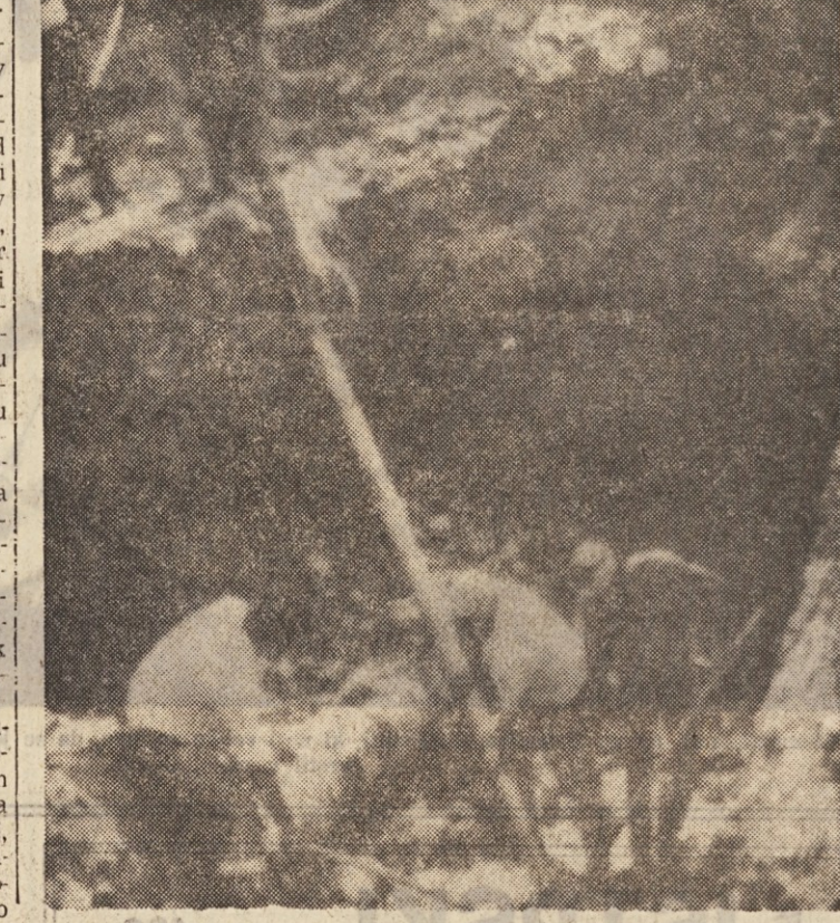
RIM, 12. — Okvaro na cevovodu ENI, skozi katerega potiskajo bencin proti rafineriji pri Pantanu del Granon, ki oskrblja z gorivom letališče Fiumicino, oziroma proti hranilnikom družbe Agip v Avreljevih ulici, ki z bencinom preskrbuje obalne kraje severno od Rima, so tehniki družbe SIO (Società Italiana Oldotisti) s sodelovanjem gasilcev popravili. Poldruhi meter pod zemljo je zaradi napake pri varjenju cevi nastala v njej niti 2 mm široka luknjica, kar pa je bilo dovolj, da se je skopno izlilo zaradi močnega pritiska kakšnih 10.000 litrov bencina.

Gorivo je preplavilo v večeršnjih popoldanskih urah del zapuščene gvanije ob pokrajinski cesti S. Severa - Tofia in zaradi sončnih žarkov je nastal tudi manjši požar. Pravocasen poseg gasilcev je preprečil hujšega, a za vsak primer so zaprli omenjeno cesto ter še atocetni odsek Cervetera - S. Severa. Po neprekinjenem delu skozi vsa noč so danes nadomestili poškodovani del cevovoda. Ustrezna delna vidino na sliki.