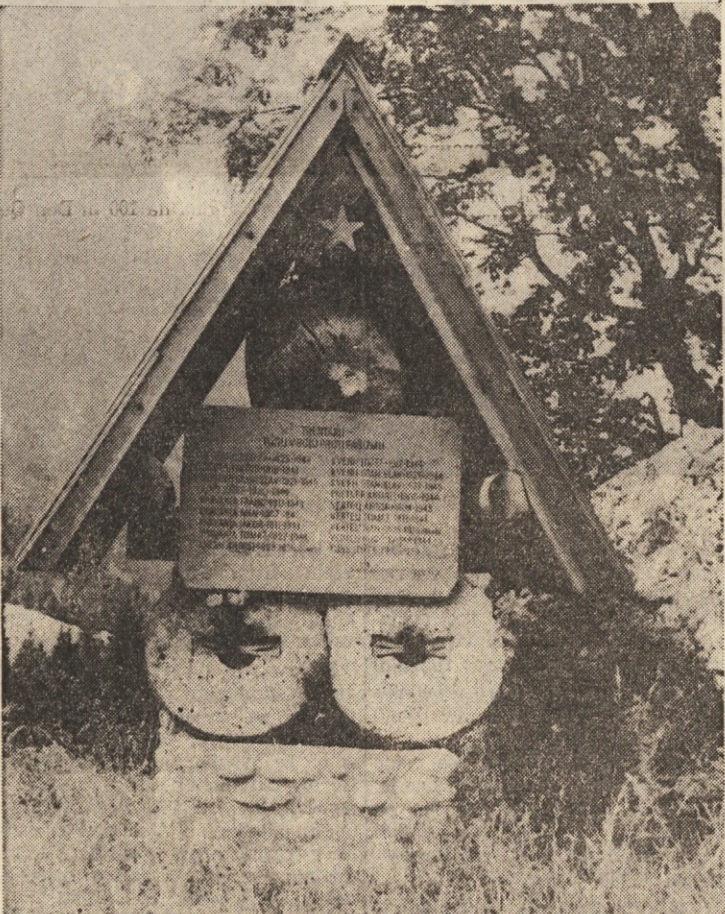
Spomenik padlim partizanom