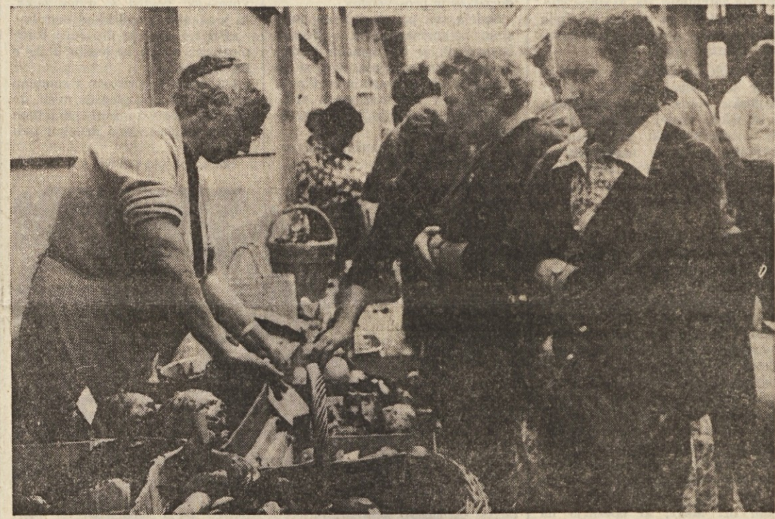
Gobe, dragocena poslastica, na goriški trznici.

Prinašajo jih gobarji s Krasa, iz Vipavske doline in celo s Tolminskega