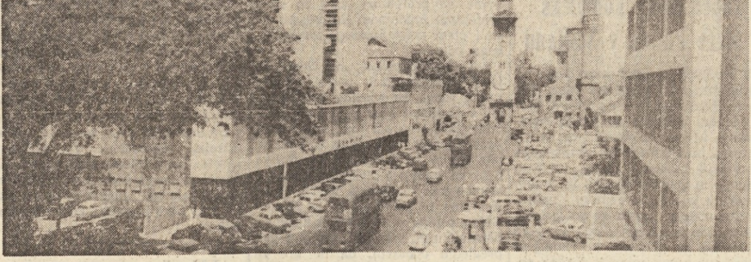
Mesto Colombo se je pripravilo za peto vrhunsko zasedanje nevrščenih držav. Priprave na zasedanje so bile dolge, včeraj pa se je začelo konkretno delo.