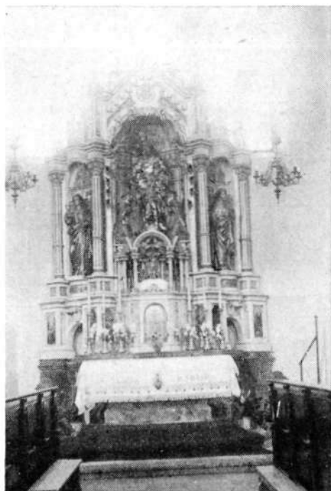
Stranski oltar Matere božje v Stari Loki