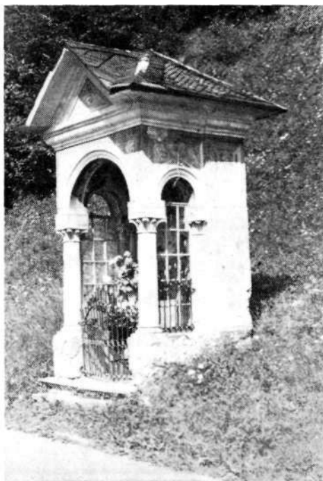
Značilna kapelica z Gosarjevo poslikavo na Češnjici