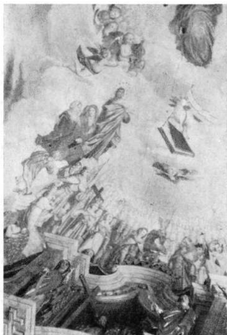
Del poslikanega oboka v prezbitteriju na Zalem logu

Gosar je poslikal več znamenj v Selški dolini in v Loki. Po zunanjem videzu so si te kapelice podobne, delili pa bi jih lahko na večji in manjši tip. Pri manjšem tipu je kompaktna le zadnja stena, stranski steni in vhod pa so odprti in oprti na stebrih. Ti stebri so včasih iz groha (zelenega vulkanskega kamna). Tak tip majhne kapelice je bil splošno razširjen v tistem času. Zanimivo pove kronika od Sv. Lenarta, da je kapelico pred cerkvijo postavil »Boštjenc«