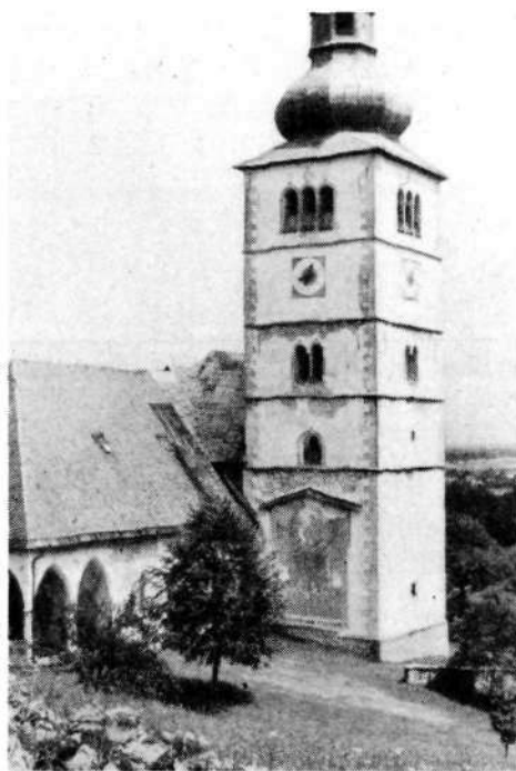
Zvonik v Crngrobu z Gosarjevim Krištofom