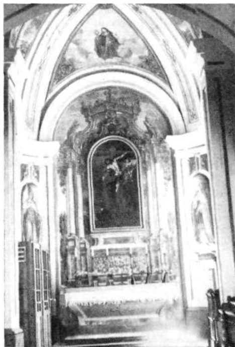
Poslikava kapele sv. Frančiška v kapucinski cerkvi v Skofji Loki, naslikana oltarna arhitektura

V letih 1854—1857 so popolnoma prezidali cerkev sv. Valentina na Jarčjem brdu. Oba stranska oltarja sta le naslikana na zid. Delo izdaja Gosarja. Levi