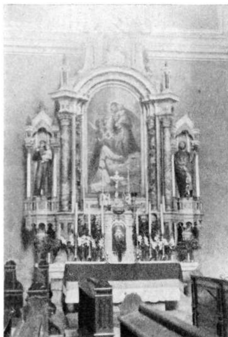
Oltar roženvske Marije v Stari Loki