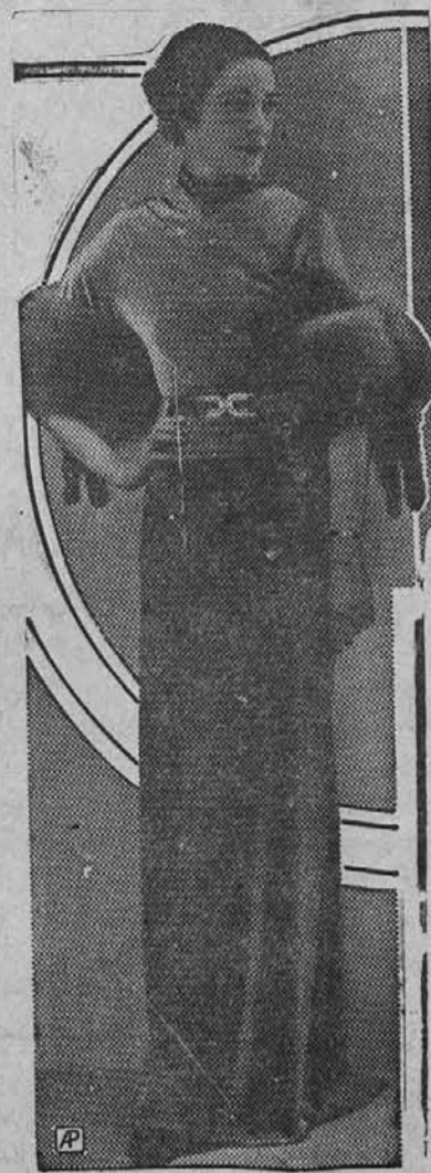
Moda v Ameriki: Elegantna večerna obleka

Črno sukno se dobro ohrani in se slani vodi.