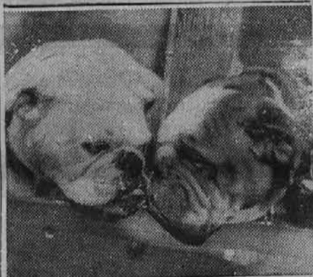
Buldoža, ki sta na letošnji razstavi psov dobila prvo nagrado