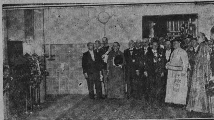
Papež Pij XI. si ogleduje nove naprave za centralno kurjavo v Vatikanu