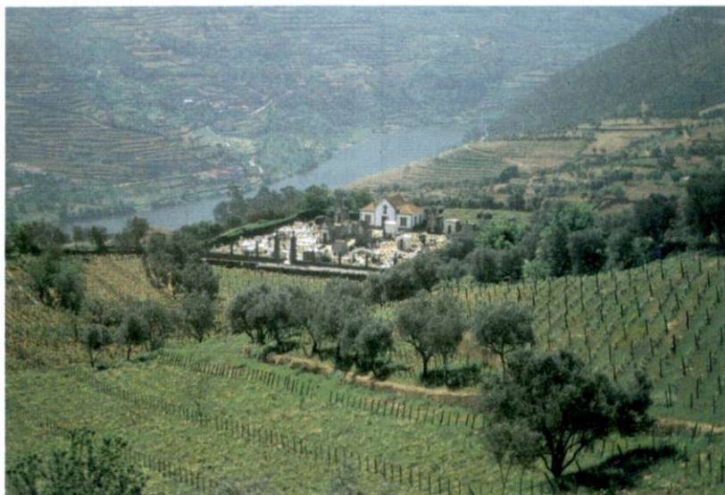
Slika 3: Ob zgornjem toku reke Douro se nahaja strogo omejeno območje pridelave slovitega vina portovca. Celotna pokrajina je spremenjena v enkraten sistem vinogradniških teras na kristalinskih kamninah.