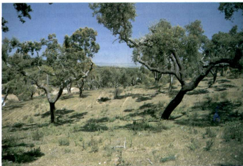
Slika 4: Najbolj znamenito drevo na Portugalskem je hrast plutovec. Še posebej je značilen za Alentejo v južnem delu države. Plutovina je poleg portovca in sardin še danes najznačilnejši portugalski izvozni artikel, čeprav je njen delež v vrednosti izvoza le še simboličen.