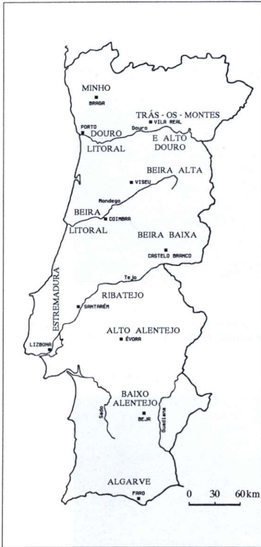
Slika 5: Portugalske province.

ca med severom in jugom ter med obalo in notranjostjo. Leži na obeh bregovih reke