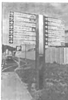
TABLA TUDI DEZINFORMIRA

Ob glavni cesti, ki vodi v industrijsko cono, so pred kratkim razširili cestišče in na njem uredili parkirne prostore, ki so namenjeni tistim, ki se skušajo znajti med smerirnimi tablamami za podjetja v coni in nekako najti izbrani cilj. Čez čas naj bi tam namestili tudi poseben informacijski računalniško vođen pano, ki bo obiskovalcem nazorno prikazal, kako v coni priti do iskanega cilja. Vse lepo in prav, vendar so tisto izogibališče začeli izrabljati obiskovalci lokalov v piramidi za parkirišče, saj je drugje težko najti parkirno mesto. Vse več je tudi voznikov, ki tisto razširitev vozišča izrabljajo za obračanje, še zlasti v nočnih urah pa so se tam tudi z avtomobili začeli ustavljati mladi, ki so zelo živahni in hrupni. Prebivalci sosednjega »gradu« se že pritožujejo zaradi nočnega kaljenja miru na tistem »počivališču«.