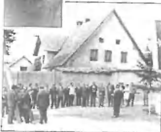
otvoritev pekarnice Grosuplje

V Trzinu sem bil pek in upravnik deset let. Kasneje sem postal direktor pekarnice v Grosupljem. Delal sem tudi pet let v Ljubljani.