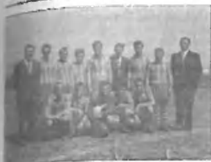
Nogometna ekipa leta 1956