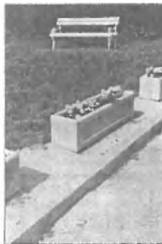
Trzin in Trzinčan

lepo ograjo primerne višine. Tako bi lahko v celoti služilo svojemu namenu in ne bi vaški potepuški psi namakali otroškega igrišča, kjer je dostop omejen le s koriti in ni nikjer tabele »Prepovedano za pse!«. No pa saj, psi ne znajo brati, tako da, kar se njih tiče, ne zaleže če tabla je ali pa je ni.