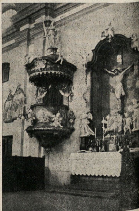
Oltar sv. Križa pri minoritih v Ptuj.

Leta 1940 se bo vršil letni sestanek pri Mariji Pomagaj na Brezjah in sicer v tednu po Veliki noči. Takrat bomo tretji red izročili v posebno varstvo Brezijanske Kraljice.