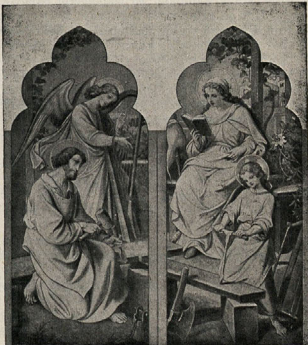
Mojster sv. Jožef in njegov Pomočnik-Učenik.

A moj učenec in Učenik me je z besedo in z gledom naučil še nekaj drugega. To, da ni veliko na tem, kaj kdo dela, kaj imenitnega ali kaj vsakdanjega, v človeških očeh malo pomembnega. Delo je lupina, telo. Njegovo jedro, duša je namen in nagib. Najnižje težaško delo, storjeno z dobrim namenom, rojeno iz nadnaravne ljubezni, je v očeh božjih neizmerno dragocenejši, kot na zunaj sijajna dela, a brez te božje duše. Jaz sem se pri vsem svojem dejanju in nehanju držal njegovega naročila, ki ga je pozneje sv. Pavel vsem sporočil: »Ali torej jeste ali pijete, ali kaj delate, vse delajte v božjo