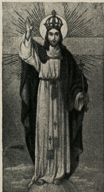
KRISTUS, NAŠ KRALJ NAJ ŽIVI!

Marija, pomoč kristjanov, sprejmi ga v svoje varstvo. Amen.