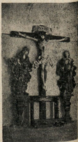
Francišškanska šola Jezus na Križu z Marijo in Janezom.

Za sveto mašo je pa molitev svetega križevega pota prva in največja pobožnost. Zato pravi častiti Ludovik Granaški, da med vsemi pobožnostmi ni nobena bolj gotova, bolj zveličavna, bolj splošna, in za vsak stan in sploh bolj primerna, kakor je spomin trpljenja našega Gospoda. To preišljevanje in hoja po krvavih stopinjah Zveličarjevih je bolj veličastno, kakor največje veličastvo. A tudi bolj ponižno, kakor vse ponižnosti; modrim skrivnost, neučenim in preprostim pa razumljivo. In kakor je Kristus pot, resnica in življenje, tako ni nobene boljše in krajše poti do