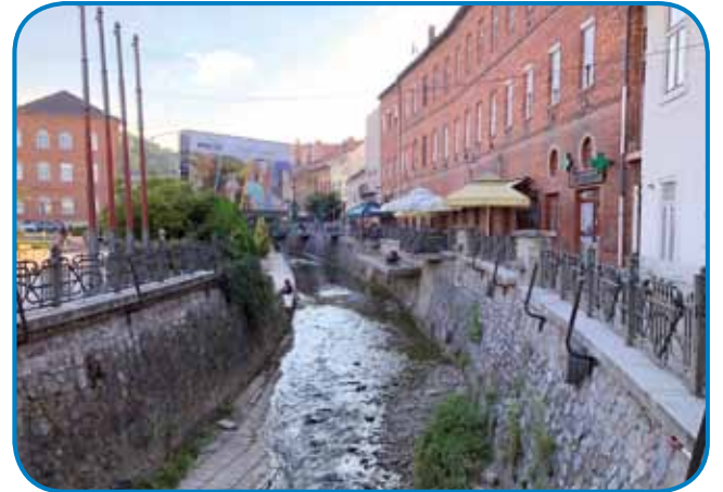
Potok Színva na srejdi Miskolca - pod držencami leko koštavamo fajni kafej ali dobro vinsko kraplo

izraelitov, de so pa zvekšoga spaumrli v holokausti. Na tau spominajo table pri nekdešnjom getoni in na glavnom panaufi, njino sinagogo pa od leta 2017 obnavljajo z državnimi penzami.