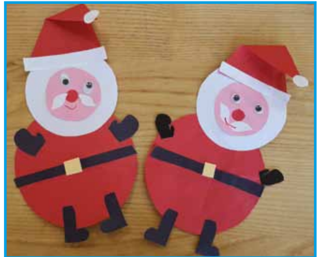
Naša Miklavža (Monošter)