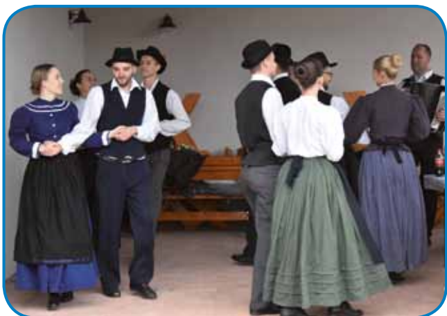
Folklorna skupina ZSM Sakalovci

Županja je z veseljem povedala, da »danes praznujemo, saj bomo končno vendar predali namenu našo etično domačijo, na kar smo že dolgo čakali in ne-