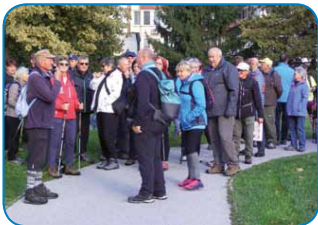
Lendavski čebelarji so organizirali tudi Medeni pohod