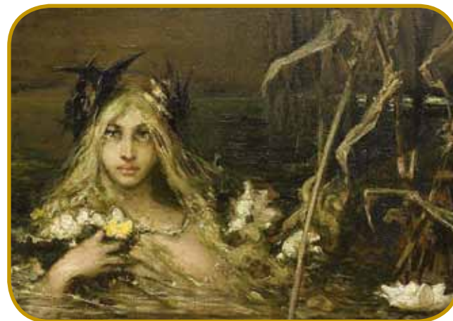
Rusalke skur cejli čas v vodej živejo. Samo gnauk na leto za eden tjeden vö pridejo