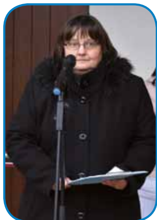
Županja Valerija Rogan