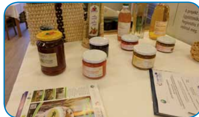
Med je zdrava hrana, dapa letos je nej bila bogata letina

pravo, ka svoje roje dostakrat ma pauleg granice pri Trdkovi. Gučo je o tom tö, ka so fčele zavoló toga, ka se podnebbe spreminja, v nevarnosti. Zadnji pet lejt je težko bilau, ka so si nej najšle zavolé hrane. Pri tom so njim pomagali