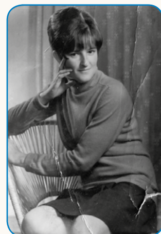
Zaplado na zaplado stran 8