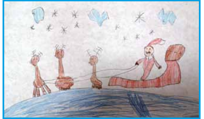
Kincse Vincze, vrtec Monošter