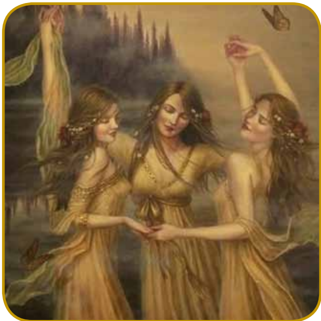
Vile rojenice: njiva lepota je moškoga leko na nikoj djala. Baug ne daj, ka bi se steri v njau zalübo. V skur božo stvorenje se nej slobaudno zalübiti

Kak gnes v eni krajinaj se na risauske svetke nej smej na zemlej delati, ovak leko vse naupek dé. Ovak pa rusalke, kak zvejkšoga vse druge vile, so lejpe ženske. V meglo so nut zravnnane, lasé pa rejsan duge majo. Gda plešejo, kama njina bausa nauga stauipi, tam mlada trava začne rasti. Depa steri bi z njimi škeu plesati, bole aj tau si ne želej. Rusalke se doj ne stavijo, tisti človek pa pleše, li samo pleše, dokejč do kraja zmantrani ne premine. Gda