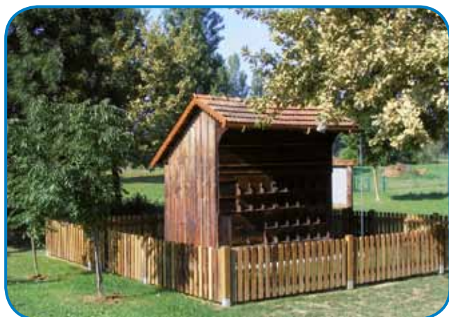
Stari čebelnjak so postavili v parku pri Dvojezični osnovni šoli I Lendava