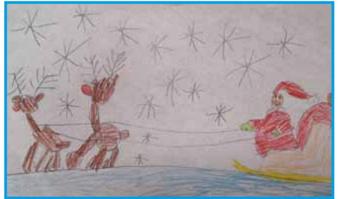
Zsófia Szabó, vrtec Monošter