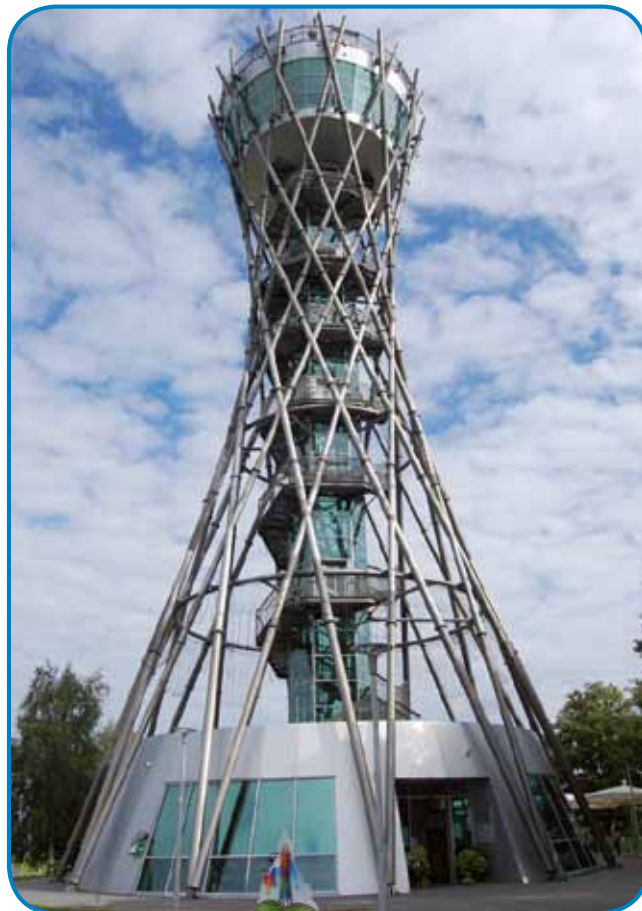
Pri razglednem stolpu Vinarium Lendava v Dolgovaških goricah bodo zgradili 530 metrov dolg Zipline Vinarium

Pri razglednem stolpu Vinarium Lendava v Dolgovaških goricah, kjer so pred kratkim obeležili šesto obletnico najvišjega razglednega stolpa v Sloveniji in ob tem zabeležili pol milijonte-