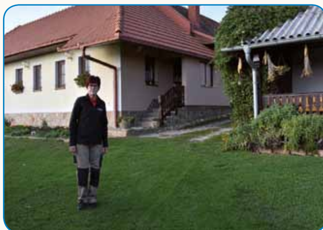
Vči se delati, pozabiš te sigdar leko stran 4