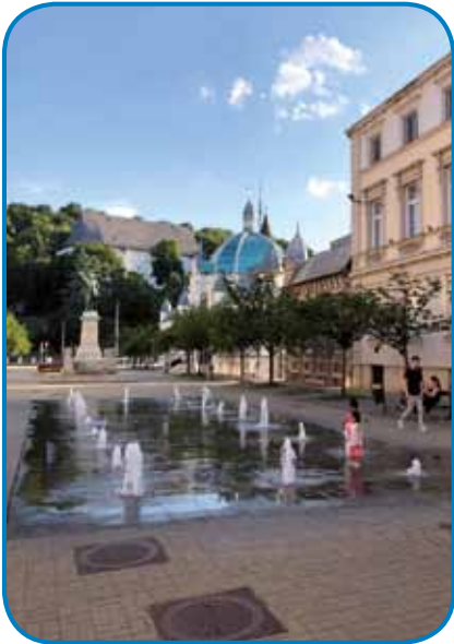
Trg Erzsébet pod bregaum Avas - ozajek stogi kip Lajosa Kossutha pred kaupancov Erzsébet

gi cuzozidali törem z razglednim punktom na vreji. Na ednom sausadnom placi so pred stau tresti lejtami napravili kaupanco Erzsébet , štero je tistoga ipa na leto gorpoiskalo više stau