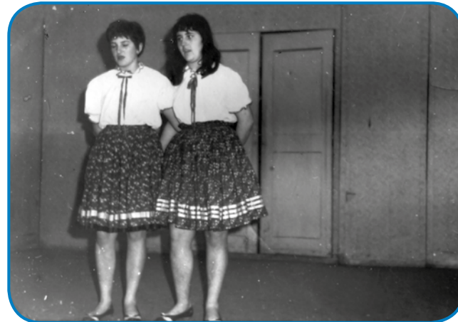
Eva s padaškinjo, popejvale sta

spoznala pa oženila, potistim sta v Slovenski vesi zidala. Gda sta naprejevzela stare družinske kejpe, kak gazda tak vertinja sta en-en pak kejpov mejla. Tak ka na dva tala sem zejo tau pogučavanje, v prvom tali de zdaj vertinja pripovedjala o svojom žitki cejlak do tistoga mau, ka sta se spoznala z možaum. Drugi keden de pa gazda na redej, on de nam pripovejdo, kak pa zaka so prišli z Gorejnjoga Senika v Slovensko ves.