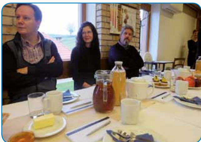
Kri, med, žmaučau, mlejko ali čaj stran 3