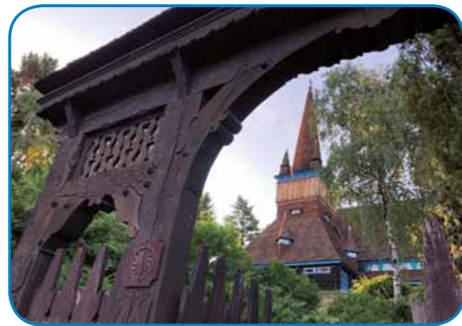
Gda je cerkev z deské dojzgorejla, so nauvo nej cejlak po stari planaj postavili - lejs pa motivi so z Erdeljskoga

njej vozi že več kak stau lejt tramvaj (villamos) od veukoga panaufa do varaškoga tala Diósgyör. Ulica je skor vseposedik dvajsti mejterov šurka, na bejdvej njeni stranaj stogijo v redej baute, restavracije in kavarne. Vsakši dén se tam špancıra ali pašči vnaugo lüstva, ka dava varaši edno živo, posabno atmosfero. Miskolc je glaven varaš sövernomadžarske regije, s svojimi 150 gezero lidami je po Budimpešti in Debreceni tretje največke vogrsko mesto. Leži pod bregami Bükk, eške gnes pa je edno največke industrijsko (ipari) središče Madžarske. Zvün tradicionalne težke najdemo tam zdaj že elektronsko, avtomobilsko in kemijsko industrijo tö. V slejdnji tresti lejtaj se v varaši trüdjijo, ka bi gratali s kaupancov pod zemlaur (barlangfürdő) v Miskolctapolci, gradom v Diósgyöri in hotelskov palačov v Lillafüredi edno prilüb-leno turistično mesto. Ne smejmo pa pozabiti, ka je Miskolc s svojov univerzov šaulski in kulturni center