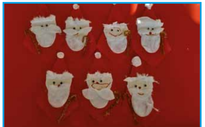
Naši Miklavži v Vrtcu Gornji Senik (poslala Andreja Serdt Maučec)