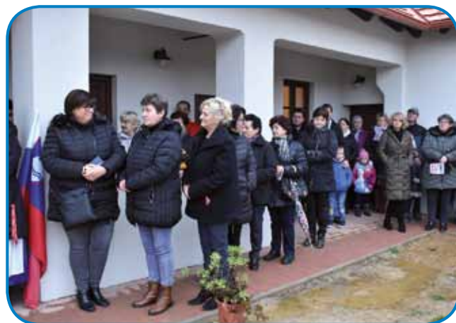
Gostje in domačini na »trnaci« obnovljene hiše

»Verjamem in upam, da bo kmalu ta investicija priljubljena tako tukaj v Porabju kot tudi med turisti, ki