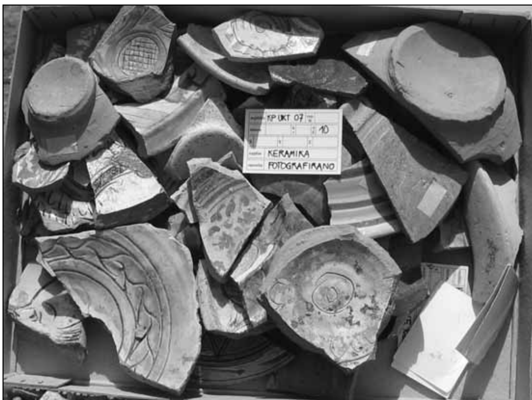
Sl. 3: Najdbe keramike z izkopavanj. Fig. 3: Pottery ware finds from the excavations.

bile stene posode še mehke, zato je že v tej fazi prihajalo do prvih poškodb, ki so onemogočile nadaljevanje dela. Odlomki z Ukmarjevega trga pripadajo fazi, ko je keramika že okrašena z risbo v engobi na omenjen način in enkrat žgana. Temu je sledila druga faza, se pravi okraševanje s slikanjem z barvo in zaključni premaz s prosojnim loščem ter drugo žganje. Zaradi odsotnosti barvnega okrasa in lošča je zelo verjetno, da je na gradivu z Ukmarjevega trga prišlo do poškodb med prvim žganjem. Majhne dimenzije odlomkov ne nudijo zadostne podatke o vzroku poškodb, ki bi kazali na temperaturne nepravilnosti med žganjem (previsoka, neenakomerna temperatura ali prehitro žganje) ali za poškodbe keramike zaradi nepravilnega zlaganja ali rušenja zloženih posod med žganjem v peči.