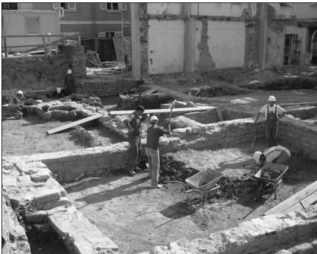
Sl. 2: Pogled na izkopavanja. Fig. 2: View of the excavations.