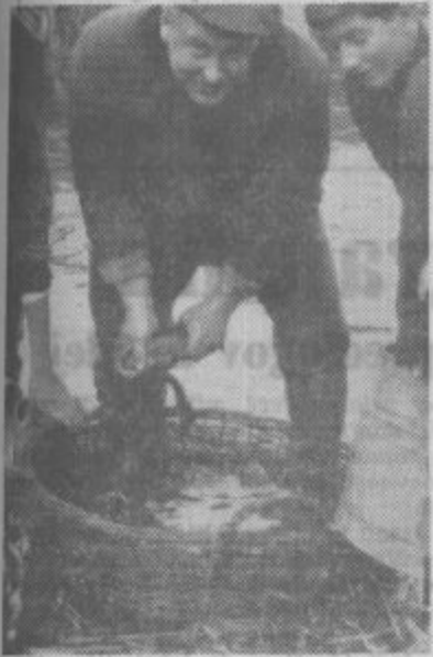
Predno ribe odnesejo v druge vode, jih prešetejo

ČLANI RIBIŠKE DRUŽINE »PAKA« ŠOŠTANJ VEDO, DA JE SLADKOVIDNO RIBIŠTVO PANOGA NARODNEGA GOSPODARSTVA, DA SO RIBE V NARAVNIH VODAH SPLOŠNO LJUDSKO PREMOŽENJE, KI GA UPRAVLJAJO OBČINSKE SKUPŠČINE, Z NJIM PA GOSPODARIJO RIBIŠKE ORGANIZACIJE. RIBIŠTVO OBSEGA GOJITEV IN PRILAŠČANJE RIB, RIBJIH IKER, RAKOV IN DRUGIH VODNIH ŽIVALI, V KOLIKOR NISO PREDMET LOVA PO ZAKONU O LOVU. PO ODLOČBI SKUPŠČINE OBČINE VELENJE IN SLOVENJ GRADEC IMA RIBIŠKA DRUŽINA »PAKA« V GOSPODARJENJU DOLOČENE GOJITVENE, POSTRVJE (SALMONIDNE) IN BELIČARKE (CYPRINIDNE) VODE, KI SO RAZDELJENE V LOVNE IN GOJITVENE REVIRJE.