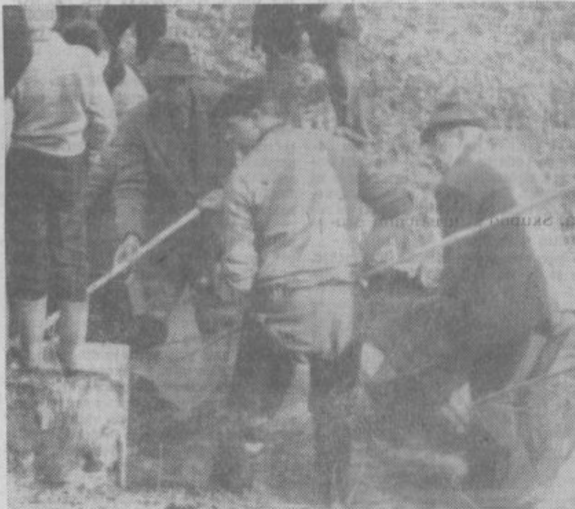
Elektro odlov rib