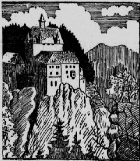
Kje je graščak?

Kuverte s firmo, - - pisma, - - - - račune itd - izvršuje natančno po : naročilu : : Katoliška : : tiskarna : v Ljubljani.