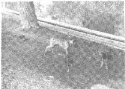
Pasja anarhija: Na sprehajališču, po parkih, zelenicah in tudi po mestu, povsod lahko vidite pse, ki so spuščeni, četudi so predpisi, da morajo pse voditi na vrvicah

Pri nas je čisto pasja anarhija, se razburjajo občani in čas bi že bil, da bi odgovorni začeli delati red, predno bo prišlo do nesreče in hudih zdrav. Na zelenih površnih, peskovnikih in asfaltu povsod pasji iztrebki. Dopoldne se na igrišču igrajo otroci iz vrtca, na tistih površinah, ki so jih zvečer in že zgodaj zjutraj onesnažili številni psi. Psi letajo okoli nekontrolirano, med njimi volčjaki in drugi veliki psi raznih pasem. Nihče ne spoštuje predpisov in so brezbržni do nevarnosti okužb. Znano je, (Naša komuna je o tem podrobno pisala), da je področje občine Vič Rudnik med najbolj okuženimi občinami s steklino v Sloveniji. Po najnovejših podatkih je odsek za Virologijo Veterinarske fakultete v Ljubljani za mesec januar 1992 ponovno ugotovil steklino pri več živalih. Lovci LD Rakovnik so med akcijo čiščenja v soboto 21. marca odkrili v grmovju podivjanega mačka, ki se je čudno obnašal. Maček je ušel, ker so bili lovci brez pušk. Občani v Murglah so ugotovili, da se na obrobju naselja zadržujejo v grmovju podivjane mačke, nekatere pa prihajajo tudi preko potoka z Ljubljanskega barja. Prav tako se po naselju potepajo potepinski psi. V pred-