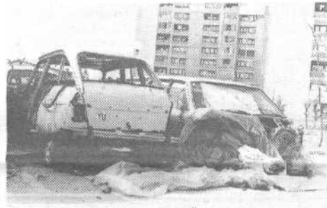
Takšna pa je slika pred Tržaško 50. Novi bloki, svinjarija...