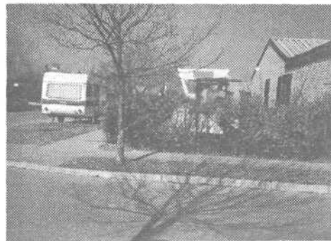
Zgornji posnetek je iz Murgle, kjer si je eden izmed tamkajšnjih stanovalcev uredil na javni površini, ozelenil jo je z živo mejo, provizorij za izdelavo čolna, da o hrabri prikolicke ne govornimo.

Ob zaključku akcije bo Ljubljanska turistična zveza podelila posebno priznanje vsem tistim, za katere bo posebna komisija, sestavljena iz predstavnikov turističnih društev in krajevnih skupnosti, na osnovi dogovorjenih kriterijev, konec maja in avgusta ocenila Ljubljano in izbrala najboljše.