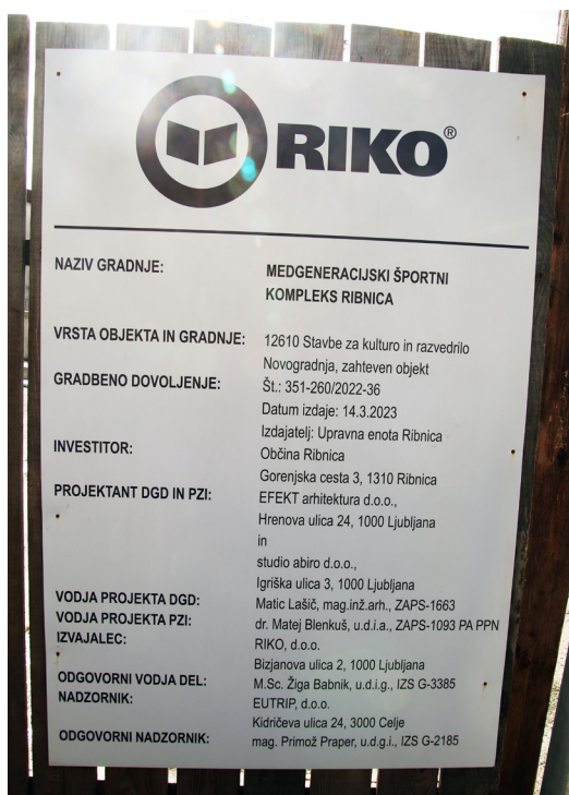
Slika 1: Na nekdanjem Ideal centru (FRO trgovine in storitev) v Ribnici poteka gradnja medgeneracijskega športnega kompleksa.