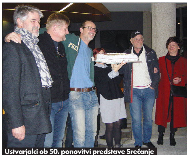
Ustvarjalci ob 50. ponovitvi predstave Srečanje

lahko zaustavimo pri vsakem igralcu, obudimo spomine na njegove vloge in slišimo tudi njegov glas. Razstavo so