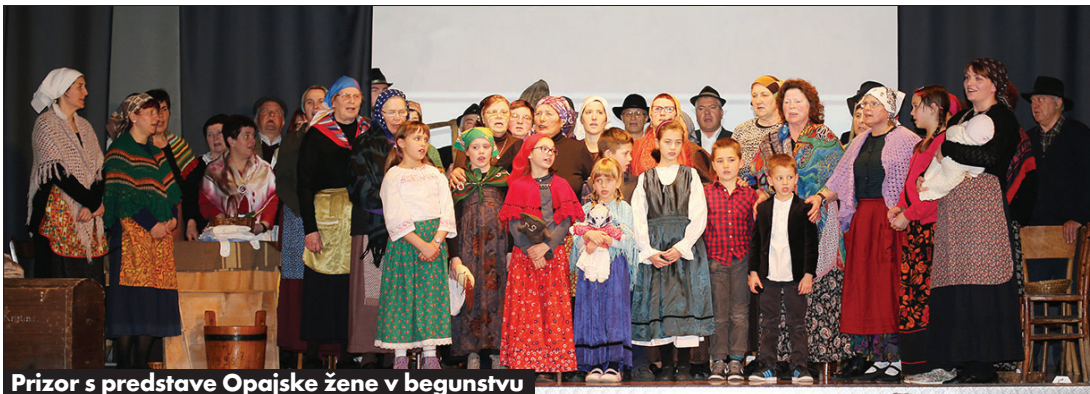
Prizor s predstave Opajske žene v begunstvu