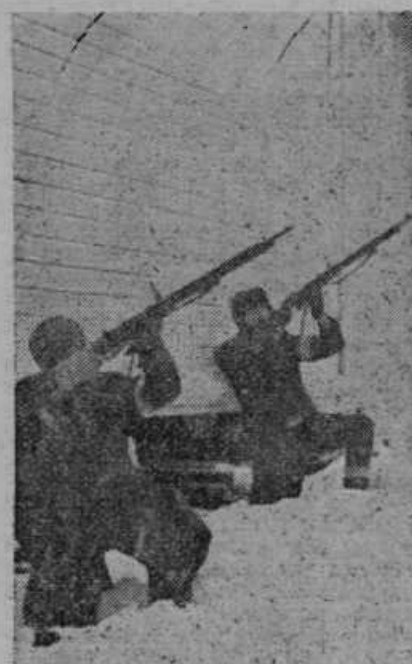
Sovjetska letala zelo pogosto le- tajo nad Finsko. Slika nam pred- stavlja dva posebno izurjena fins- ska strelca »pri delu«