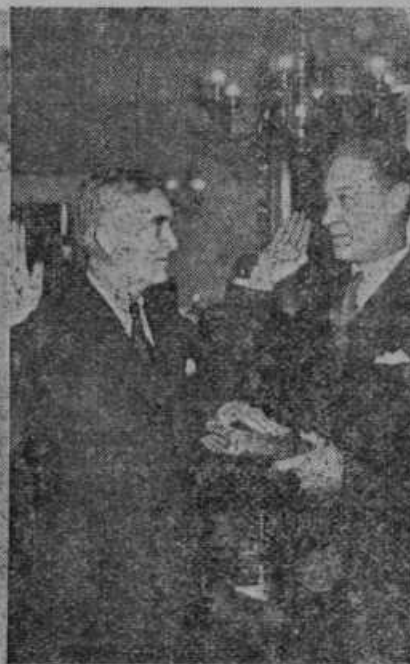
Karel Edison, sin velikega ameri- škoga izumitelja, pri zaprisegi kot novi mornariški minister Zedinje- nih držav