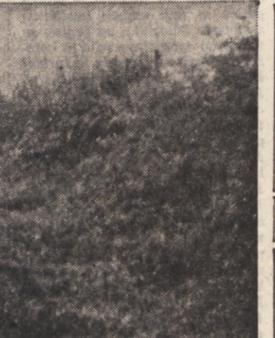
Robida je prerasa jelkno ograjo na cesti iz Pevme v Štmaru