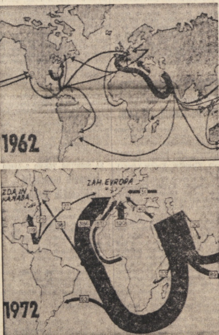
Zgornja zemljevidna kazen, kako se je v minule desetletju — od 1962 do 1972 — povečala odvisnost razvitega sveta od bližnjazahodnega petroleja. Številke označujejo milijone ton surove nafte, ki prihaja z Bližnjega vzhoda in drugih naftnih področij v druge države sveta

Po mnenju političnih komentatorjev, naj bi konferenca držav proizvajalk petroleja osvojila predloge Saudove Arabije - Evropi ne grozi energetska kriza