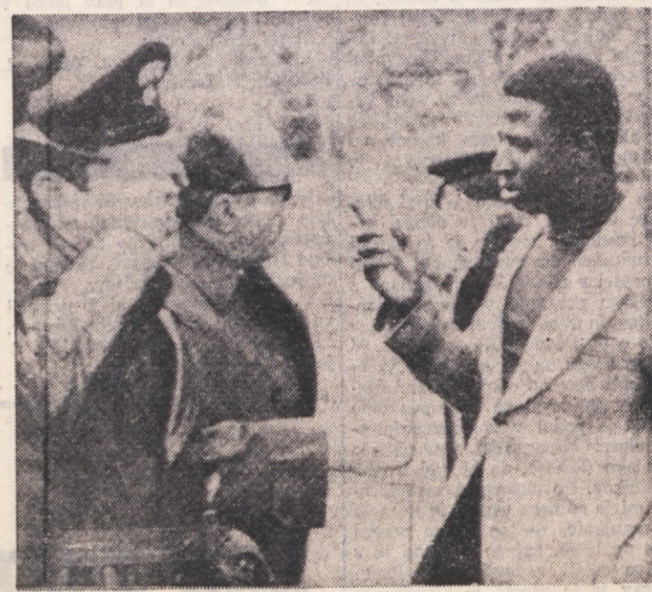
Temnopolti «posrednik» Traore, ki bi moral voditi rojake do Milana, a jih je pripeljal do Borsta, kjer so trije izmučeni mladeniči podlegli mrazu

Prvi izsledki obdukcije - Trupla umrlih bodo verjetno pokopali v Trstu