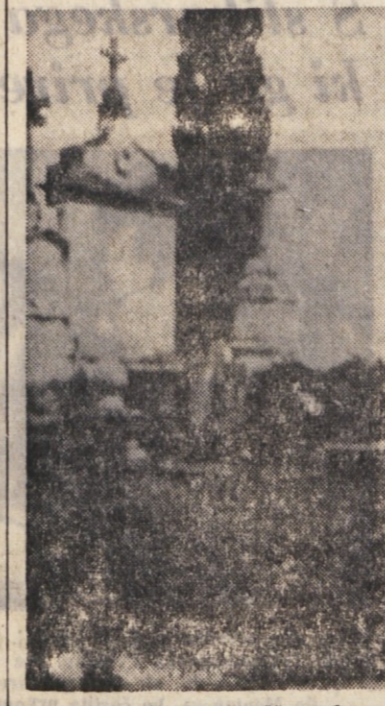
Trava prerasča grobove na pokopališču v Pevmi

Na sedežu mestnih redarjev v Ulici Mazzini so na razpolago lastnikov sledeči predmeti: dve torbici s denarjem, tri vsotne denarje, muška zapesna ura, ženska zapesna ura, registrator, žensko kolo, moško kolo, kolo «americano», kolo «sgraziella», moped, moška jopca, otroški jopič, otroški čevlji, križ iz dragocene kovine, dva para očal za vid, televizorski drog, ženska torbica, aktovka, več šopov ključev.