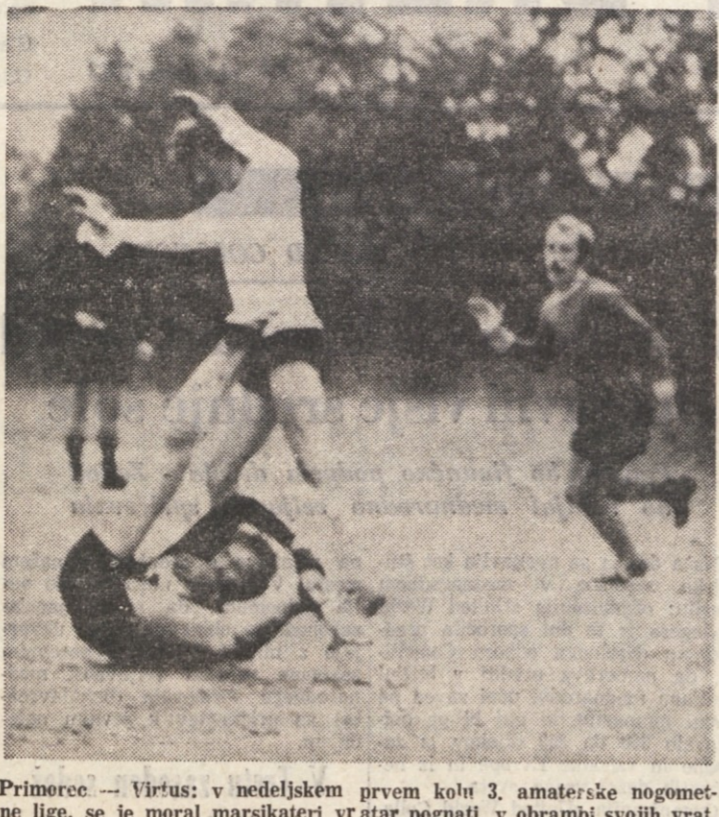
Primorec - Virtus: v nedeljskem prvem kolu 3. amaterske nogometne lige, se je moral marsikateri vratar pogati, v obrambi svojih vrat, v blato tako, kot se je na naši sliki vratar Virtusa