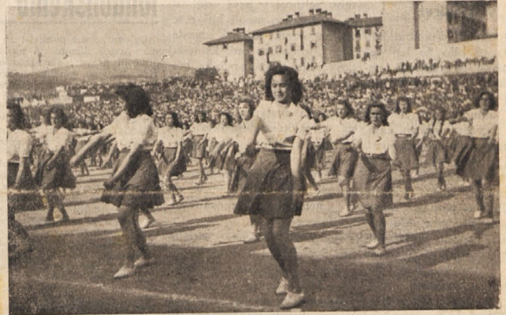
Nastop mladine na stadionu

Množica je kar onemela, ko je videla, da je pritekla v Gradiško iz Gorice ravno tisti zastopnik, kateri še pred osmimi dnevi ni hotel ničesar slišati o skupnem nastopu in je stavil na Enotne sindikate nesprenpljive pogoje. Sedaj pa je dejal, naj bi pozabili