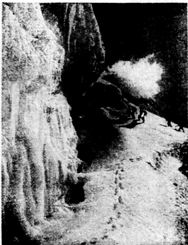
Vzpon na Nanga Parbat

Šesta ekspedicija na Nanga Parbat — Pripravljajo jo zopet Nemci