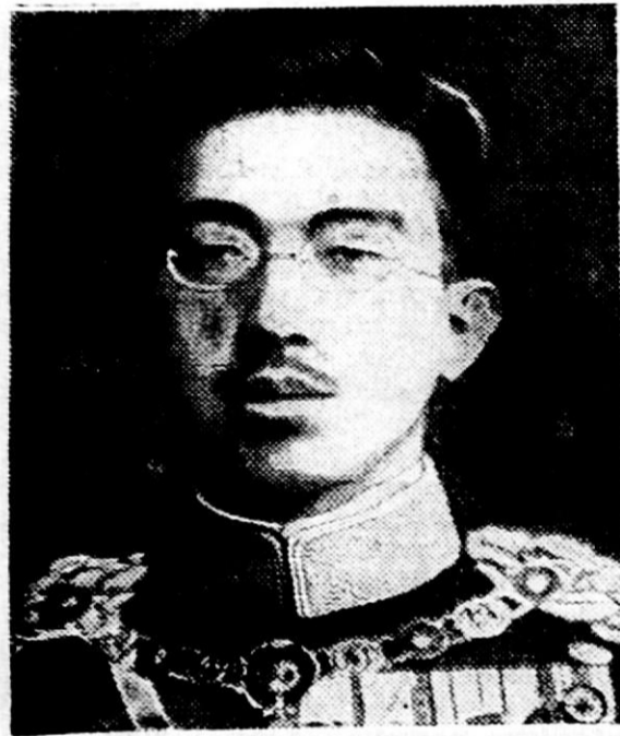
Japonski cesar Hirohito

Moderni duh samurajev — Vojna oče ustvarjanja in mati kulture