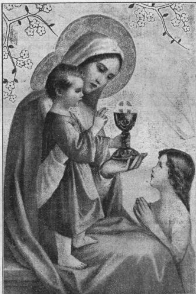
Takih je nebeško kraljestvo.

dige o važnosti katoliških mladinskih udruženj. Izven cerkve naj se oskrbe nabirne prireditve za »Hrvatski Orlovski Savez« v Zagrebu.