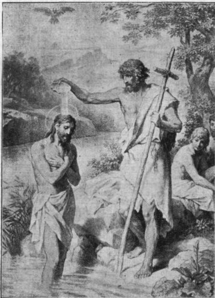
Vzor svete zdržnosti in treznosti.

no oblubo, ako mu v spomin pokličejo, kaj je pri sv. krstu Bogu obljubilo. Ker cerkveni učenički, cerkveni zbori in skušnja uči, kako koristno je obnavljati krstno oblubo, ni li torej modro in pametno, da storimo to na popoln način; namreč s posvetitvijo samega sebe Jezusu Kristusu po njegovi sveti Materi? Pravim na popoln način, ker se pri tem darovanju samega sebe našemu Gospodu poslužujemo najpopolnejšega sredstva, namreč presvete Device.