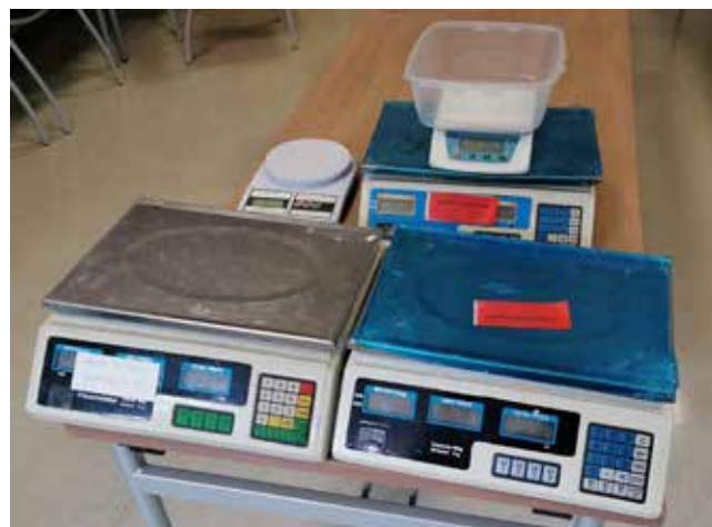
Slika 2 : Primeri neustreznih tehtnic

ličnih lokacijah. Te tehtnice so bile na videz pogosto podobne overljivim trgovskim tehtnicam in so imele celo funkcijo izračuna cene, v nekaterih primerih pa so bile v uporabi kar kuhinjske tehtnice za domačo uporabo. Kljub intenzivnemu delovanju inšpektorjev Urada RS za meroslovje v okviru zakonskih možnosti so podjetja, ki so uporabljala te tehtnice, na različne načine oteževala učinkovito ukrepanje inšpektorjev ter kršitve zavestno ponavljala tako, da so po inšpekcijskem nadzoru meroslovno neustrezne tehtnice nadomestila z drugimi prav tako neustreznimi in ceneniimi tehtnicami. Prodajalci so bili v velikem številu primerov študentje. Podjetja, ki jim je bila izrečena globa, pa te najpogosteje niso plačala, saj so v svoji iznajdljivosti uporabila najrazličnejše metode, da kazni ni bilo mogoče izterjati. Ob koncu prodajne sezone so inšpektorji kljub vsemu dosegli, da sta dve podjetji kupili overjene tehtnice oziroma prenehali izdelke prodajati po masi, eno podjetje pa je prenehalo s tovrstno prodajo.