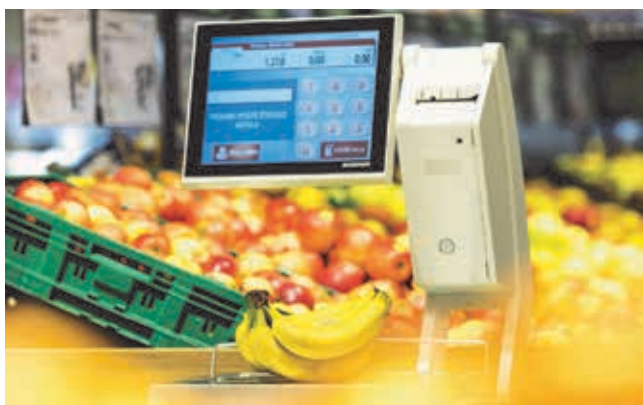
Slika 1 : Zakonsko merilo – neavtomatska tehtnica, ki se uporablja za določitev cene prodajnega blaga na podlagi mase

Uporaba neavtomatskih tehtnic za določitev cene prodajanega blaga je zelo razširjena. Ocenjujemo, da se za ta namen v Sloveniji uporablja preko 23.000 tehtnic. Gre za tehtnice, ki se vsakodnevno uporabljajo za določitev cene oziroma pri obračunu prodajanih živilskih izdelkov v trgovinah, na tržnicah in premičnih stojnicah, blaga v tehničnih in kmetijsko-vrtnarskih trgovinah, pisemskih pošilk na poštah, prtljage na letališčih, živil v kuhinjah, kjer se opravlja gostinska dejavnost, in podobno.