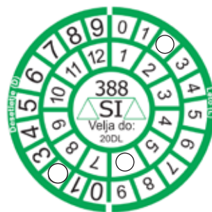
Slika 4 : Oznaka redne overitve

Oznaka prve overitve ima ob črki M označeni zadnji dve številki letnice izvedene overitve. Prikazana oznaka ima označeno leto 2020; ker je rok redne overitve dve leti, ima tehtnica s tako oznako veljavno overitev do vključno 31. 12. 2022.