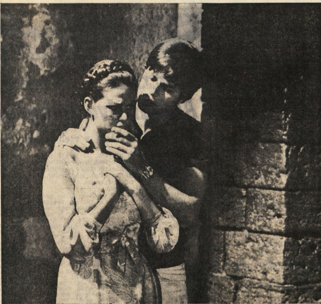
Prizor iz nagrajenega Viscontijevega filma «Vaghe stelle dell'Orsa...», kjer nastopata v glavnih vlogah Claudia Cardinale in Jean Sorel (na sliki). V njem se je režiser lotil obravnavanja problema, ki se ga doslej v filmu ni še nihče, namreč krvoskrusnega ljubzenskega razmerja med sestri in bratom. Nič čudnega, torej, če je zaradi tega bilo delo tudi predmet ostrih polemik in žolčnih napadov ter kritik.

Glavno mesto nekoč enotnega Pendžaba, Lahore - v katerega bližini se danes vodijo borbe - je po razdelitvi ostalo prestolnica pakistanskega dela te dežele. Administrativni center indijskega dela države Pendžab pa je postal Camdžar. Največje mesto vzhodnega (indijskega) Pendžaba je Amritsar, ki se ga te dni pogosto omenja v vojnih biltenih.