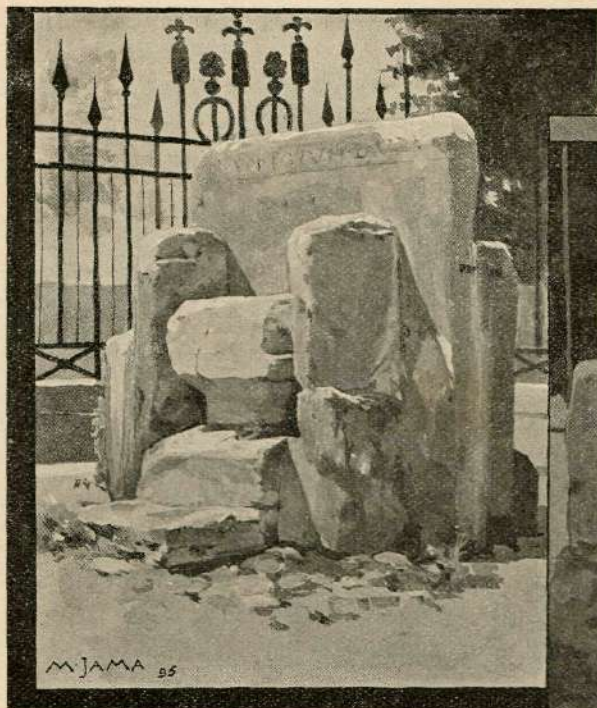
Vojvodski prestol na gospesvetskem polju.

Ob Glini je taborila četa Krajincev od Kolpe, ki so bili oblečeni v belo prtenino. Možje so nosili srajco iz domačega platna, prepasano s širokim, rjavim jermenom in torbo ob strani, ženske pa so imele bele