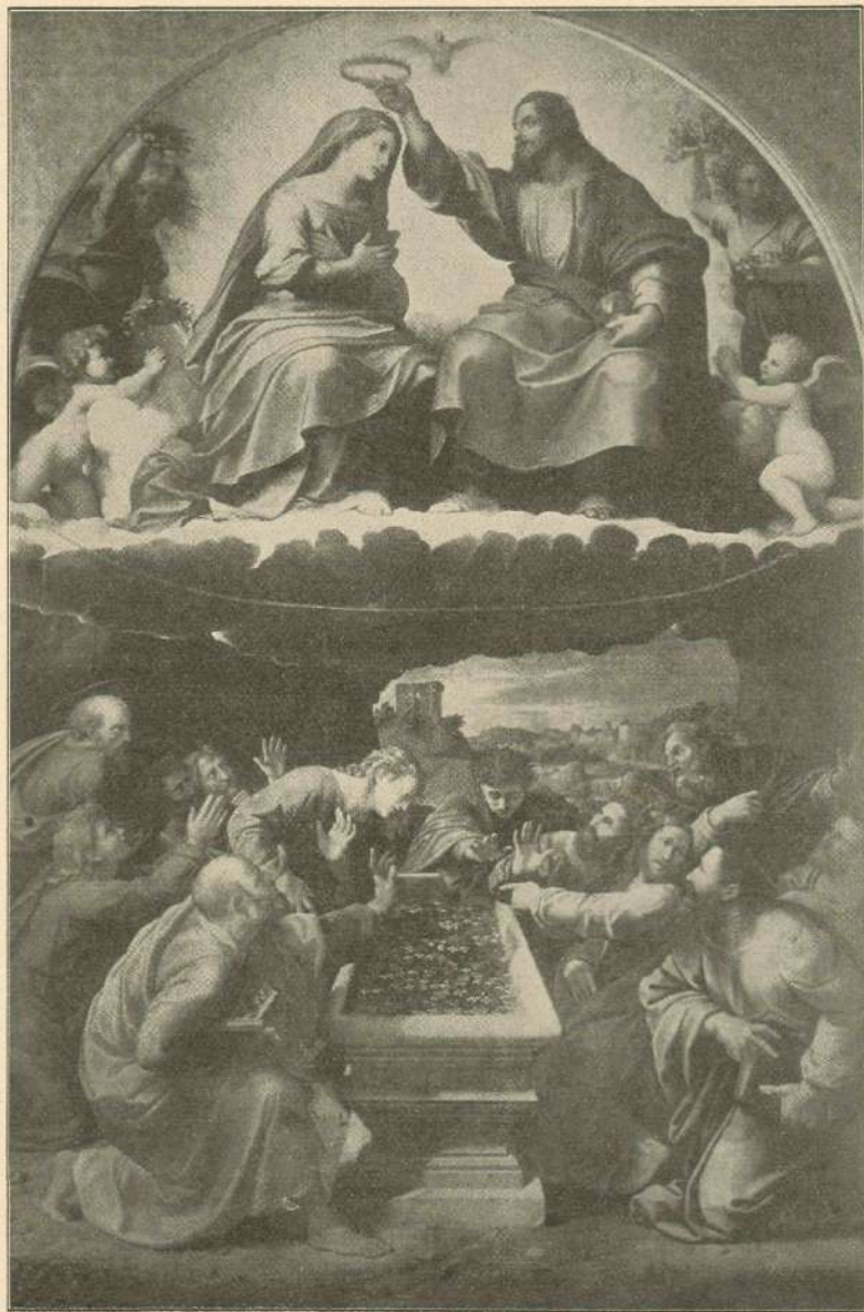
Slikal Giulio Romano.

sicer zaničujem slovensko sodrgo, a priznati moram, da slovenske devojke tekmujejo z najlepšimi nemškimi krasoticami. In Milena je cvet slovenskih deklet.“