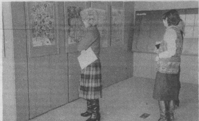
KULTURA V ZDRUŽENEM DELU