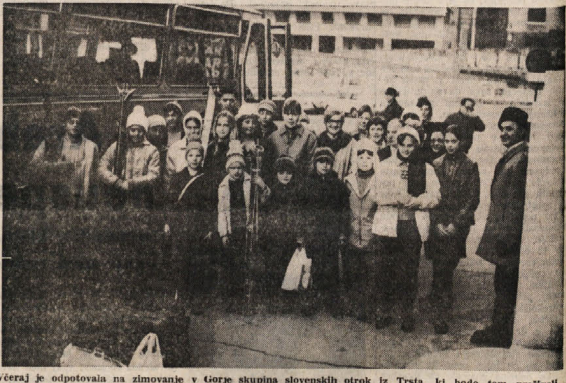
Včeraj je odpotovala na zimovanje v Gorje skupina slovenskih otrok iz Trsta, ki bodo tam preživeli počitnice do 2. januarja. Za zimovanje je poskrbelo Slovenska kulturno gospodarska zveza

Nobenega dvoma ni, da bi Sirija in Libanon prav takor Jordanija in Egipt, najraje videli vodjo palestinske osvobodilne fronte Arafata za zapah. Kajti novi arabski heroj jemlje uradni predstavniki Arabcev njihovo slavo, moč in vpliv — in to z vsakim dnem bolj. Celotno Naserjevo vsemogočno ime prvoborca za arabsko svobodo počasi bleda pred Arafatovo slavo in njegovimi partizanskimi enotami.