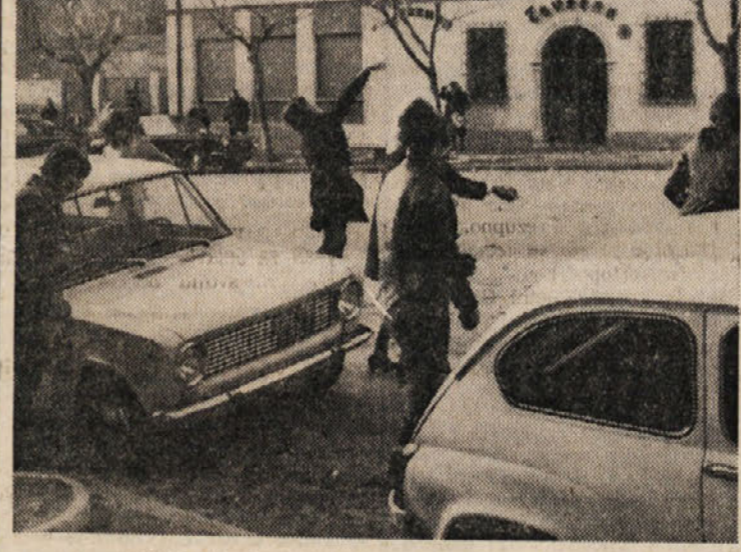
Med včerajšnjim «lučanjem» na boljuskem trgu

Josip Ota pripoveduje, kako je bilo pred leti - Pred nami kratka pustna doba