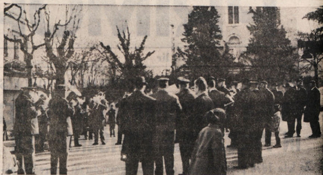
Kot običajno na božični dan, so tudi letos člani godbe na pihala iz Nabržine imeli tradicionalni koncert na glavnem trgu v Nabržini. Godba na pihala iz Nabržine priredi vsako leto tri take kratke koncerte, in sicer za veliko noč, na dan vsakega patrona sv. Roka in za božič. Po pripovedovanju vaščanov so godbeniki imeli koncert tudi 1. 1929, ko je bila zelo tako huda zima, da so jim celo »zvoki zmrazovali v zraku«

Nesreča se je zgodila v okolici glavnega mesta Armenije