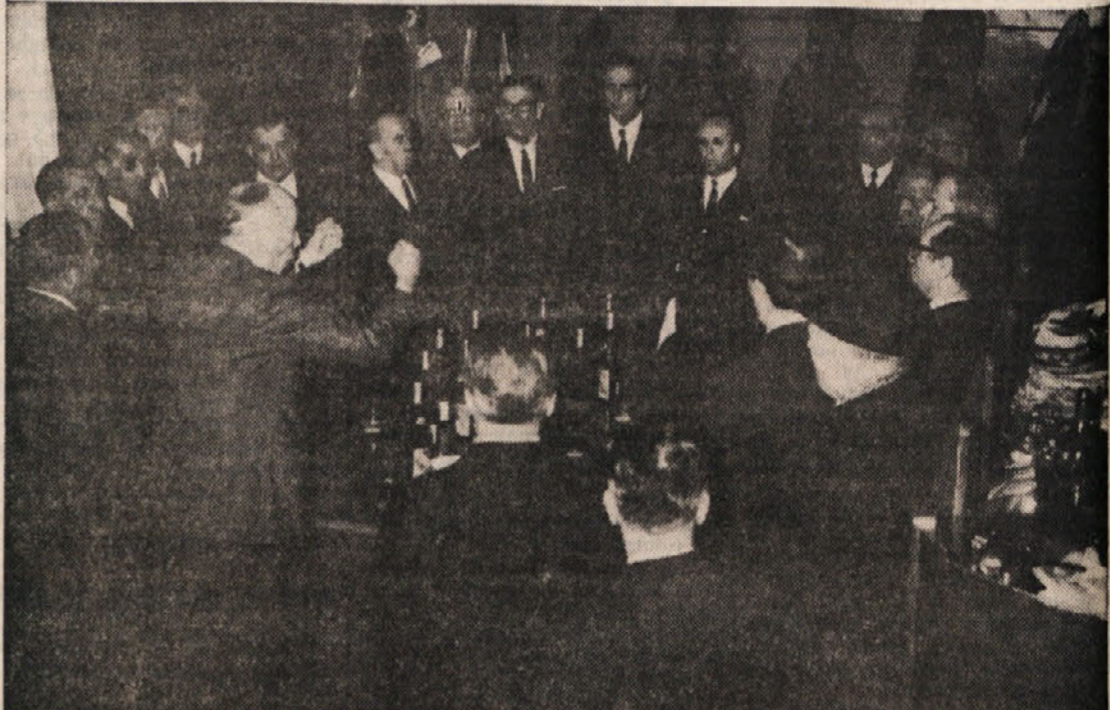
Je že v tradiciji, da se pevci prosvetnega društva »Ivan Cankar« pri Sv. Jakobu zjutraj na božični dan zberejo v znani slovenski gostilni pri »Jadransu«, kjer zapojejo lepe slovenske narodne in božične pesmi