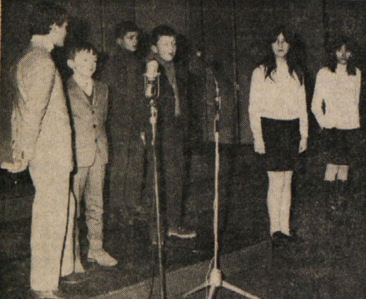
Solski otroci iz Benečije na včerajšnjem nastopu