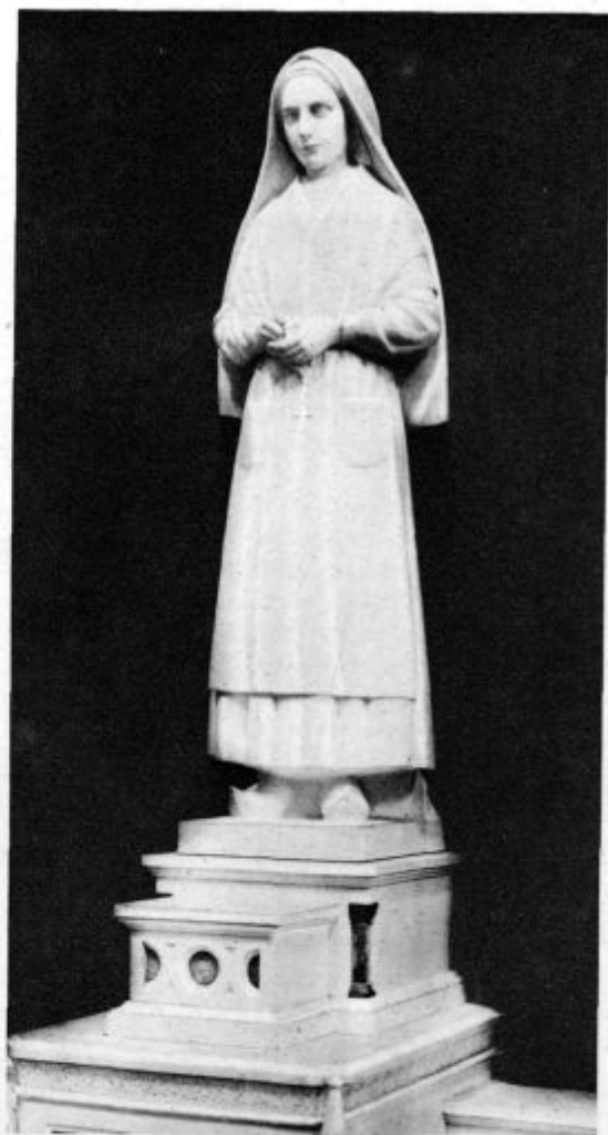
Sv. Bernardka, nov kip v lurški župni cerkvi

Za danes rečem samó: Kamor sem prišel med tuje ljudi — ljudstvo je povsod dobro. Mi se med seboj le ne poznamo ne, zato se pogostokrat krivo sodimo, zato se ne cenimo, ljubimo pa še manj. Treba je, da se narodi med seboj bolj spoznavamo, pa se bomo začeli bolj ceniti in celo ljubiti, in zavedeli se bomo, da smo vsi le ena velika družina božja. Tudi o tem prihodnjč še kaj več. J. Kalan.