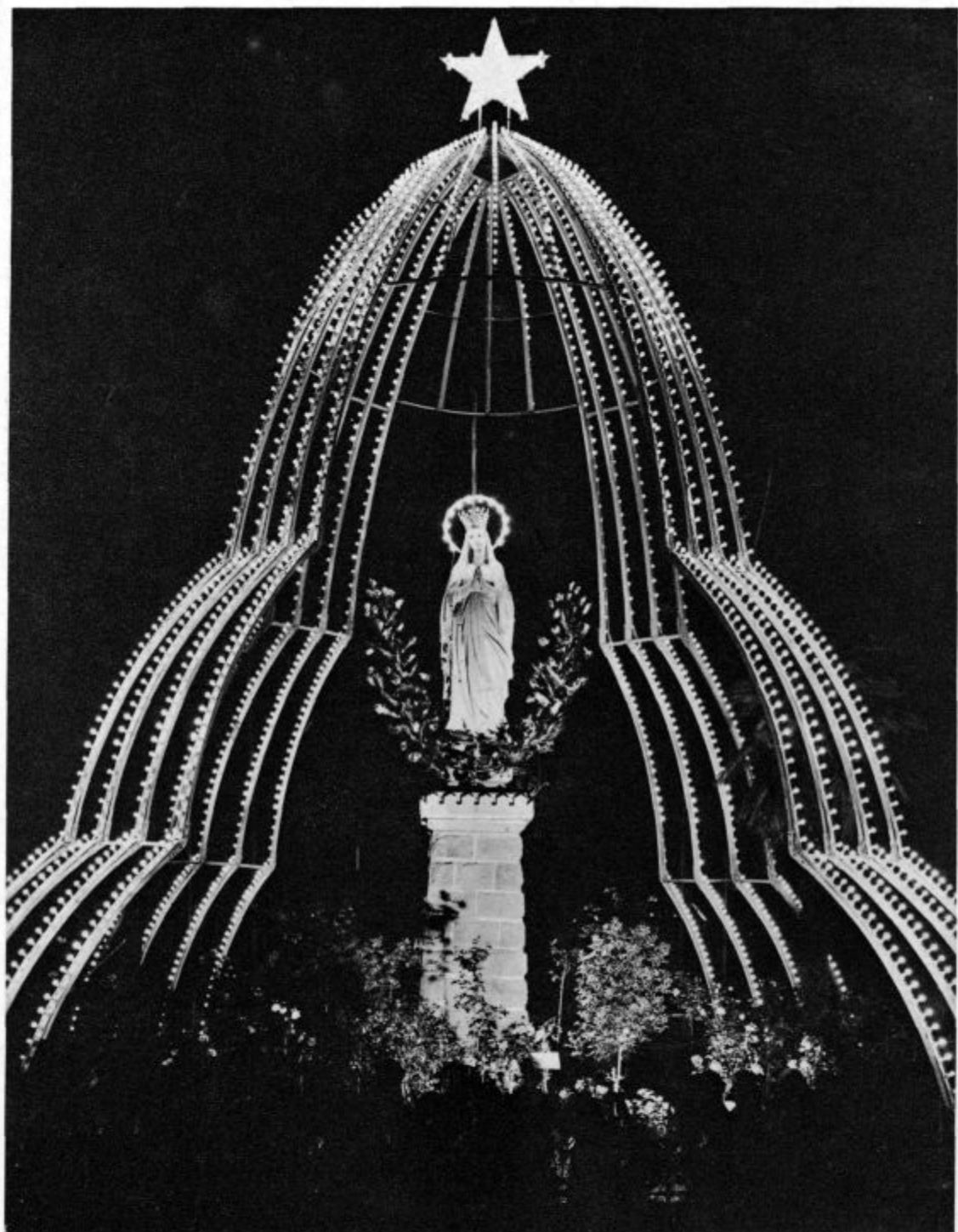
Kip Brezmadežne v Lurdu razsvetljen za slovesno tridnevnico