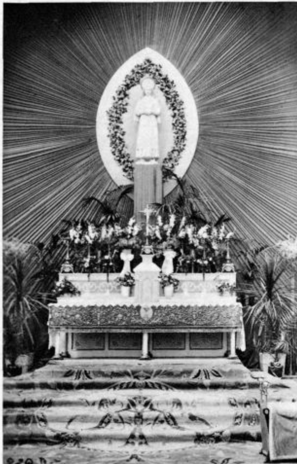
Bernardkin oltar, postavljen pred rožnavensko cerkvičo v Lurdu za slovesno tridnevniko

Ko v krščanski družini odmolijo večerno molitev, se odpravljajo brž vsi, da poiščejo svoja gnezdeca za odpočitek. To je v redu. In ko je v škofovi kapeli