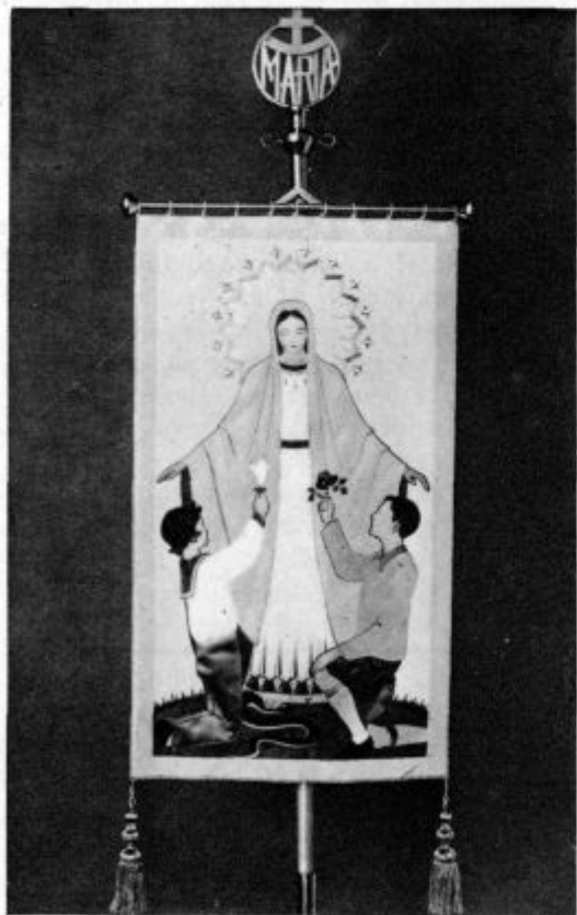
Zastava stolnega deškega Marijinega ortca v Mariboru