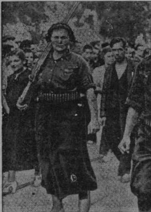
Španska rdeča miličnica odhaja s prostovoljci na bojišče.