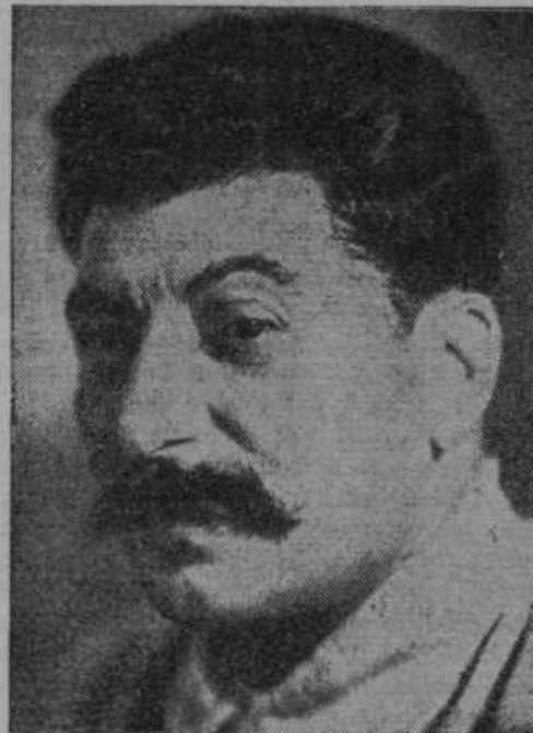
Diktator Rusije Stalin je dal postreliti Leninovo gardo.