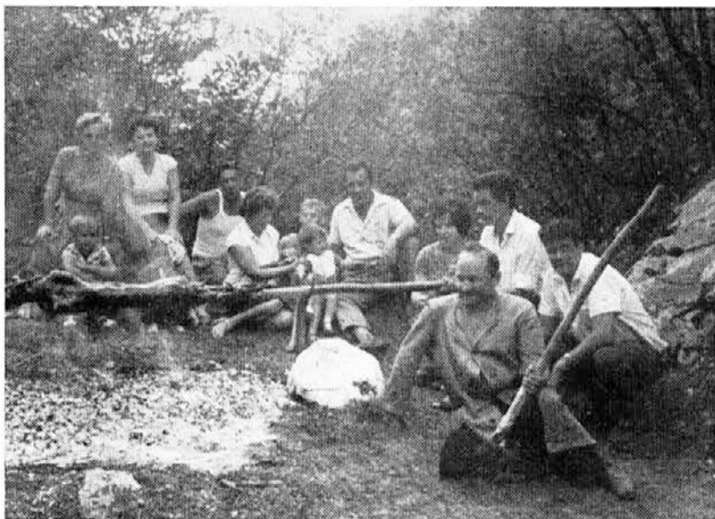
Na pečenega janjčka je ostal samo lep spomin

Čakati na učilnice, inštruktorje itd. bi bilo odveč. Vse navedeno izobraževalno delo se lahko opravi v oddelku med delovnim časom. Takšno izobraževanje naj bi bilo obvezno in kolektivno. Zelim posameznikov pa bo kot doslej ustregla Ljudska univerza. Upamo, da bomo s takim delom kmalu pričeli, saj se nam bližajo meseci, ki so za to najbolj primerni.