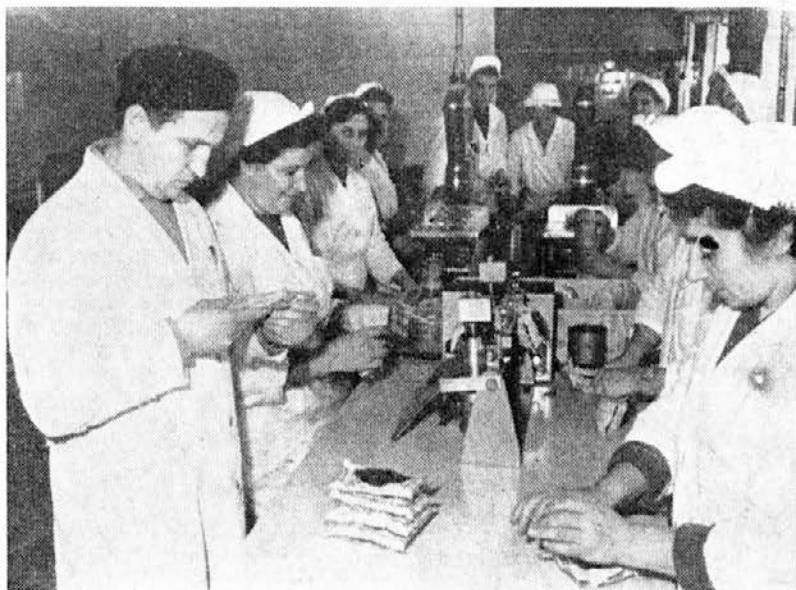
Vsakdanji motiv iz oddelka predelave sliv

Večji del letošnje proizvodnje ali skoraj 60% bo opravljeno v zadnjih mesecih tega leta. Tako povečanje proizvodnje na enem zapiralnem stroju smo dosegli s tehnično izboljšavo, ki teoretično stoo odstotno poveča zmogljivost varjenja vrečk. Praktično smo dosegli ca. 41% večjo produktivnost, če računamo povprečno število