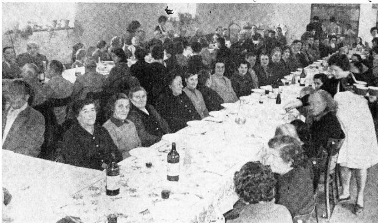
Upokoјenci kot gostje v naši menzi