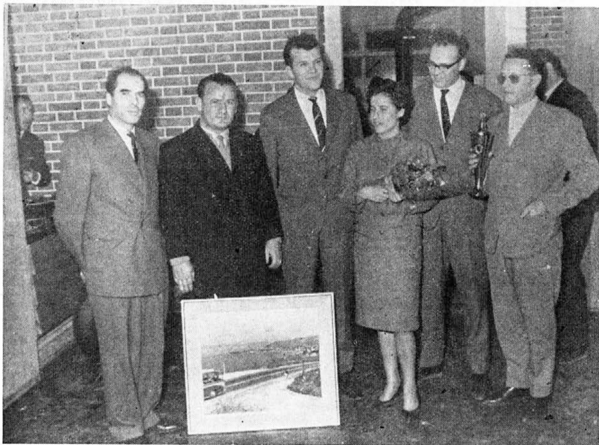
Ob predaji spominov ob srečanju predstavnikov »Delamarisa« in »Podravke« na »Belvederu«