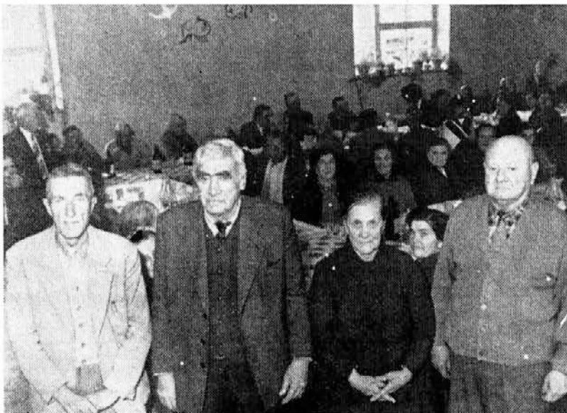
Štirje najstarejši upokoјenci