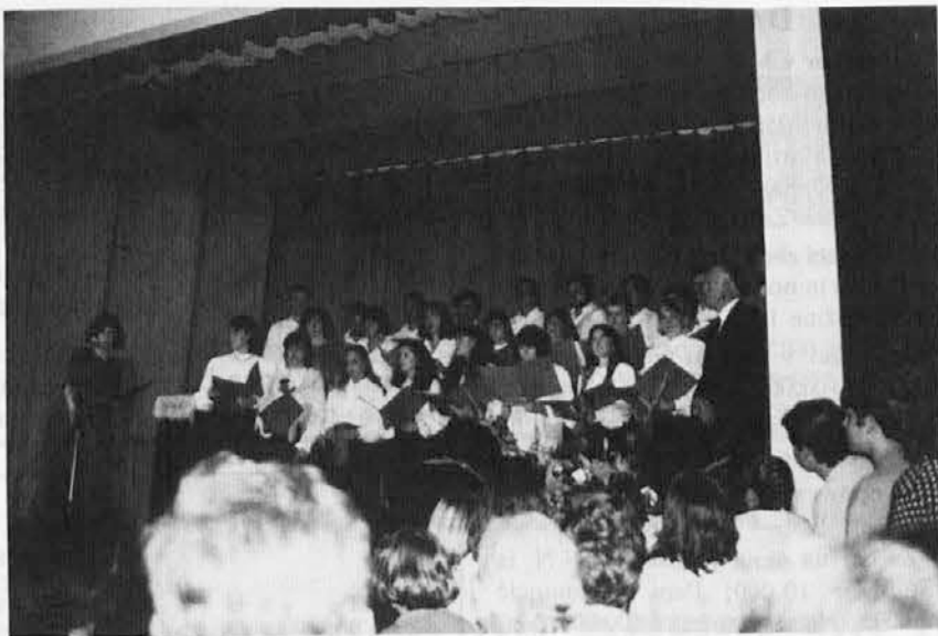
Zaključna pesem bivših in sedanjih dijakov

Škoda, da ni bilo udeležbe vredne take lepe igre. Vse drugo je danes vabljivo starim in mladim. Kdo je kriv? Vsak zna, kdo je kriv. Odgo-