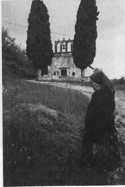
Motiv iz Glema

Tako je že ob koncu šestdesetih let prišlo do pravega razcveta obalnega področja, ki je postalo med gospodarsko najvitalnejšimi in hkrati naselitveno najprivlačnejšimi v Sloveniji. Število prebivalcev se je v odnosu na predvojno sunkoma skoraj podvojilo ter je Slovenska Istra danes z okrog 75.000 prebivalci, ki so pretežno koncentrirani na priobalnem pasu, tretji največji slovenski urbani konglomerat, za Ljubljano in Mariborom. Začela se je tudi revitalizacija podeželja, ki se je iz bližnjih primestnih naselij postopoma pomikala v notranjost. Istrani so začeli obnavljati svoje vinograde, oljčne gaje in na novo krčiti zaraščene travnike, njive in terase. V vaseh sta spet vzpodbudno odmevala otroški jok in vrisk. Gospodarskemu razcvetu je sledil tudi ustrezen razvoj družbenih dejavnosti, najprej šolstva in zdravstva, postopoma pa tudi kulture in športa. Mesta so se z nekaterimi svojimi aktivnostmi skušala preriniti v sam republiški vrh (kot npr. galerijska dejavnost, zborovsko petje itd. na področju kulture, pa nogomet, vodni športi in v zadnjem času tudi košarka na področju športa). Razcvet je doživelo tudi likovno in literarno ustvarjanje. Začela se je bitka za tretjo univerzo. Na vaseh so oživela kulturno prosvetna društva in z njimi tudi obujanje kulturne zakladnice Istre.