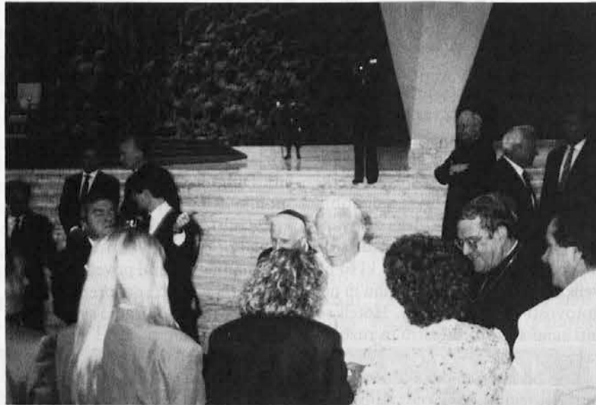
Srečanje slovenskih romarjev s sv. očetom

Mnogim bo ostal dogodek v spominu, še posebno zaradi fotografij, ki so si jih mnogi naročili. Vse je bilo lepo. Pogrešali smo pa slovensko besedo iz papeževih ust. Saj nas ni bilo samo 50. Tržaški slovenski avtobus je imel 50 romarjev in še veliko naših ljudi je bilo raztresenih po drugih avtobusih. Nekateri so prišli z letali, drugi z vlakom. Ura je bila četrta na dve, ko je sveti oče pozdravil še zadnje romarje, nato škofo in