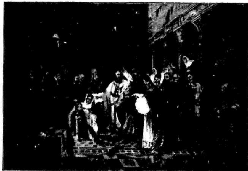
Kronanje kralja Zvonimira.

Krasna velika slika 95 cm. široka in 63 cm. visoka brez okvirja. Z velikim dragoceninim okvirjem stane 32 gld., na mesečne obroke 35 gld.