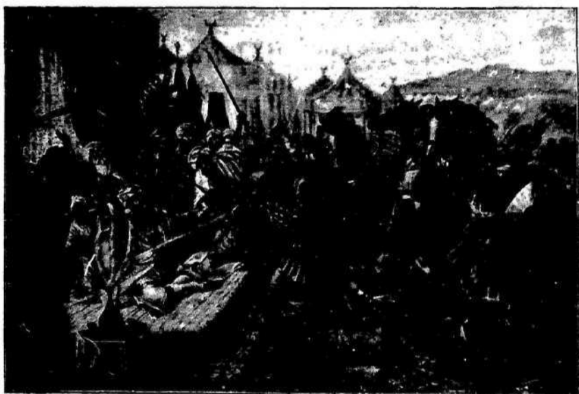
Miloš prebode turškega sultana Murata.