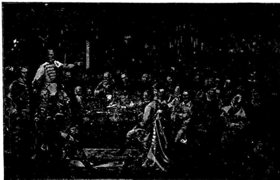
Hrvatski sabor — Velikost enaka prvi sliki. Cena 24 gld.