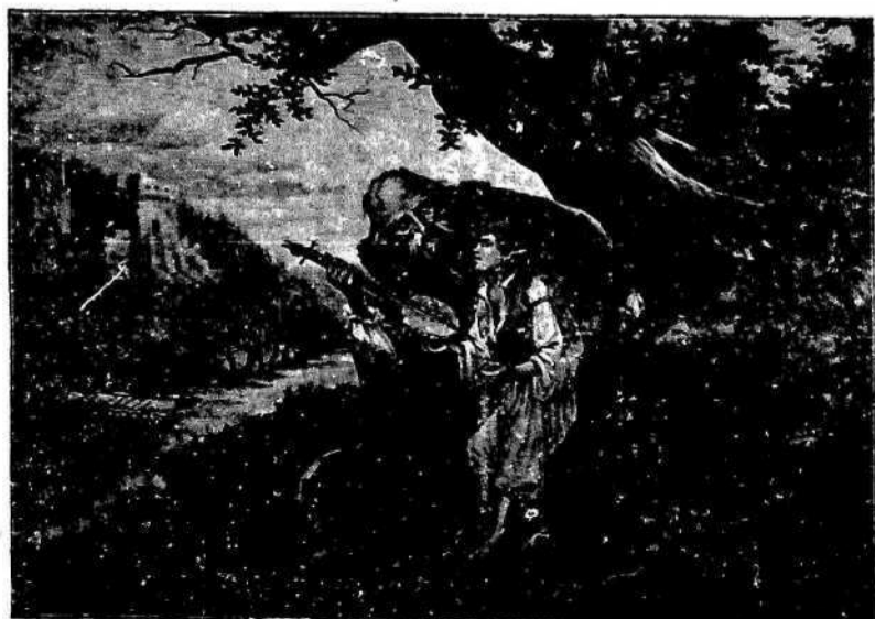
Ded in unuk. Velikost 58 x 79 cm.; cena 24 gld.

Slika slovečega vodje stranke prava. Velikost 68 x 55 cm.; cena 15 gld.