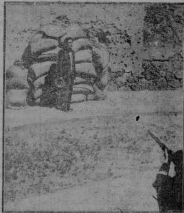
Ogromen požar v severoameriškem mestu Cikago. — Desno: Morilca mehičanskega predsednika Obregona ustrelijo v mestu Meksiko.