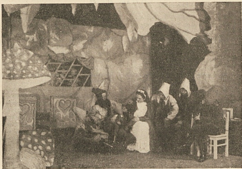
Sneguljica (Metka Berčičeva) med palčki.

Gornja režiserska navodila so v nemškem jeziku vpisana med verze slovenskega pasijonskega besedila iz leta 1721. Pri nekaterih poznejših uprizoritvah so se tu in tam nekoliko spremenila (poznamo spored iz leta 1727 in 1728), toda bistveni del je ostal vedno enak. Zanimivo je še primerjati, kdo vse je sodeloval pri procesiji in kakšna je bila njena organizacijska oblika. Po razpoložljivih virih se da rekonstruirati sledeča izbira igralcev po zgoraj oštevilčenih slikah.