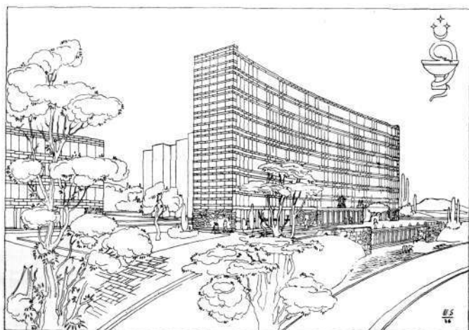
GLAVNI OBJEKT — KLINIKA