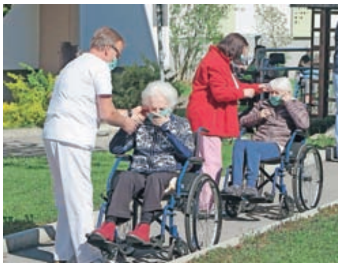
Zaposlenim je z obilo truda in požrtvovalnosti starejše uspelo zaščititi pred virusom.

rus zunaj doma uspelo zadržati z obilo truda in požrtvovalnosti in prepričani so, da bo tako tudi v prihodnje. Predsednika pa je pozvala, naj pripomore k temu, da bodo za svoje delo v zadnjih tednih tudi pošteno plačani.