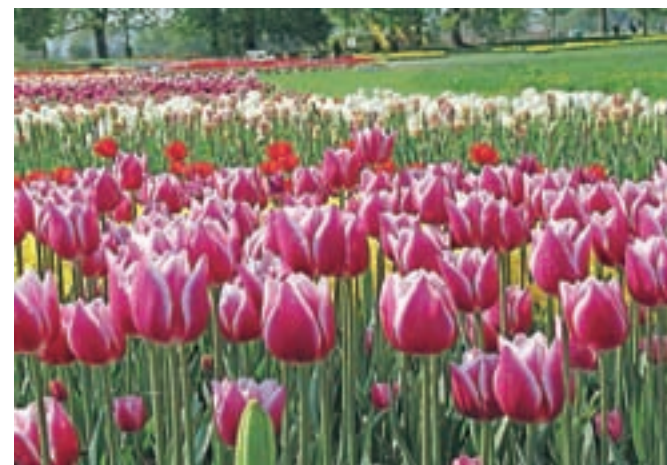
V Arboretumu letošnjo pomlad cveti okoli štiristo različnih sort tulipanov.