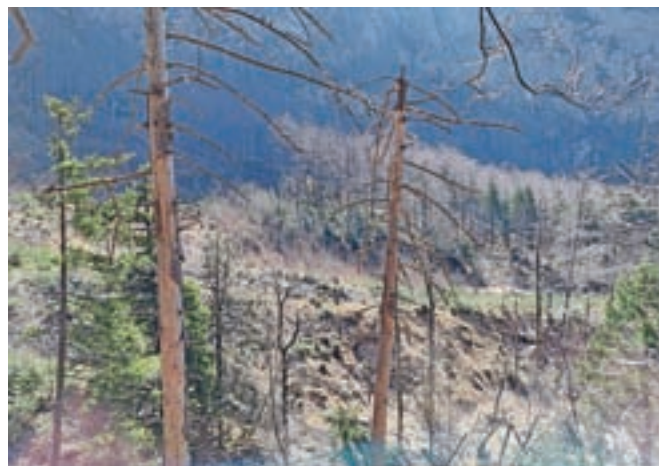
Ostanki gozda v dolini Kamniške Bele

Na posekah ostajajo kupi suhih vej, ki ne samo kazijo okolič, temveč lahko povzročijo širitev gozdnih škodljivcev, po-