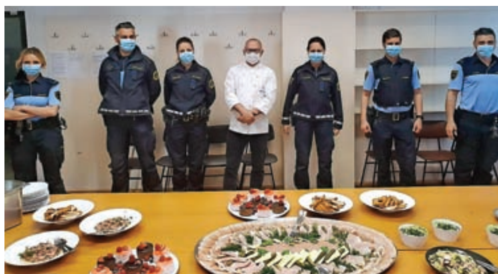
Janez Bratovž je takole pogostil kamniške policiste.