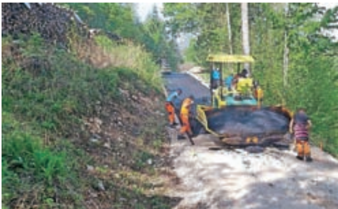
Rekonstrukcija občinske ceste Žaga–Podstudenc

Na področju rednega vzdrževanja občinskih cest je občina od ministrstva za infrastrukturo prejela obvestilo, da se v času epidemije koronavirusa v sklopu rednega vzdrževanja izvajajo samo neodložljiva dela oziroma nujna dela, ki so navedena v Pravilniku o rednem vzdrževanju javnih cest. V