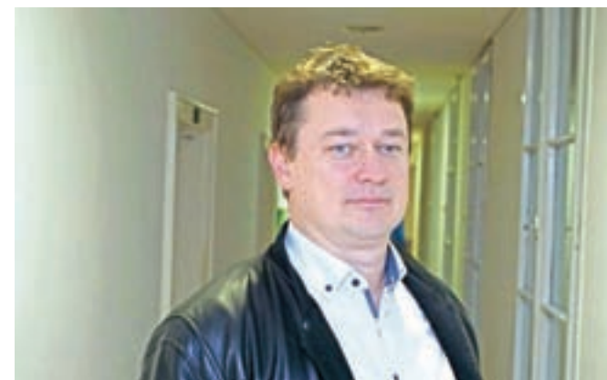
Urban Bergant / FOTO: ARHIV GORENJSKEGA GLASA

primorana vse svoje dejavnosti preseliti na svetovni splet, ugotavlja, da jim sodobna tehnologija omogoča tudi širitev na tuje trge. Na čimprejšnji ponoven zagon se pripravljajo tudi v Elektrini. Po Bergantovem mnenju bo ključno, da bodo