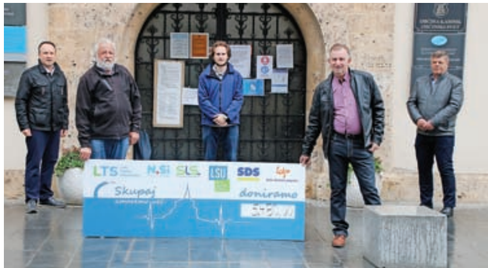
V času epidemije so skupaj stopili tudi občinski svetniki.