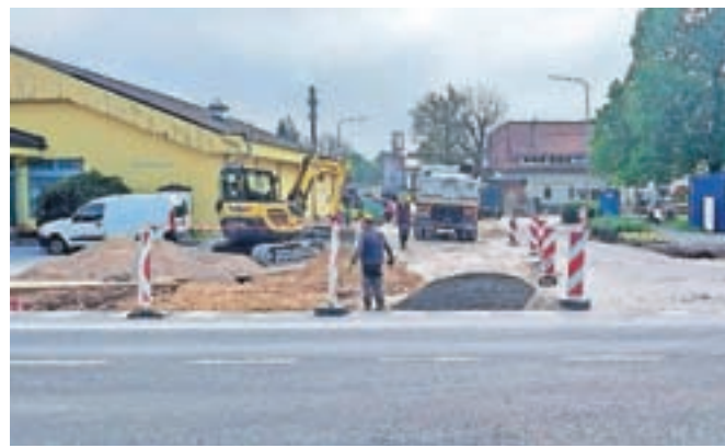
Urejanje križišča v Šmarci

z Direkcijo Republike Slovenije za infrastrukturo sklenjena sofinančerska pogodba. V mesecu decembru lani smo z izbranim izvajalcem podpisali gradbeno pogodbo, v aprilu pa smo začeli delati. Dela se bodo v skladu s terminskim planom