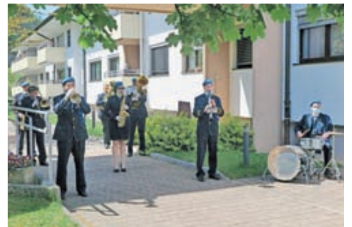
Osmerica godbenikov Mestne godbe Kamnik na dvorišču Doma starejših občanov Kamnik

Osem godbenikov se je tako v četrtek, 30. aprila, ob 11.30 z zaščitno opremo zbralo na dvorišču Doma in starejšim, ki so njihovim koračnicam prisluhnili v atriju, na balkonih ali kar pri odprtih oknih svojih sob, pričarali nekaj prazničnega vzdušja. Nato so s svojimi instrumenti naredili še krog okoli stavbe, da so jih lahko slišali tudi tisti, ki svojih sob ne morejo zapustiti.