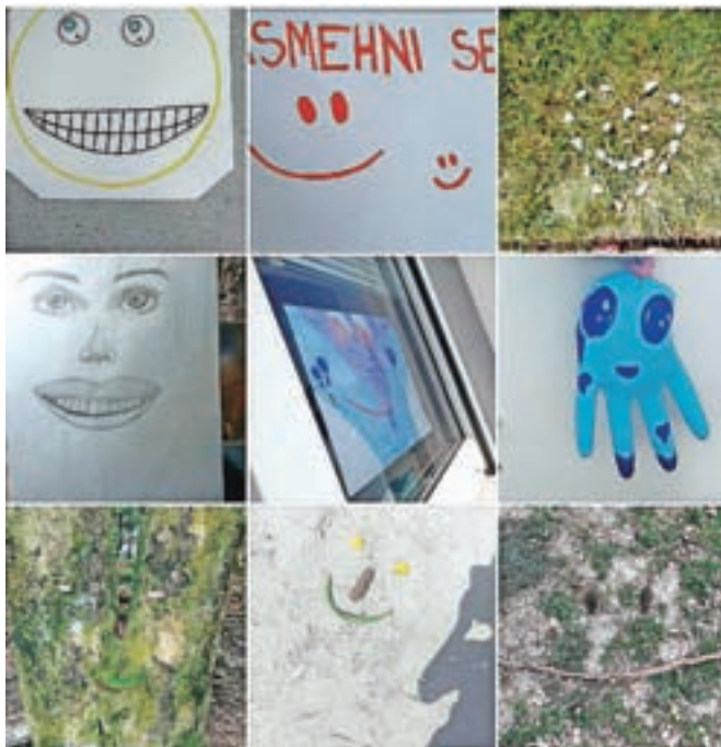
Veselite in srečo po Kamniku delijo nasmehi iz različnih materialov, nameščeni na različnih lokacijah.

V trenutnih življenjskih okoliščinah pa smo želeli dneve polepšati s srčnimi, pozitivnimi sporočili. Tako sva učiteljici z učenci 5. c