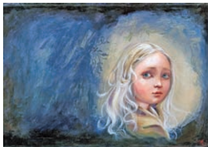
Izbor njenih ilustracij je na ogled na internetu, še letos pa sledi tudi razstava v galeriji Pogled.