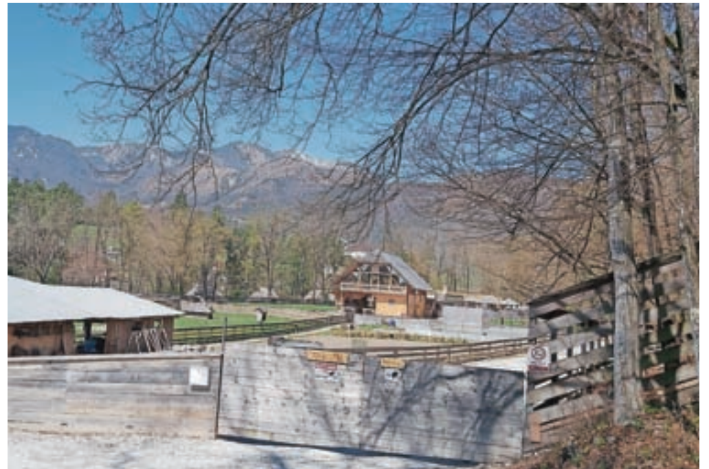
Slovenia Eco resort je še vedno zaprt.