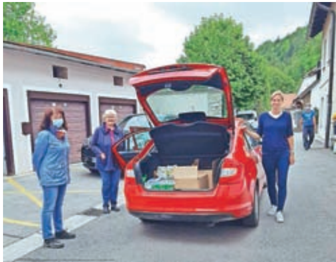
Razvoz paketov socialno ogroženim skupinam, med katerimi so predvsem starostniki

Še vedno je odprt tudi poseben transakcijski račun Območnega združenja Rdečega križa Kamnik, kamor lahko nakažete denar za pomoč, in sicer na številko TRR: SI56 0231 2001 1158 889 z obveznim pripisom namena: KORONAVIRUS 2020.