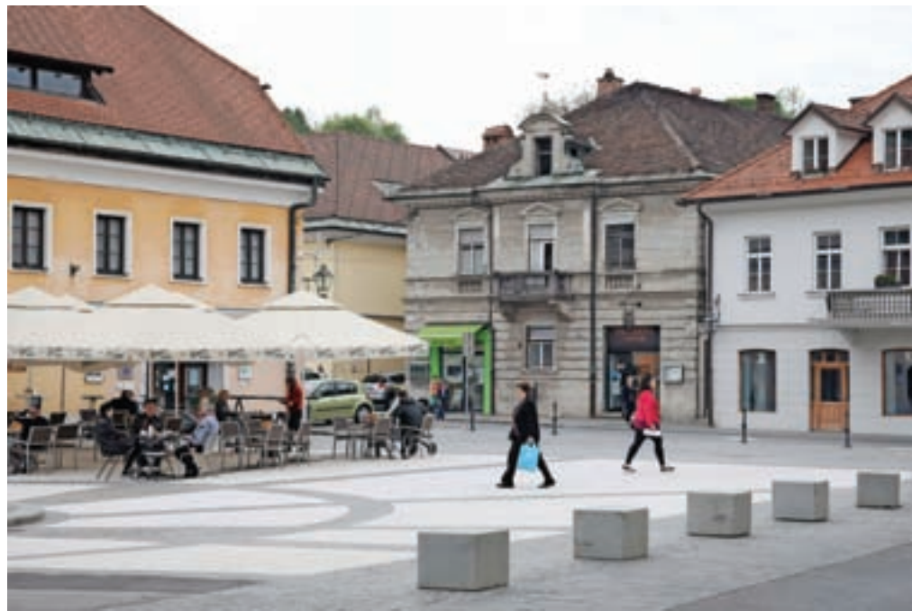
Utrip v mestu je znova živahnejši.

V ponedeljek, 4. maja, je svoja vrata delno odprla tudi Knjižnica Franceta Balantiča Kamnik, kar pomeni, da