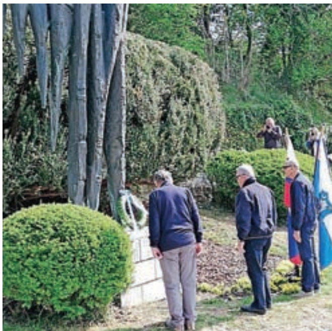
Položitev venca k spomeniku revolucije v Parku Evropa

Kamnik – Kljub trenutni situaciji, ko so vse svečanosti odpadle, smo 79. obletnico ustanovitve Osvobodilne fronte (OF) obeležili s kratkim kulturnim prispevkom. Na ta dan leta 1941 je bila v Ljubljani ustanovljena Protiimperialistična fronta, ki se je po nemškem napadu na Sovjetsko zvezo 22. junija 1941 preimenovala v Osvobodilno fronto slovenskega naroda. OF je bila sicer ustanovljena v noči med 26. in 27. aprilom 1941, v hiši književnika Josipa Vidmarja, kjer so se sestali predstavniki nekaterih političnih strank in kulturnih delavcev. Prvotno ime ob ustanovitvi je bilo Protiimperiali-