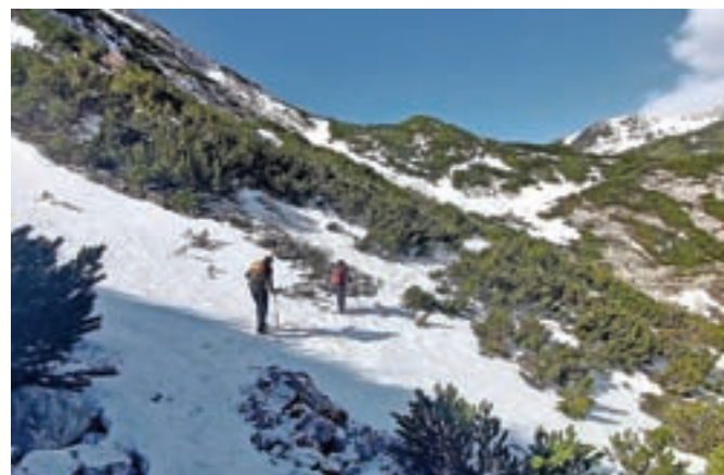
Kljub pomladnim temperaturam v dolini v visokogorju še vladajo zimske razmere.

bolj tveganih planinskih dejavnosti,« sporočajo na PZS, kjer imajo za planince v času epidemije sicer pohvalne besede. Priporočil in omejitev so se pridno držali, zato je bilo posredovanje gorskih reševalcev v minulih tednih minimalno. Omejitve v gorah so potrebne zato, ker se ob upoštevanju vseh protokolov intervencijski čas od poziva gorskih reševalcev do prihoda do ponesrečenca bistveno podaljša, tudi če je poškodovani na planinski poti, ki je po kategorizaciji označena