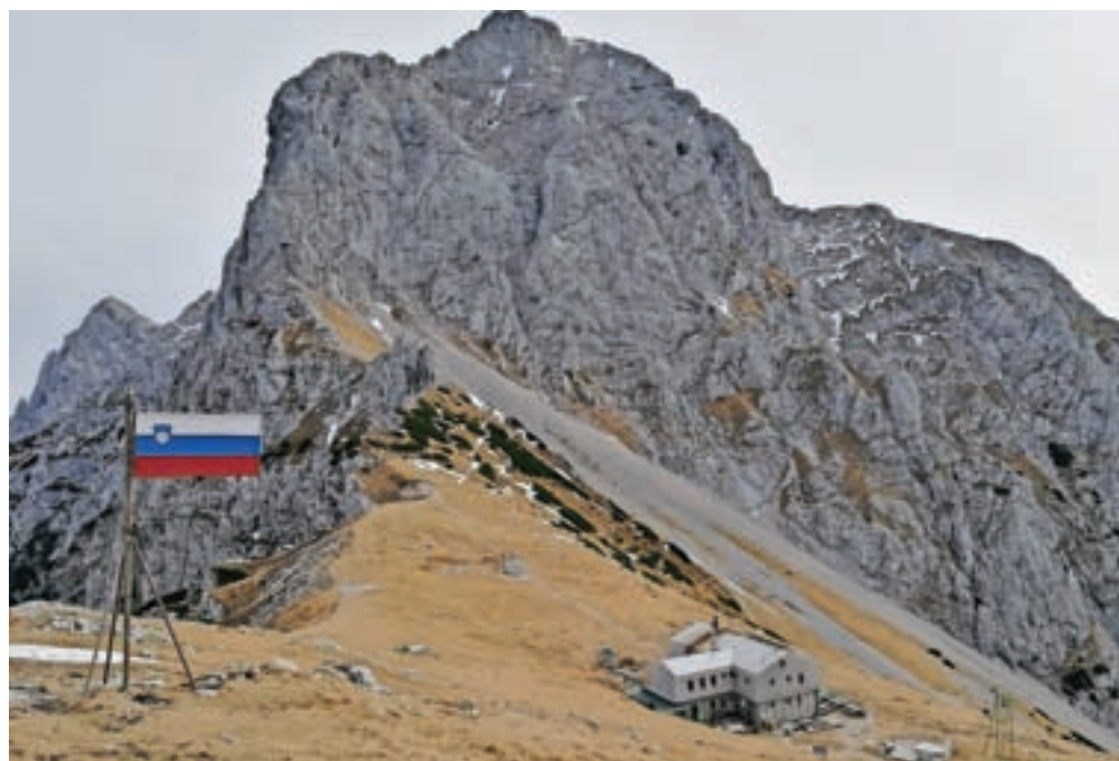
Kočje na Kamniškem (na sliki) in Kokrskem sedlu sta še zaprti, v nižje ležečih (denimo na Veliki planini) pa na terasah že lahko strežejo hrano in pijačo.

Kamnik – Čeprav je vlada z 18. aprilom začela s postopnim sproščanjem ukrepov in dopuščanjem nekaterih športnih dejavnosti, na Planinski zvezi Slovenije (PZS) opozarjajo, da se morajo planinci še naprej držati odlokov pristojnih institucij. »V planinski organizaciji se zavedamo, da je telesna dejavnost na prostem pomembna za zdravje posameznika in da je v teh čudovitih pomladnih dneh težko ostati doma. Razglasitev epidemije v RS še vedno velja in obiskovalci gorskega sveta se moramo držati odlokov pristojnih institucij. Svetujemo, da se izogibate zahtevnih in zelo zahtevnih planinskih poti, turne smuke in nasploh visokogorja in