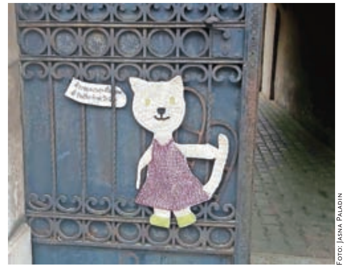
... na enih od vrat pa muca Copatarica v kvačkani izvedbi.