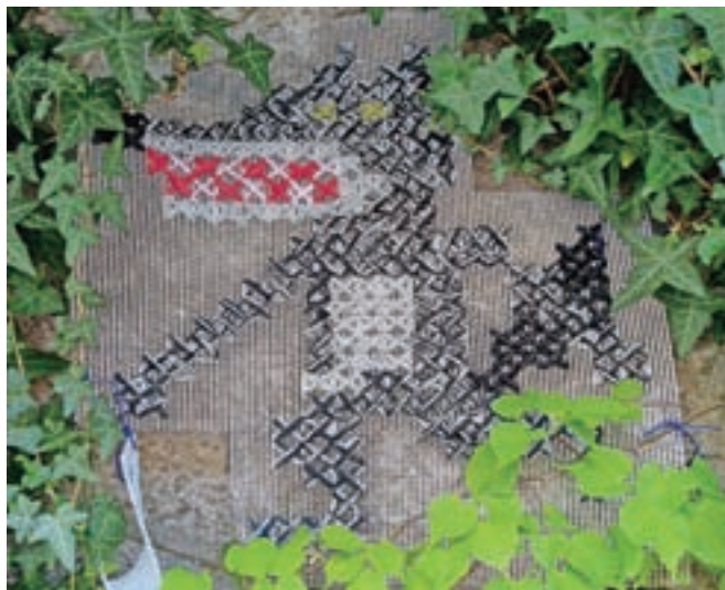
V grmovju se je takole skrival volk iz Rdeče kapiče ...

Do konca aprila so na knjige po mestu tako opozarjali bela kača s kronico, obuti maček, muca Copatarica, Rdeča kapiča in tudi volk. Vsekakor lepa spodbuda za opazovanje mestnih ulic in branje pravljic ter knjig nasploh.