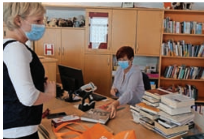
Med prvimi je vrata ponovno odprla knjižnica.

V mestu so ponovno zaživele nekatere terase gostinskih lokalov, vrata so odprli frizerski in lepotni saloni, številne trgovine ..., znova pa je treba plačati tudi parkirnino na vseh parkirnih mestih, ki so v lasti občine.