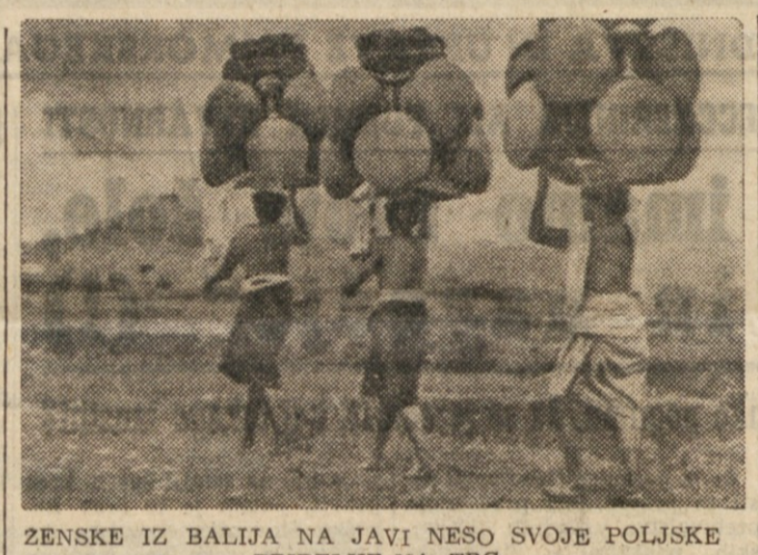
ZENSKE IZ BALJA NA JAVI NESO SVOJE POLJSKE PRIDELEKE NA TRG.

S formalnim prenosom suverenosti na novo ustanovljeno zvezno republiko Združene države Indonezije je bil volk bolj sit kot ovca cela. Ljudstvo pa si bo s svojo vztrajno borbo gotovo priborilo toliko zaželjeno svobodo