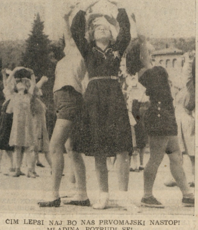
CIM LEPSI NAJ BO NAS PRVOMAJSKI NASTOP! MLADINA, POTRUDI SE!