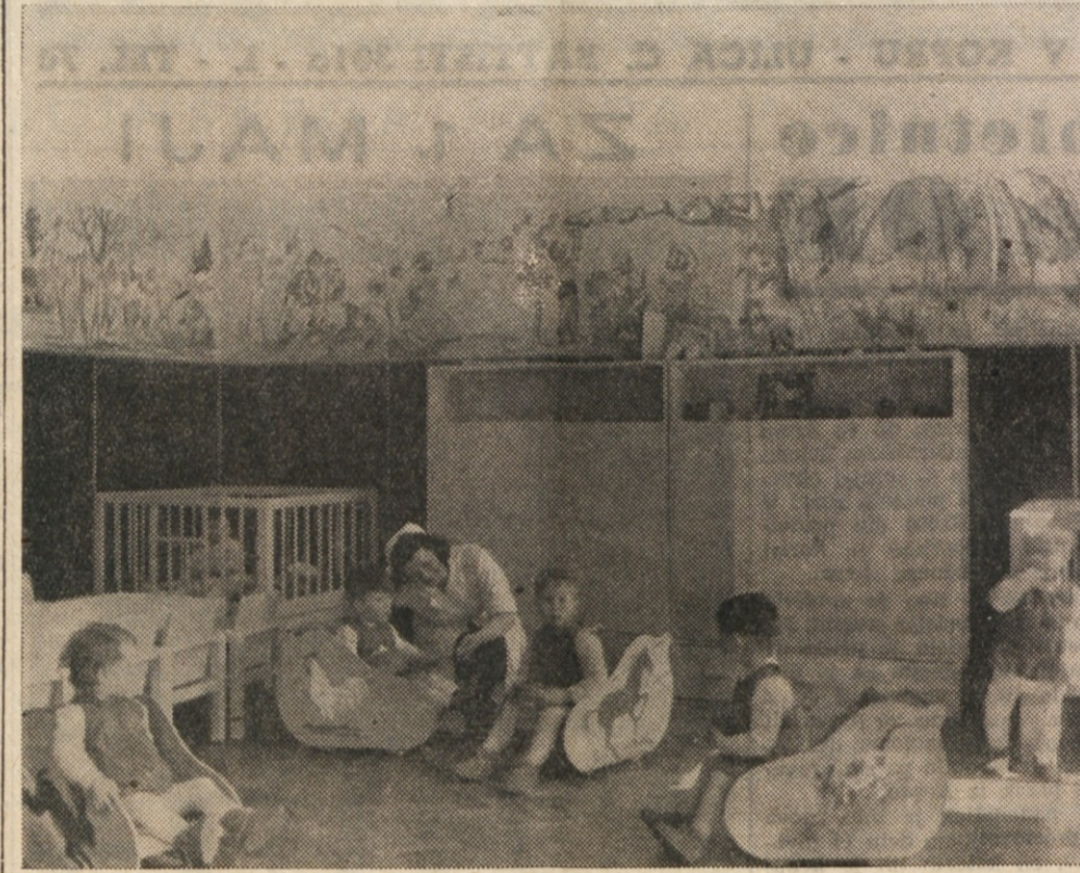
MEDETEM KO JE MATI NA DELU, SE NJEN OTKOR RAZVIJA POD STROKOVNIM IN PEDAGOSKIM VODSTVOM TER VZGAJA V DUHU LJUBEZNI DO NOVE SOCIJALISTICNE JUGOSLAVIJE V JASLIH (DO 3. LETA), V DOMU IGR IN DELA (OD 3 DO 7 LETA) TER NA OTROŠKIH IGRISCIH. V SLOVENIJI IMAJO DOSLEJ 92 DOMOV IGR IN DELA IN 80 IGRISC. NA SLIKI: IGRALNICA V JASLIH JESENISKE ZELEZARNE.