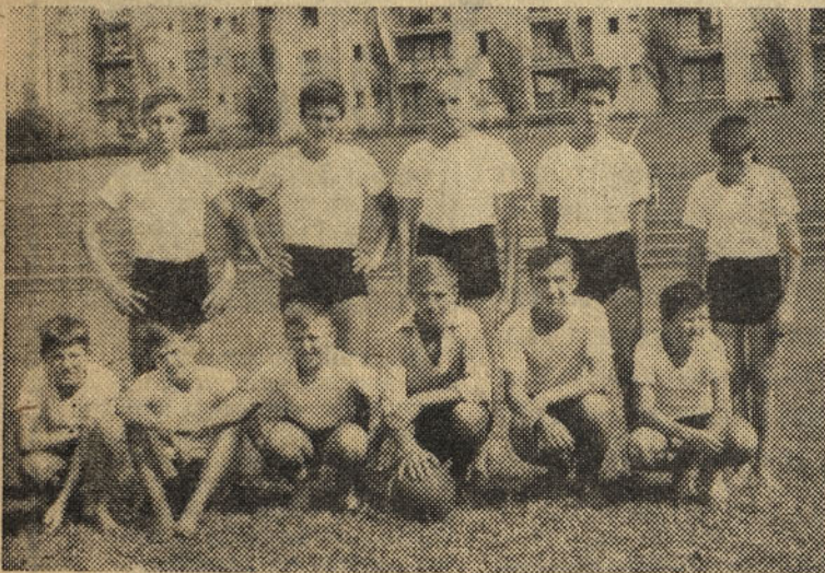
Ekipa pionirjev, ki nas je povs od in vedno častno zastopala

prednosti zmoglo zadržati ta položaj s tem pa tudi uvrstitev v višji rang tekmovanja tj. v I. razred tekmovanja področja NP Celje, kamor tudi po kvaliteti spada.