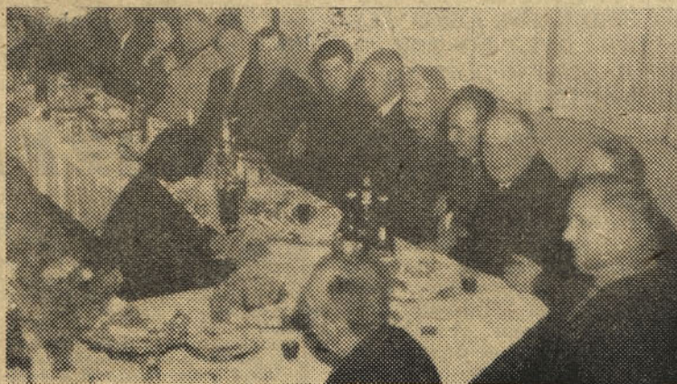
Naši upokojenci iz preteklega leta na poslovni zakuski