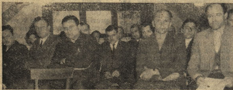
Clani DSP med zasedanjem