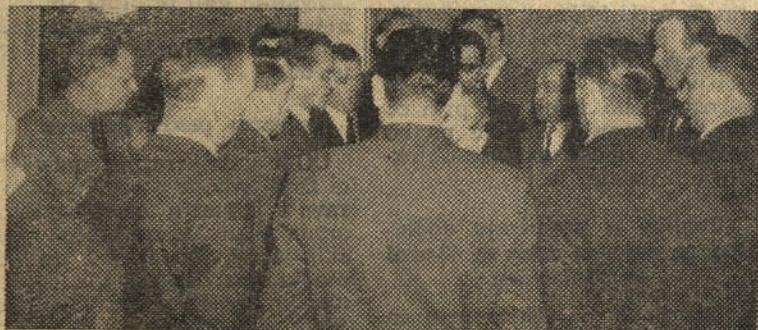
Pevski zbor DPD »Svoboda« Štore med izvajanjem

Na tem zasedanju je delavski svet podjetja razpravljal o stopnji in kvoti investicijskega vzdrževanja za prihodnje leto ter potrdil predlog upravnega odbora, ki je predvidel 4 milijone