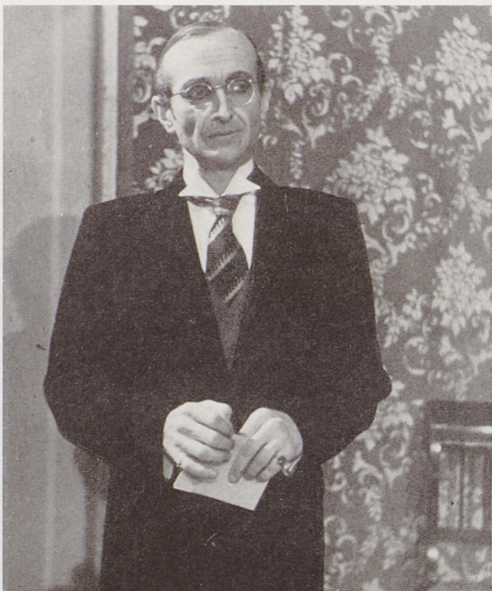
Edo Verdonik v Shawovih Izkoriščevalcih (1939—40)