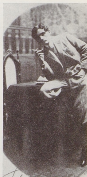
Igralec Rado Železnik