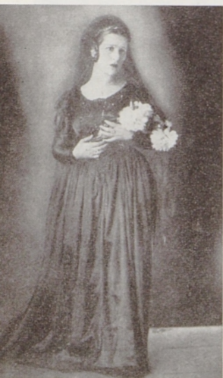
Ema Starčeva kot Kraljica v Hamletu (1934—35)