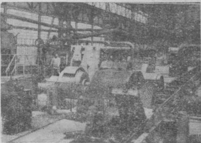
Ena izmed dvoran tovarne »Ivo Lola Ribar«

Mislím, da bi bila najbolj realna rešitev proizvodnja opreme za domačo industrijo. Zal pa tu (in ne samo mi) zadevamo za »kontakte z inozemstvom« za vsako turo?« »Je tudi to. Vsekakor menim, da bi bilo treba nekako raziskati motive tega nezaupanja v domačo opremo in nekaj ukreniti.