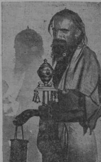
Berač iz indijskega mesta Madras. Prosjak vzbuja nase pozornost mimoidečih z zvončki.

Na novem mestu je nadaljeval svoj boj proti načelstvu stranke, da je bila stranka prisiljena, poklicati ga pred strankino sodišče, kjer je bil Džugašvili kot nespravljiv intrigant izključen iz organizacije. Ko je bil iz Tiflisa izgnan, je vstopil v batumsko organizacijo. In tudi tukaj je hotel biti takoj načelnik stranke.