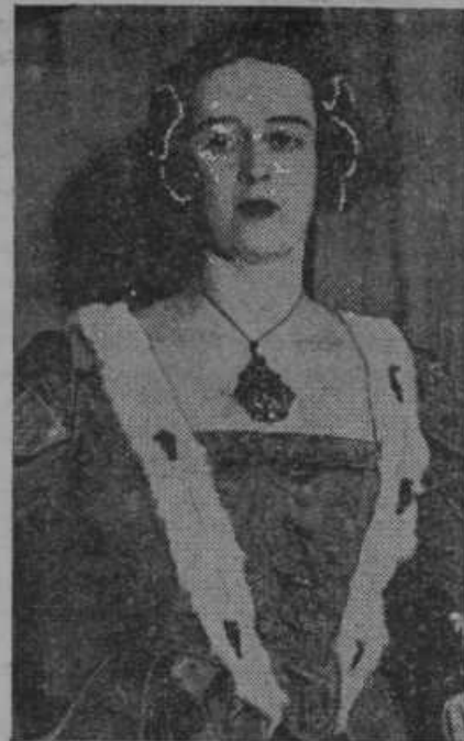
Bodoča albanska kraljica. Albanski kralj Zogu se bo poročil z madžarsko grofico H. Mikes, ki je nečakinja nekdanjega ogrskega ministrskega predsednika grofa Bethlena.

»Stalin se ni izpremenil, ko je prišel prišel na čelo države. Njegova večna strast je gospodovati nad ljudstvom. Ne išče osebne koristi, a politično je nemoralen. Ima vedno zapisnik tovarišev, kojih vpliv hoče odstraniti, kadar spozna za potrebno. Tudi zdaj, ko je v njegovih rokah vsa oblast, so izgotovljeni zapisniki gotovih in mogočih nasprotnikov in je že naprej določeno, kdo in kdaj mora