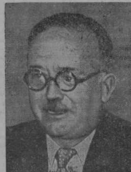
Vincent Auriol, francoski finančni minister, je napovedal, da bode uporabil od državnega proračuna za leto 1937 60% za odplačilo vojnega dolga in za nadaljnje oboroževanje.