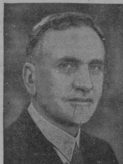
Hachem Atassi je bil izvoljen za predsednika republike Sirija v Mali Aziji.