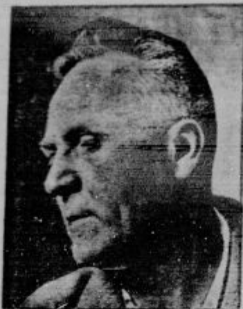
Petar Šaljapin — 60-letnik, Fjodor Šaljapin, svetovnoznani ruski operni pevec, čigar ulogi v »Boris Godunov« in »Donu Basilije« sta nepozabni, praznuje šestdesetletnico življenja.