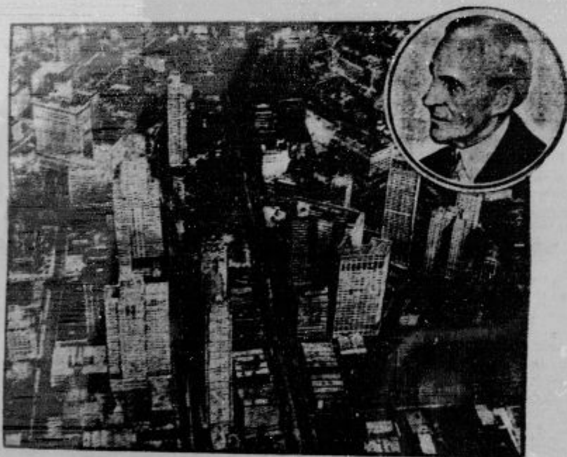
Detroit, najvažnejše michigansko mesto, ki se bobni z nebotičniki avtomobilskih koncernov. V krogu: Henry Ford, radi katerega so prišle banke v katastrofalen položaj. — Ameriška država Michigan, v kateri imajo svoje sedeže malone vsi pomembnejši ameriški avtomobilski koncerni, je morala naznaniti 8 dnevni moratorij. Radj dokazuje denarne vodilnosti Michigana pa so se močno zamajala tla vsem ameriškim bančnim zavodom.