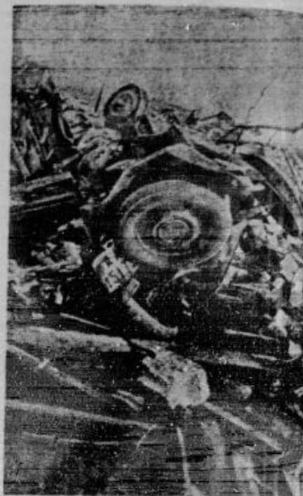
Izločen svinčak v kromhirčevski konstrukciji avtomobil, ki je med katastrofo stal na prosti, je pod zračni pritisk s tako silo na ruševine sosednih avtomobilov, da tvorijo deli avtomobilov, kolesa in kosci hibe tako rekoč nerazločljiv kaos ruševin.