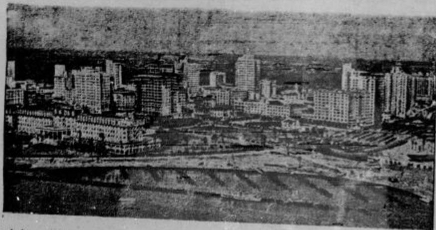
Pogled na sončno ameriško kopališče Miami med katerega zidovi se je dogodil te dni razburiljivi atentat na Roosevelta. Deano v ospredju je videti del kopaliških naprav, kjer je hotel Roosevelt govoriti 50.000 ljudem

Naročajte in čitajte naše katoliške liste: »Slovenca«, »Domoljuba« in »Bogoljuba«! - V vsako katoliško hišo katoliški časopis!